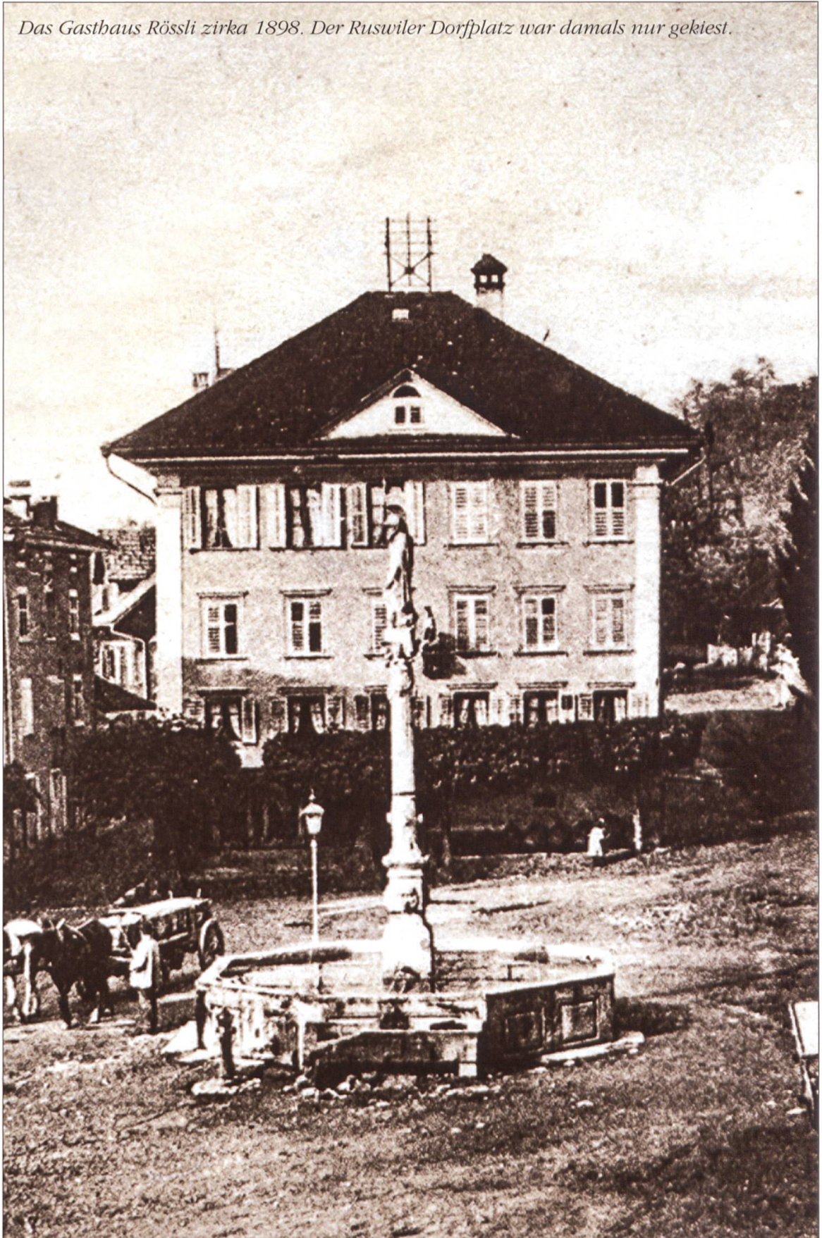
Das Gasthaus Rössli zirka 1898. Der Ruswiler Dorfplatz war damals nur gekiest.