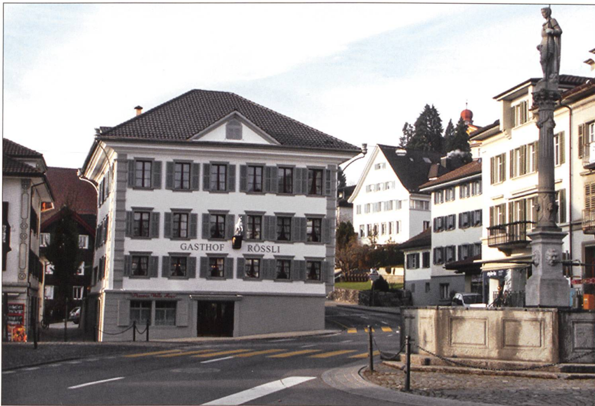
Das Gasthaus Rössli nach der Fassaden-Renovation von 2004.