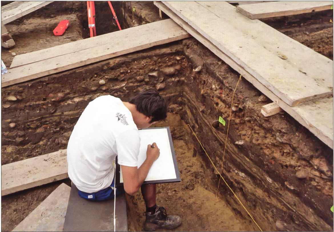
Dokumentation der komplexen archäologischen Strukturen am Chileplatz. Die hier sichtbare reiche Schichtabfolge spiegelt mehrere Hundert Jahre Willisauer Geschichte. Zum grössten Teil stammt sie vom vorstädtischen Dorf Willisau.

den jedoch auch in kleinen Sondierungen augenfällig. Ein solcher Prozess ist die Stadtwerdung Willisaus in der Zeit der Gründung um 1300. Diese äussert sich in weitflächigen Planien, welche bisher bei zahlreichen Grabungen in der Stadt festgestellt werden konnten. Die Unebenheiten des Dorfgeländes wurden ausgeglichen und mit einer Schicht aus Kies überschüttet. Ganz offensichtlich orientierten sich die neuen städtischen Strukturen nicht an den bestehenden: Wir müssen davon ausgehen, dass bei der planmässigen Umgestaltung des Geländes auch die dörfliche Bebauung – bis auf wenige Ausnahmen wie die Kirche – systematisch abgebrochen und die so genannten Hofstätten auf einer verdichteten Parzellierung neu errichtet wurden. Anstelle des Dorfes entstand