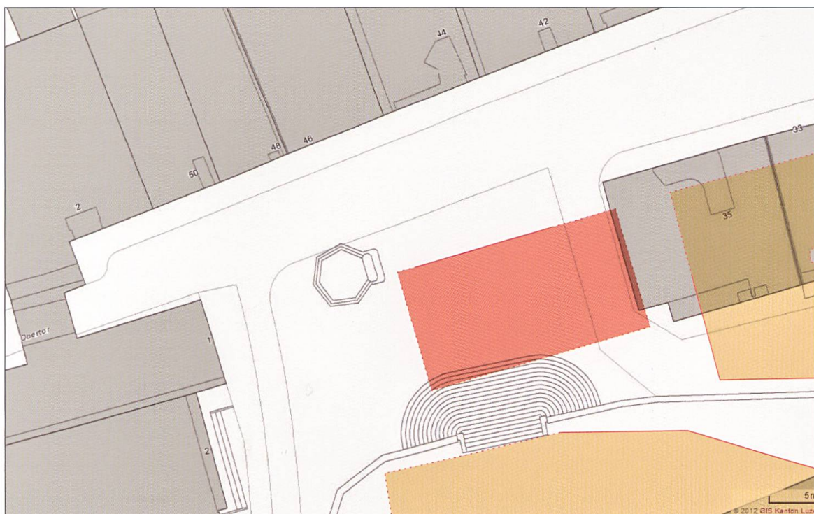
Übersicht zur mittelalterlichen Situation am Chileplatz gemäss den archäologischen Befunden. Orange: bisher archäologisch erfasste mittelalterliche Häuserzeilen östlich und südlich des Chileplatzes. Rot: hypothetische Ausdehnung der in der Grabung 2012 erfassten Marktballe aus der Zeit um 1300. Grafik Kantonsarchäologie Luzern

und Peter Eggenberger vorgelegten Rekonstruktionen der mittelalterlichen Bebauung liefern. Die Grabung Chileplatz und die beiden im Frühling 2012 angelegten Sondierungen vor den Häusern Hauptgasse 11 und 19 zeigen, dass die südliche Fassadenlinie der Hauptgasse mindestens bis zu den Stadtbränden im späten 14. Jahrhundert anders verliefen, als dies heute der Fall ist: Während die mittelalterliche Gassenflucht auf Höhe des Chileplatzes rund zwei Meter hinter dem heutigen Platzrand lag, die Hauptgasse also etwas breiter war, scheint sie gegen Osten hin schmaler geworden zu sein. Im Bereich der Häuser Hauptgasse 11 und 19 jedenfalls ragte die südliche mittelalterliche Häuserzeile offenbar weiter in die heutige Gasse vor. Durch diese vorgeschobene Fassa-