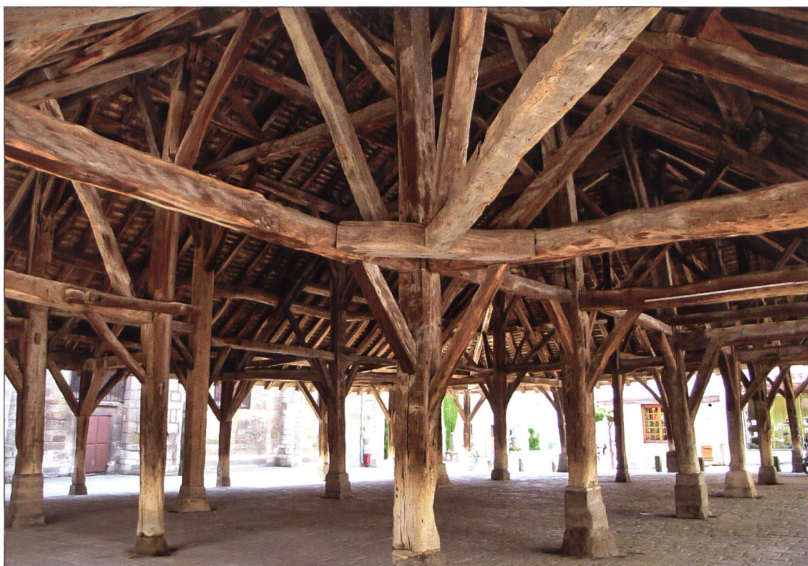
Im burgundischen Städtchen Nolay hat sich eine Markthalle aus dem 14. Jahrhundert erhalten. Eine ähnliche Konstruktion darf auch für das nach der Stadtgründung auf dem Chileplatz errichtete Marktgebäude angenommen werden.