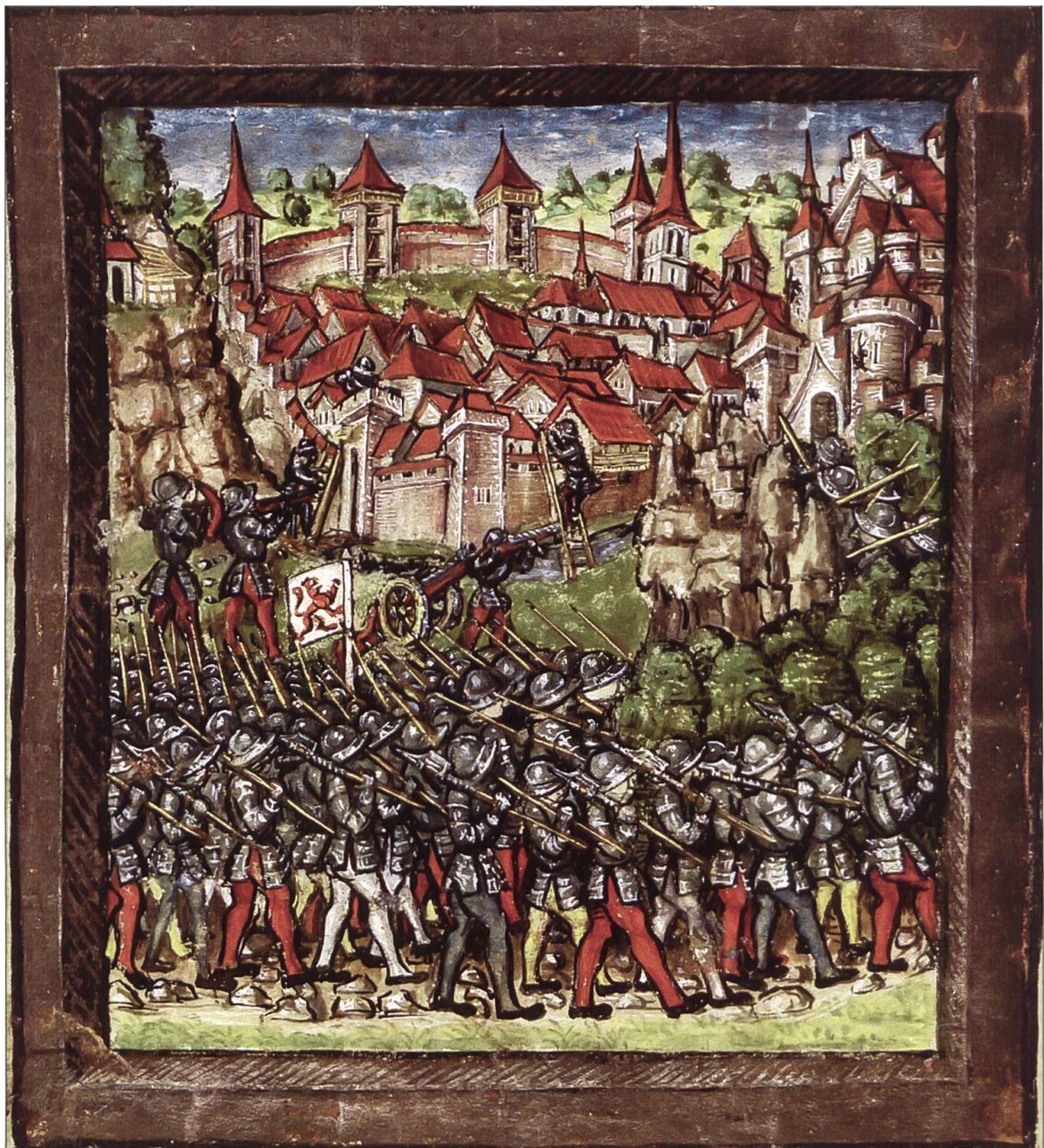
Diebold Schilling zeigt in seiner Luzerner Chronik die Zerstörung der – phantasievoll ausgestalteten – Stadt Willisau durch die habsburgisch-österreichischen Truppen 1386. Man beachte unter anderem die spätmittelalterliche Qualität der Strasse im Vordergrund, welche mit ihrer Festigung aus grossen Steinen eine recht holprige Angelegenheit dargestellt haben dürfte.