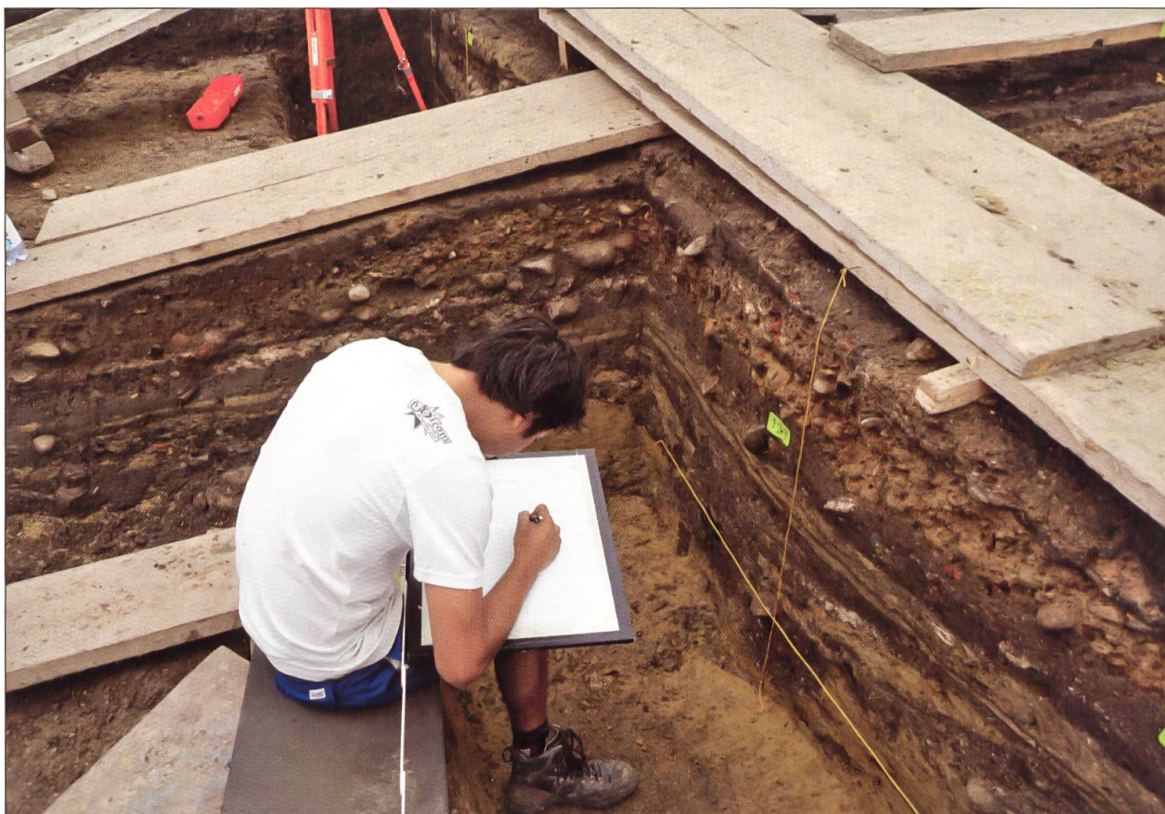
Dokumentation der komplexen archäologischen Strukturen am Chileplatz. Die hier sichtbare reiche Schichtabfolge spiegelt mehrere Hundert Jahre Willisauer Geschichte. Zum grössten Teil stammt sie vom vorstädtischen Dorf Willisau.

den jedoch auch in kleinen Sondierungen augenfällig. Ein solcher Prozess ist die Stadtwerdung Willisaus in der Zeit der Gründung um 1300. Diese äussert sich in weitflächigen Planien, welche bisher bei zahlreichen Grabungen in der Stadt festgestellt werden konnten. Die Unebenheiten des Dorfgeländes wurden ausgeglichen und mit einer Schicht aus Kies überschüttet. Ganz offensichtlich orientierten sich die neuen städtischen Strukturen nicht an den bestehenden: Wir müssen davon ausgehen, dass bei der planmässigen Umgestaltung des Geländes auch die dörfliche Bebauung – bis auf wenige Ausnahmen wie die Kirche – systematisch abgebrochen und die so genannten Hofstätten auf einer verdichteten Parzellierung neu errichtet wurden. Anstelle des Dorfes entstand