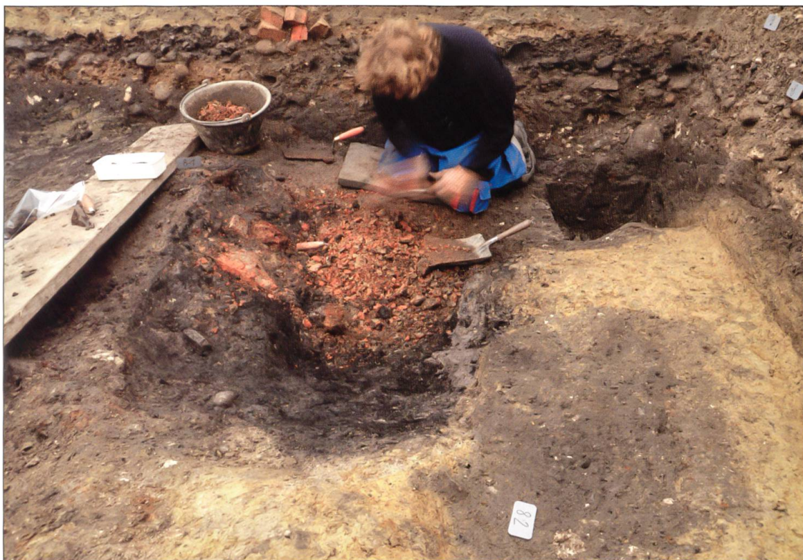
Freilegen einer mit Brandresten verfüllten Werkgrube unter dem Chileplatz: Zahlreiche Bodeneingriffe zeugen von intensiver handwerklicher Tätigkeit im vor der Stadtgründung bestehenden Dorf Willisau.

Die Erdschichten, die sich während der langen Nutzungsgeschichte in diesem gewerblich geprägten Hof abgelagert hatten, boten bei der Grabung ein beeindruckendes Bild (Vergleiche Abbildung Seite 190). Wegen des beschränkten Ausschnittes war eine konkrete Interpretation der komplexen archäologischen Spuren jedoch nicht abschliessend möglich.