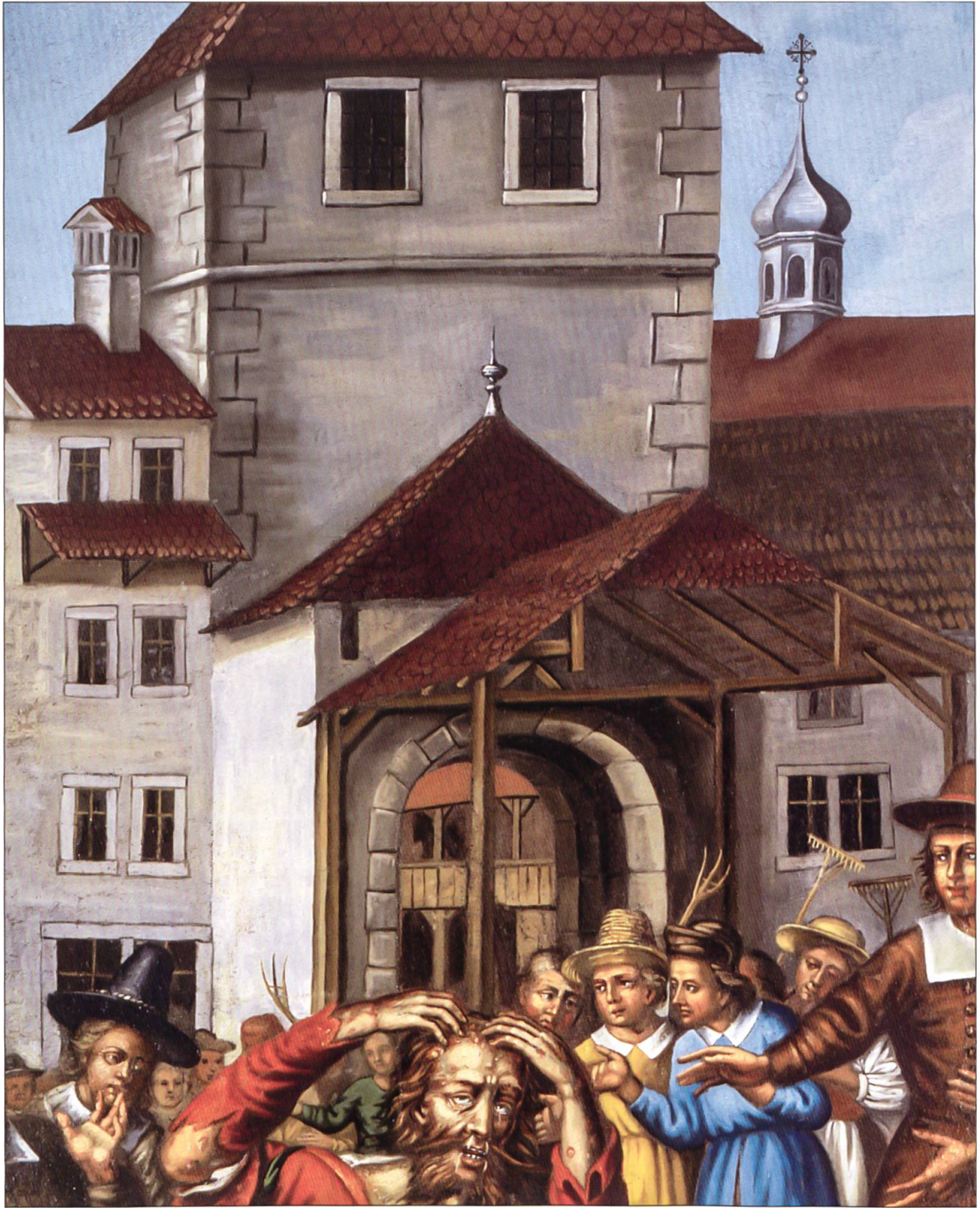
Ausschnitt aus dem Willisauer Heiligblut-Zyklus von 1638. Späht man durch das Obertor ins Innere der Stadt, erkennt man die beiden durch Holzpfeiler getragenen laubenartigen Geschosse des 1471 auf dem Chileplatz errichteten Willisauer Kaufhauses.