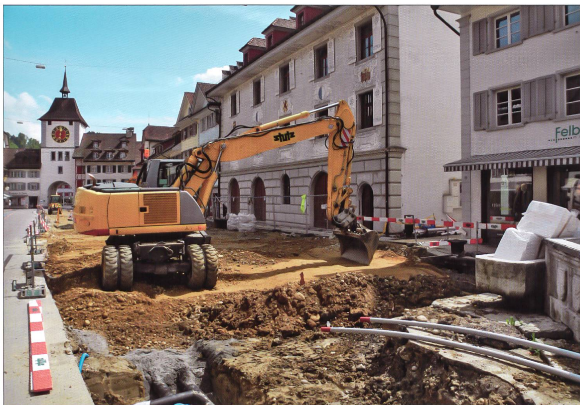
Die Willisauer Hauptgasse während der Bauarbeiten 2013. Die Lebensspuren von mindestens 30 bis 40 Generationen werden ohne Dokumentation abgetragen.