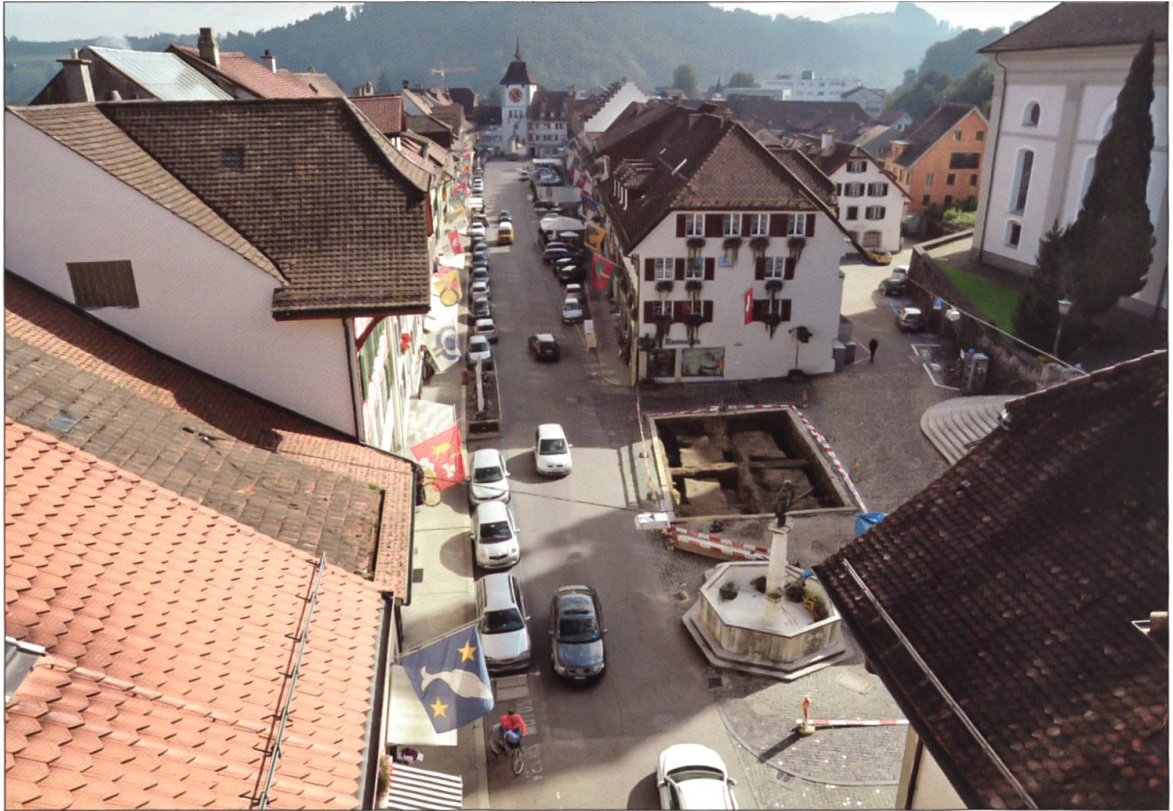
Willisau im September 2012 mit der Grabungsfläche auf dem Chileplatz, beim Ende der Ausgrabung. Blick vom Obertor über die Hauptgasse zum Untertor.