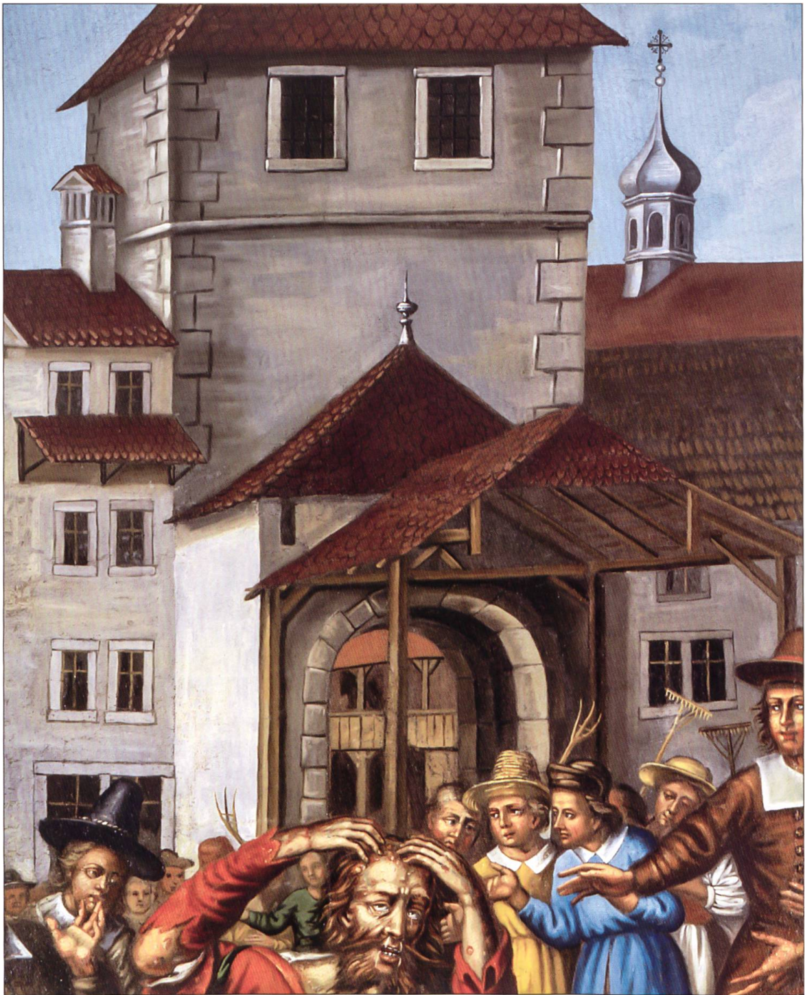
Ausschnitt aus dem Willisauer Heiligblut-Zyklus von 1638. Späht man durch das Obertor ins Innere der Stadt, erkennt man die beiden durch Holzpfeiler getragenen laubenartigen Geschosse des 1471 auf dem Chileplatz errichteten Willisauer Kaufhauses.