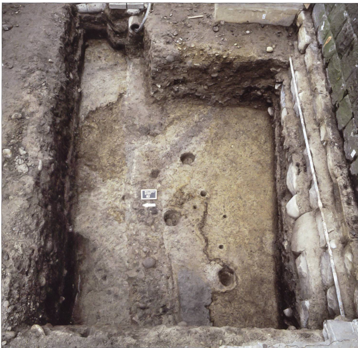
Am Fuss der Kirchhofmauer zeichnen sich in einer Grabungsfläche von 1995 verschiedene Pfosten- und Staketenlöcher ab, welche von der Besiedlung Willisau vor der Stadtgründung zeugen.