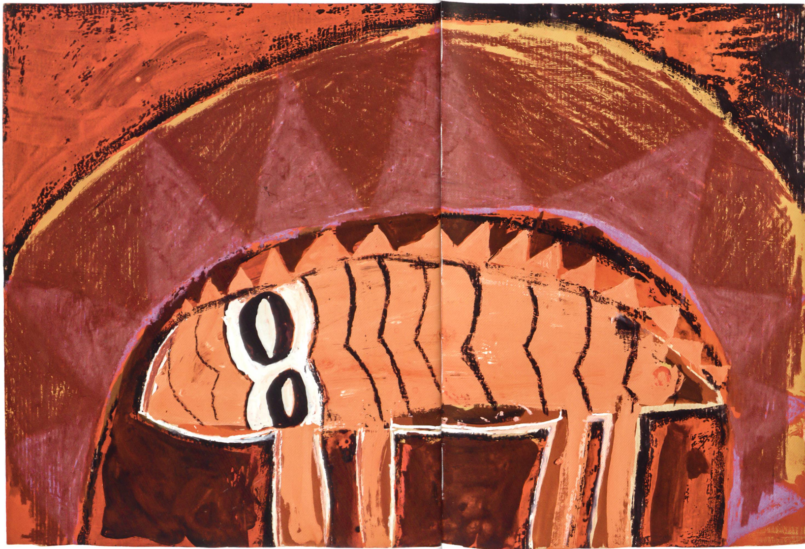
Obba Tittel. Pastell, Dispersion, Packpapier, undatiert. 30 x 45 Zentimeter. Kunstsammlung Kanton Luzern.