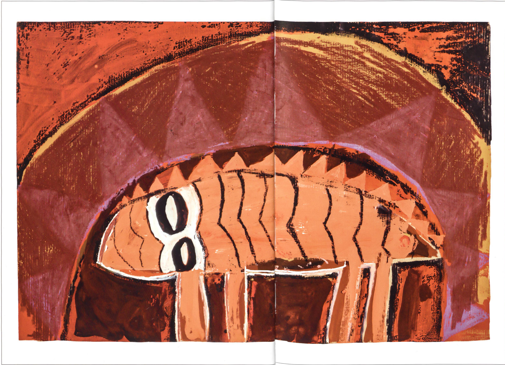
Obno Tiel. Pastell, Dispersion, Packpapier, undatiert. 30 x 45 Zentimeter. Kunstsammlung Kanton Luzern.