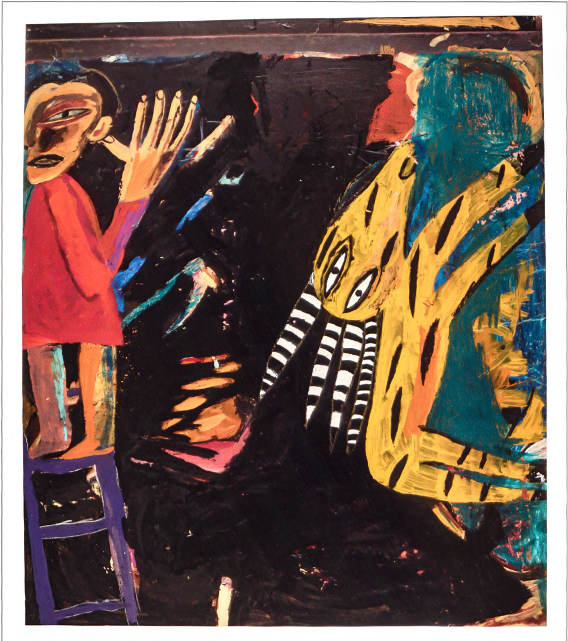
Obne Titel. Mischtechnik auf Plakat, undatiert. 101 × 87 Zentimeter. Privatbesitz.