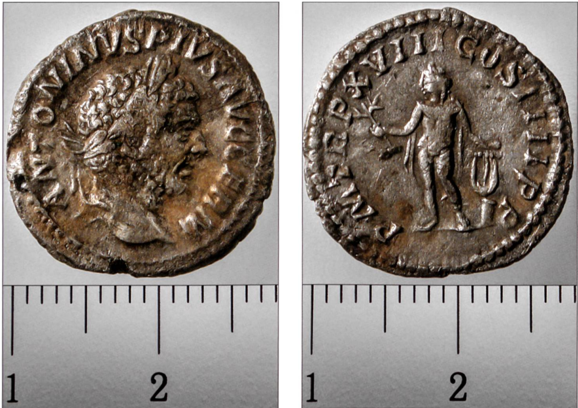
Silbermünze mit Porträt des römischen Kaisers Antoninus Pius (138–161).