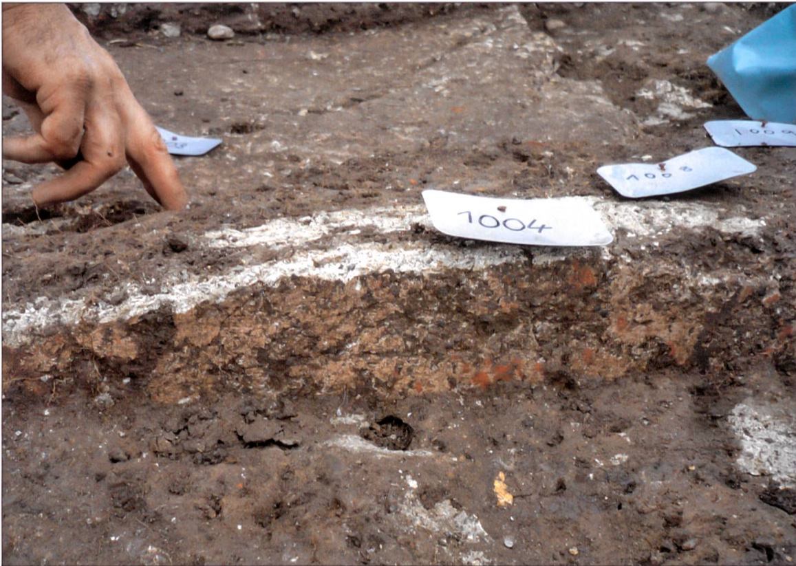
Detailansicht der Wandmalerei in Grabungsfläche 2.