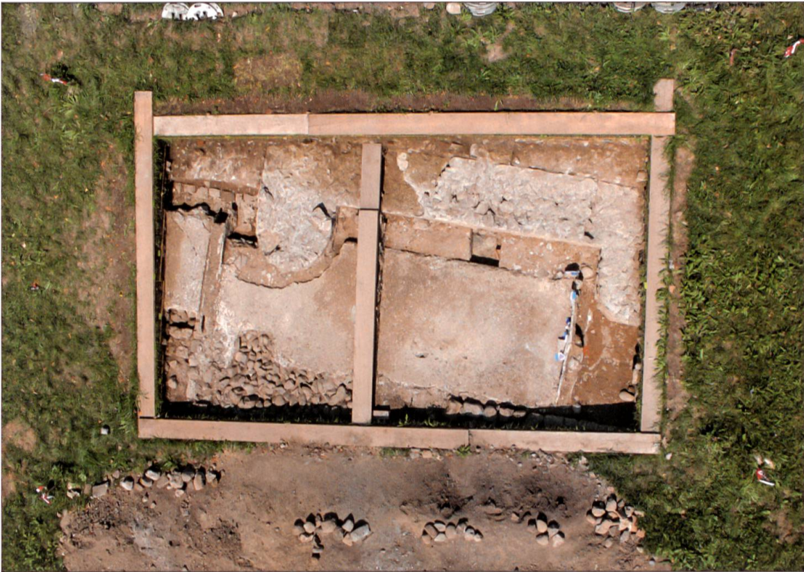
Grabungsfläche 2, oben (nördlich) die massive Mauer der Nutzungsphase 2.