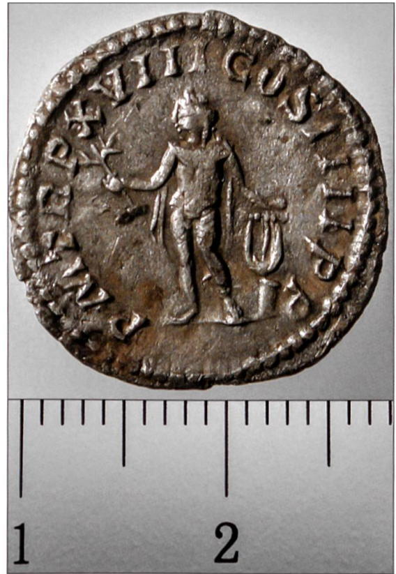
Silbermünze mit Porträt des römischen Kaisers Antoninus Pius (138–161).