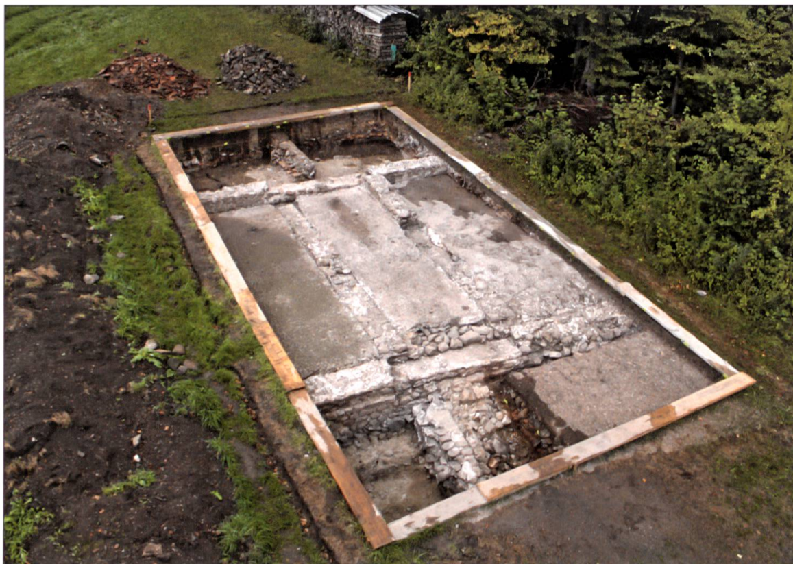
Grabungsfläche 1, in der Mitte der Korridor von Ost (hinten) nach West (vorne) mit Rampe zum Innenhof.

verwendet werden konnte, wurde abgeführt. So wurde auch der Steinwall im Norden und Osten der Fundstelle, den Isaac 1837 noch beschrieben hatte, schon längstens abgetragen.