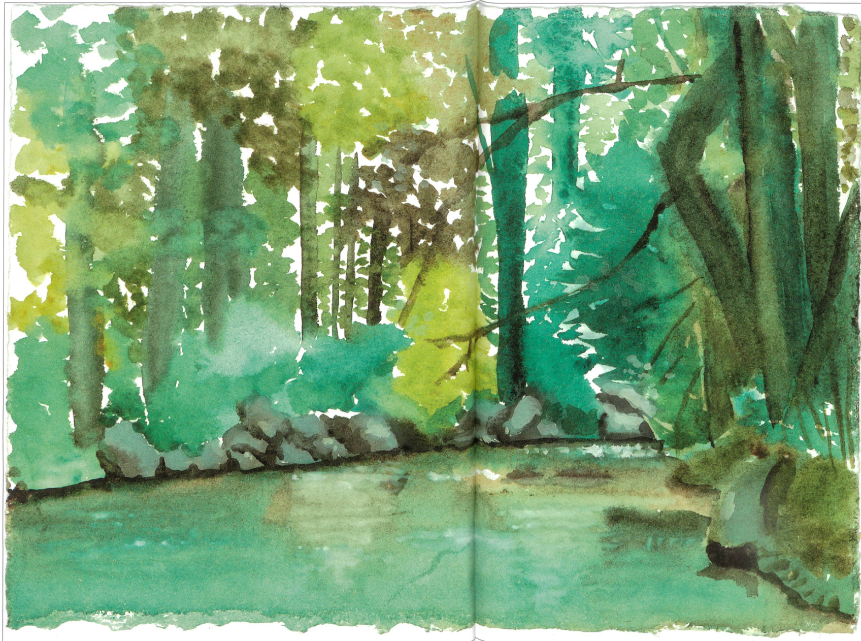
Kurt F. Hunkeler: Die Wigger bei Altisbofen. Kartenaktion Heimatver- einigung Wiggertal 2011.