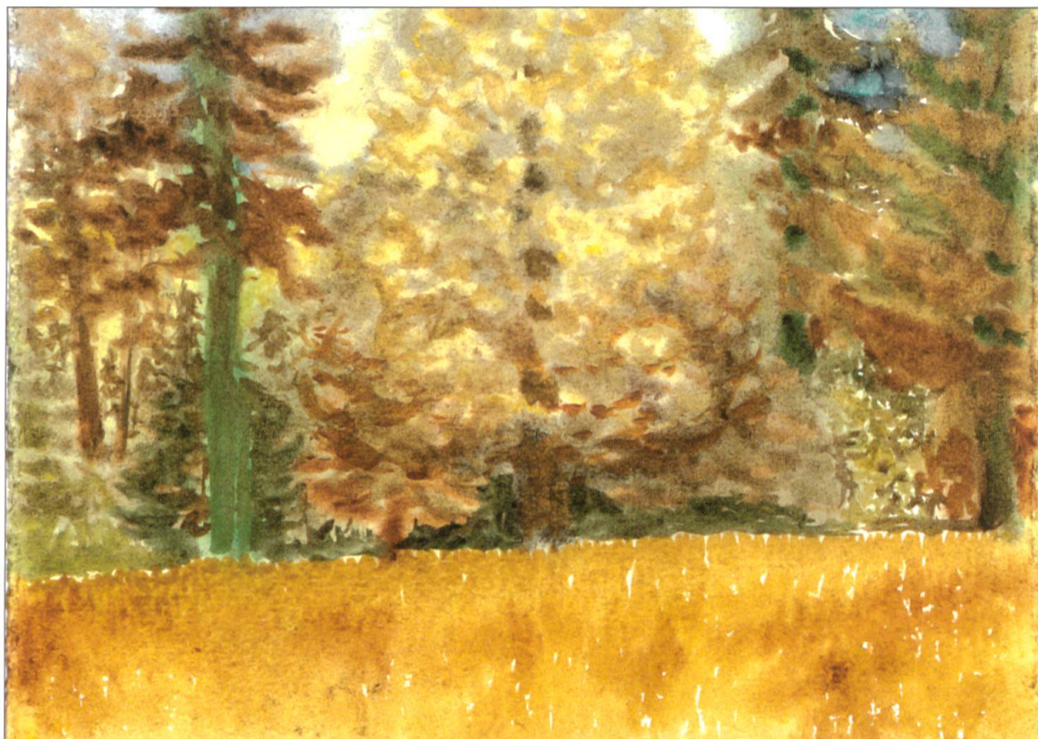
Kurt F. Hunkeler: Der Altishofer Wald bei der Pünte im Herbst.