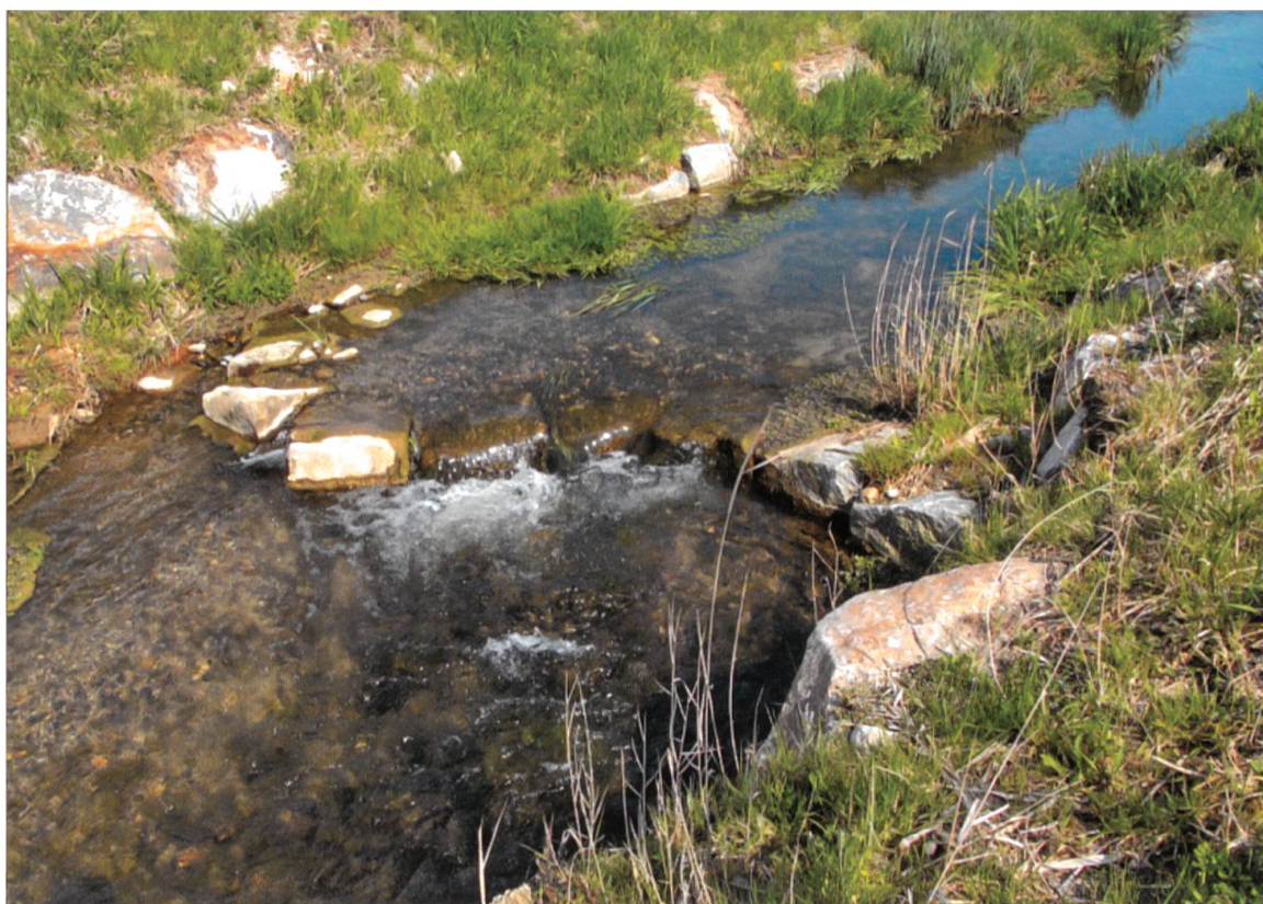
Bachbuhnen stabilisieren die Sohlenhöhe und lenken die Strömung.