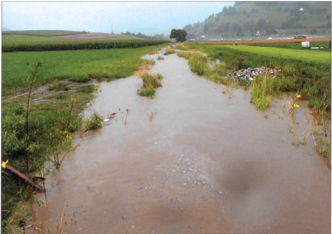
Hochwasser vom 27. Juli 2010.