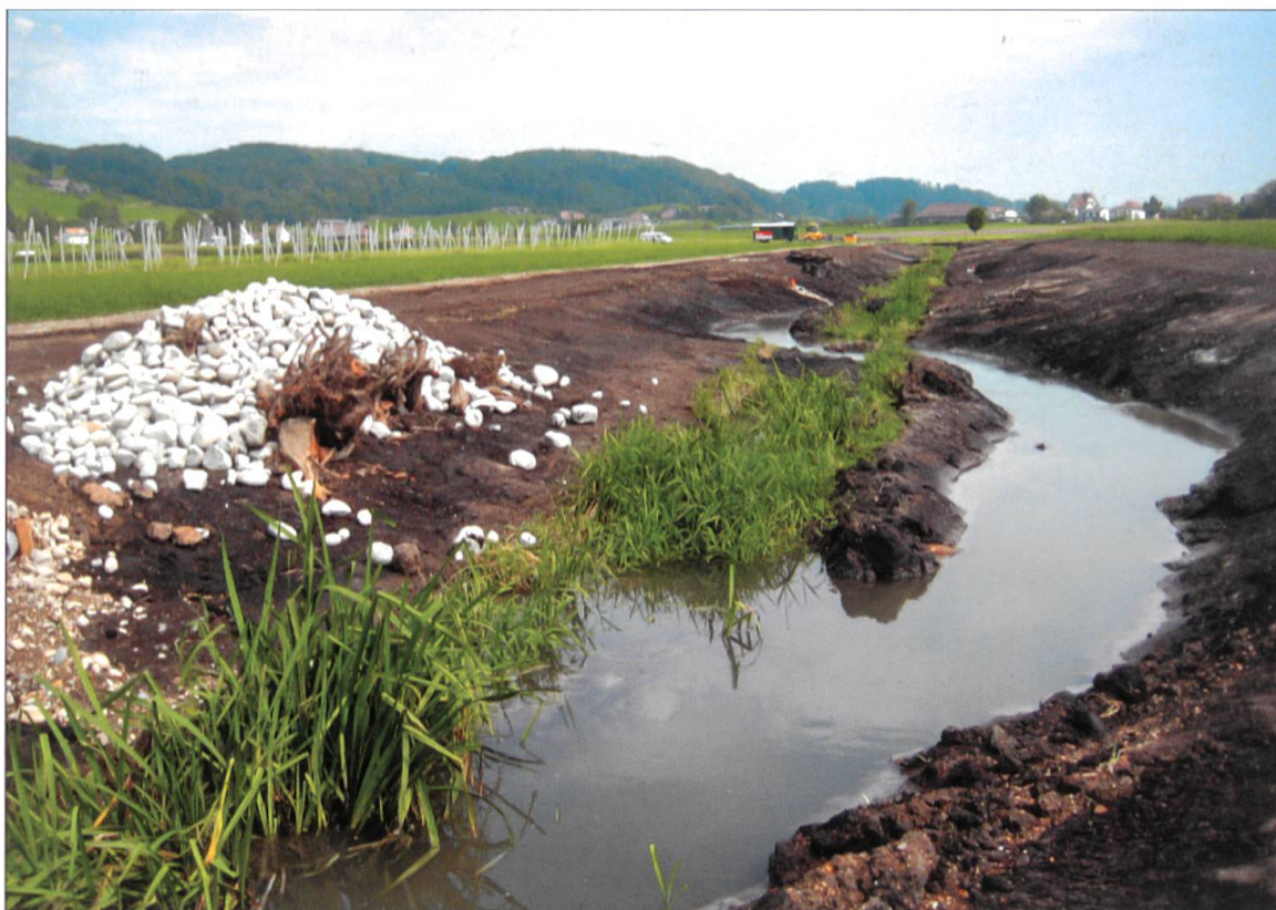
Steinbauken bieten Versteck und Sonnenplätze für Reptilien, Igel und Hermeline.