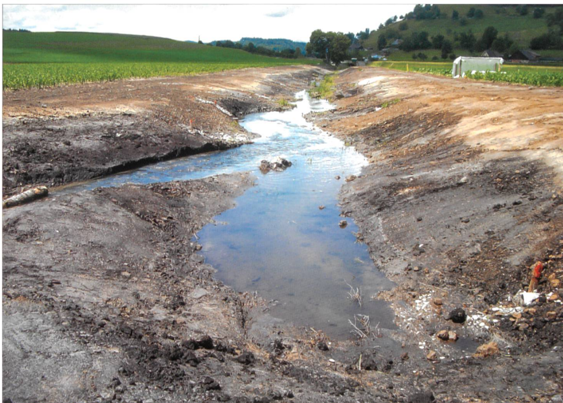
Die Lagune bietet Rückzugsmöglichkeiten für Kleinlebewesen.

Baum sorgfältig und fachgerecht gepflanzt werden konnte.