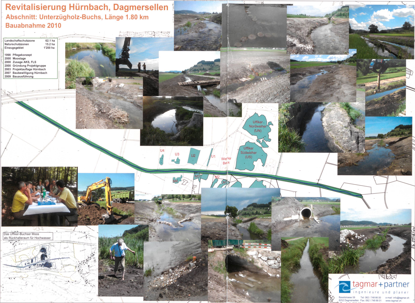
Das Uffiker-Buchser Moos als Rückhalteraum für Hochwasser