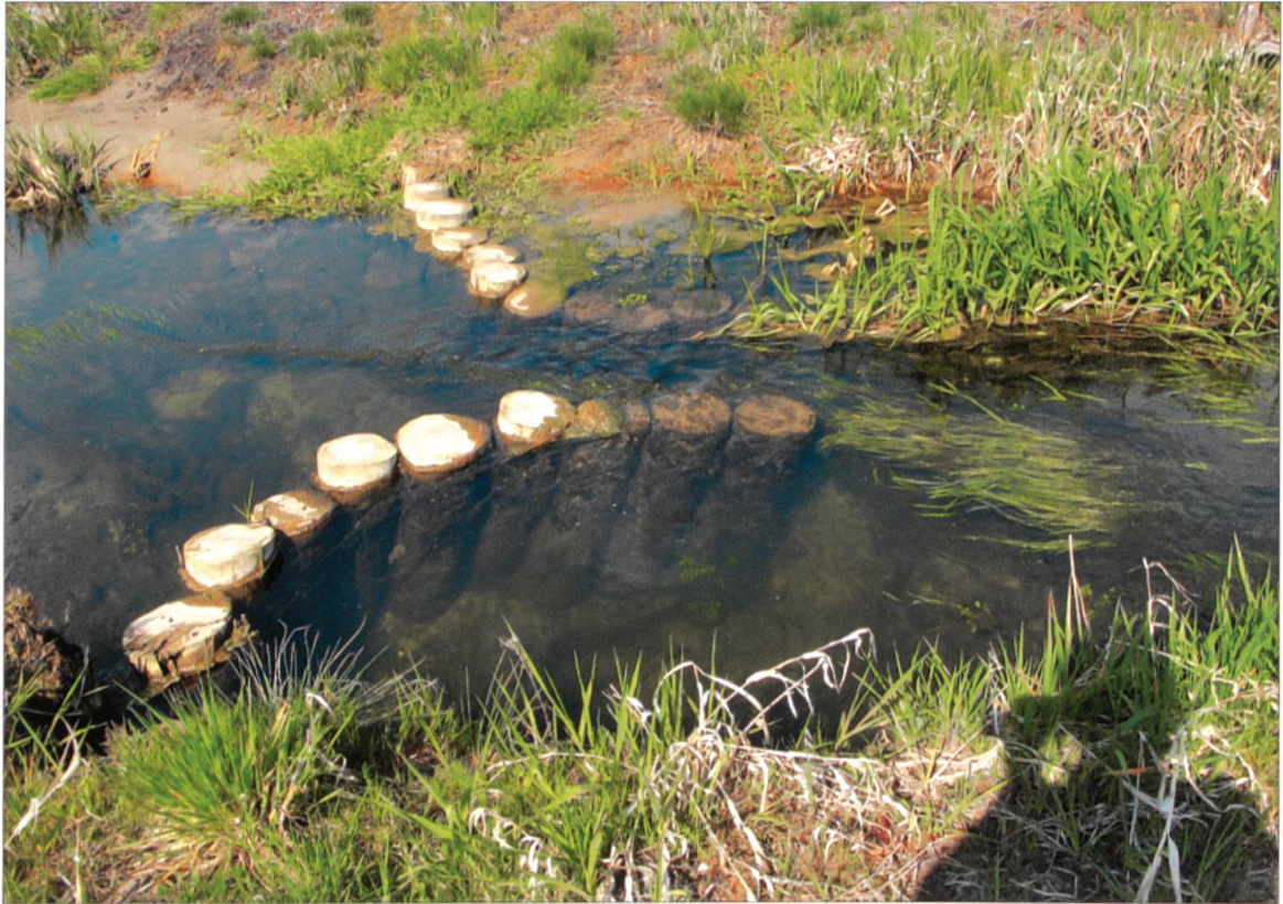
Die Trichterbubne, auch Trompete genannt, erhöht die Strömungsvielfalt.