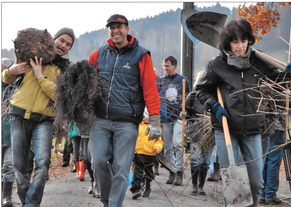
Über siebzig Freunde des Hürnbachs pflanzten über fünfhundert einheimische Sträucher.