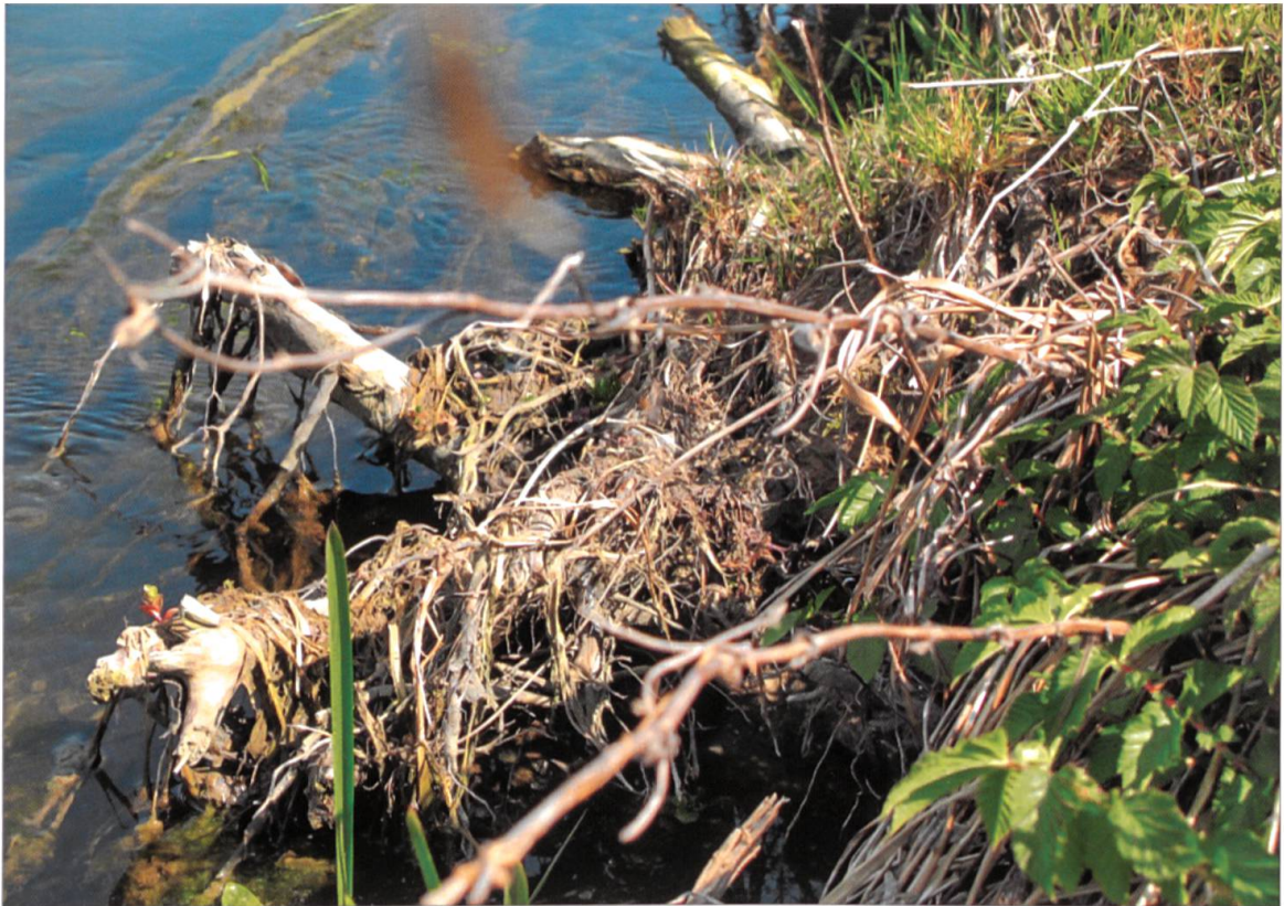
Wurzelstöcke als Unterstand für Fische.