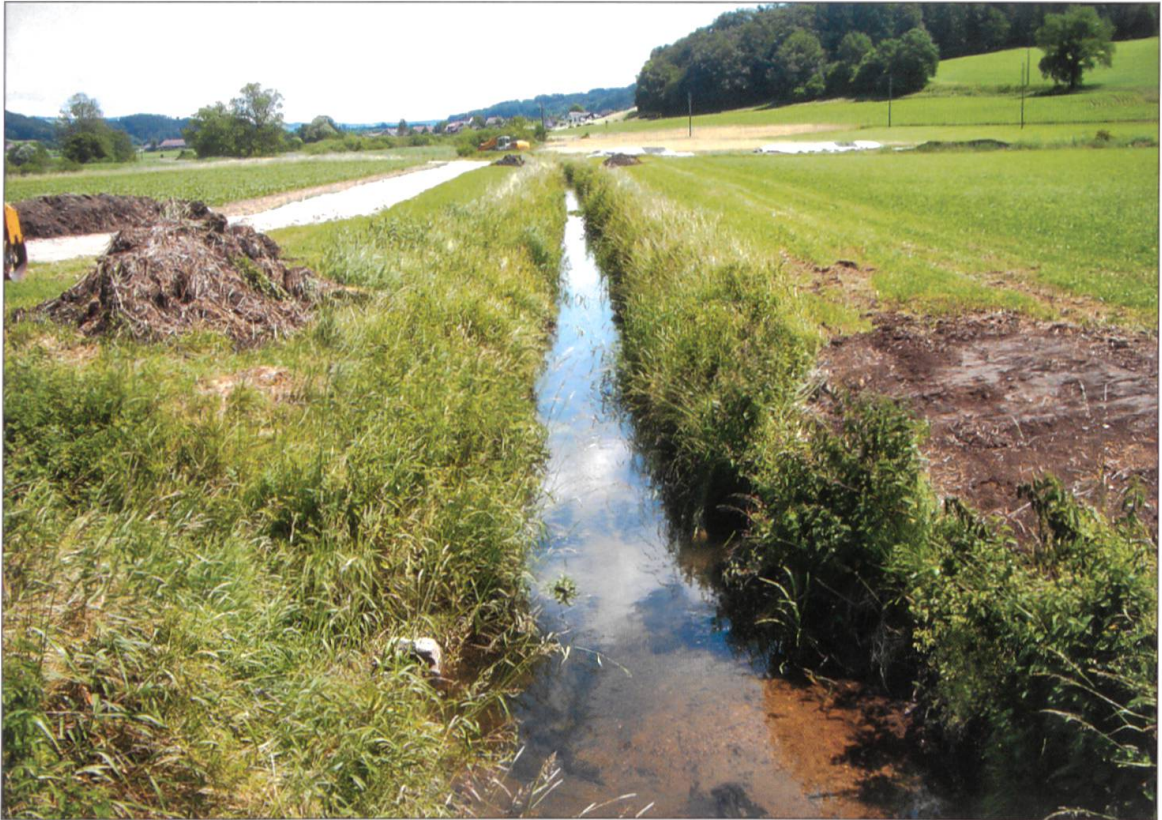
Hürnbach vor der Revitalisierung.