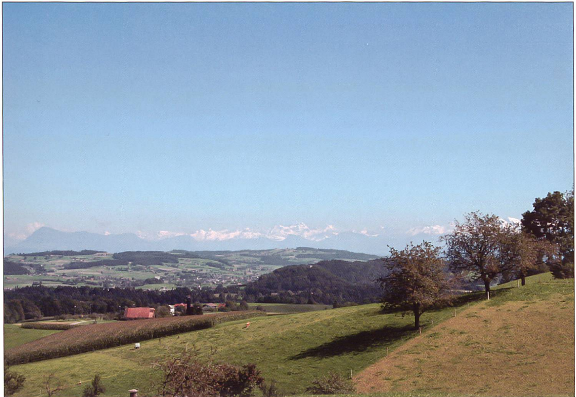
Blick von westlich des Weilers Fadehof (Gemeinde Ohmstal, Koordinaten 637 900 / 224 100 / 690)...