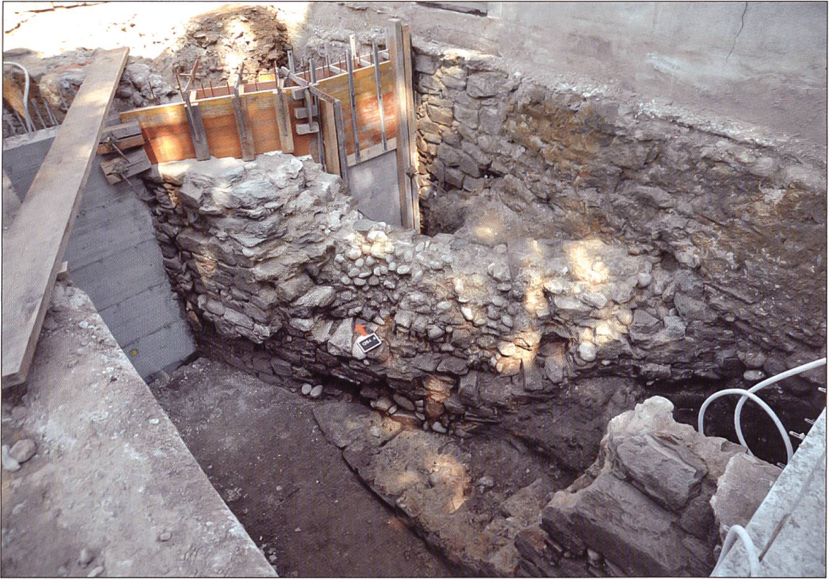
Die Stadtmauer im Bereich des westlichen Vordachs der Schlossscheune. Im Vordergrund die Stützmauer des Vordachs der ersten Bauphase der Schlossscheune. Ansicht von Westen.

Abgesehen vom Keller des Kirchherrenhauses hat sich auf der Stadtseite kein aufgehendes, das heisst ursprünglich sichtbares Mauerwerk erhalten. Im Gegensatz dazu ist auf der Feindseite aufgehende Substanz erhalten geblieben, die jedoch im Rahmen der Untersuchung nur beschränkt zugänglich war. Das Scharfenfenster des Kellers belegt, dass die Südfassade der Stadtmauer zumindest vom Fenster an frei gestanden haben muss. Tatsächlich weisen auch die massiven, bei der Ausgrabung festgestellten Planieschichten südlich der Stadtmauer darauf hin, dass sich der bei der Ausgrabung der Stadtburg festgestellte Wehrgraben bis zur Hangkante auf der Westseite der Stadt erstreckt haben muss (JbHGL 22, 2004, S. 238-246, v.a. S. 242). Die Unterkante des