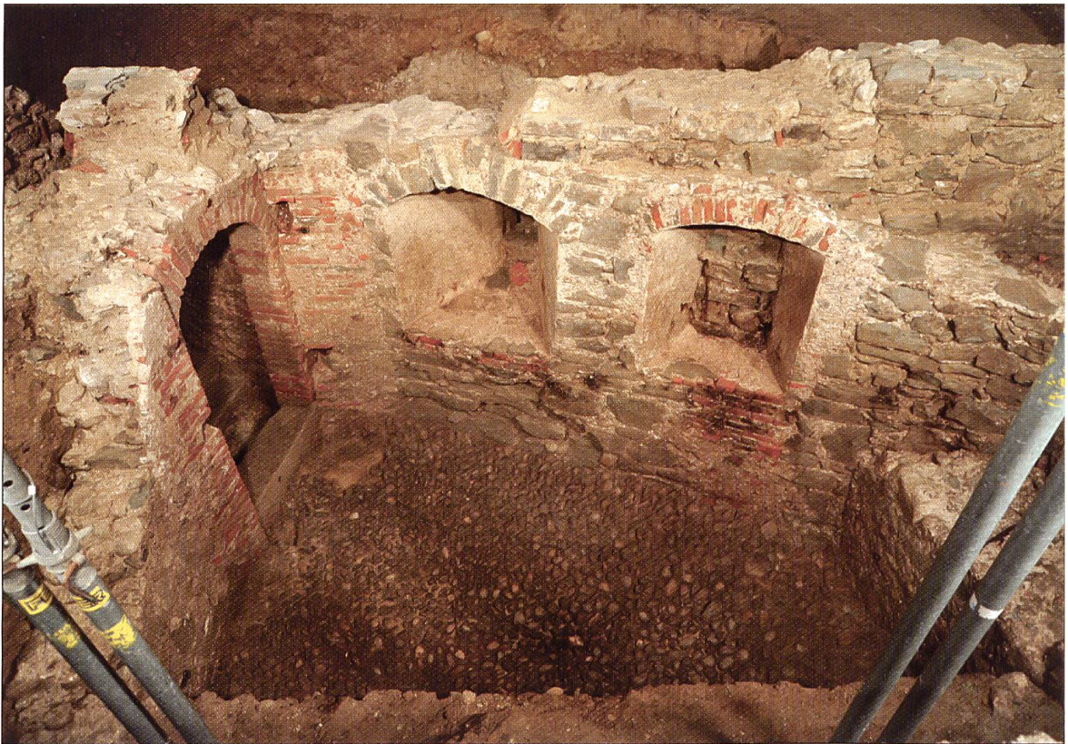
Stadtmauer mit Schartenfenstern, Kellermauern Ost und West und Fundament der Schlossscheune. Ansicht aus nördlicher Richtung.