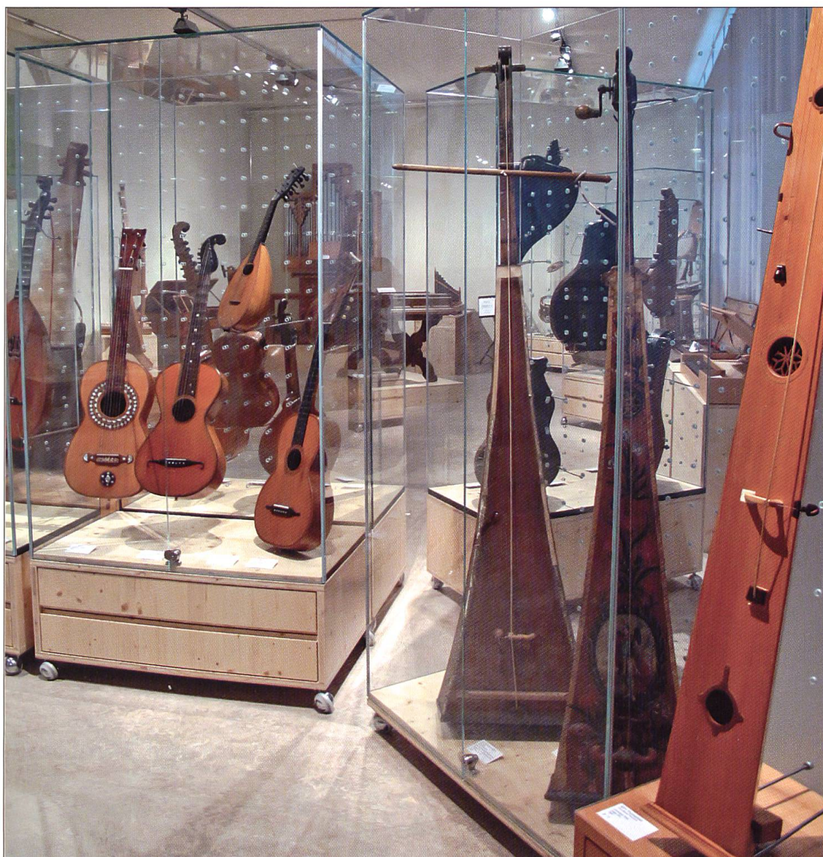
Originale und spielbare Nachbauten nebeneinander: Trumscheite und Trombe marine im Vordergrund, links verschiedene Zupfinstrumente.

Musikinstrumentensammlung Willisau Am Viehmarkt 1 6130 Willisau Telefon 041 971 05 15 E-Mail: info@musikinstrumentensammlung.ch www.musikinstrumentensammlung.ch Über die genauen Öffnungszeiten informieren Sie sich bitte im Internet, oder in der Zeitung.