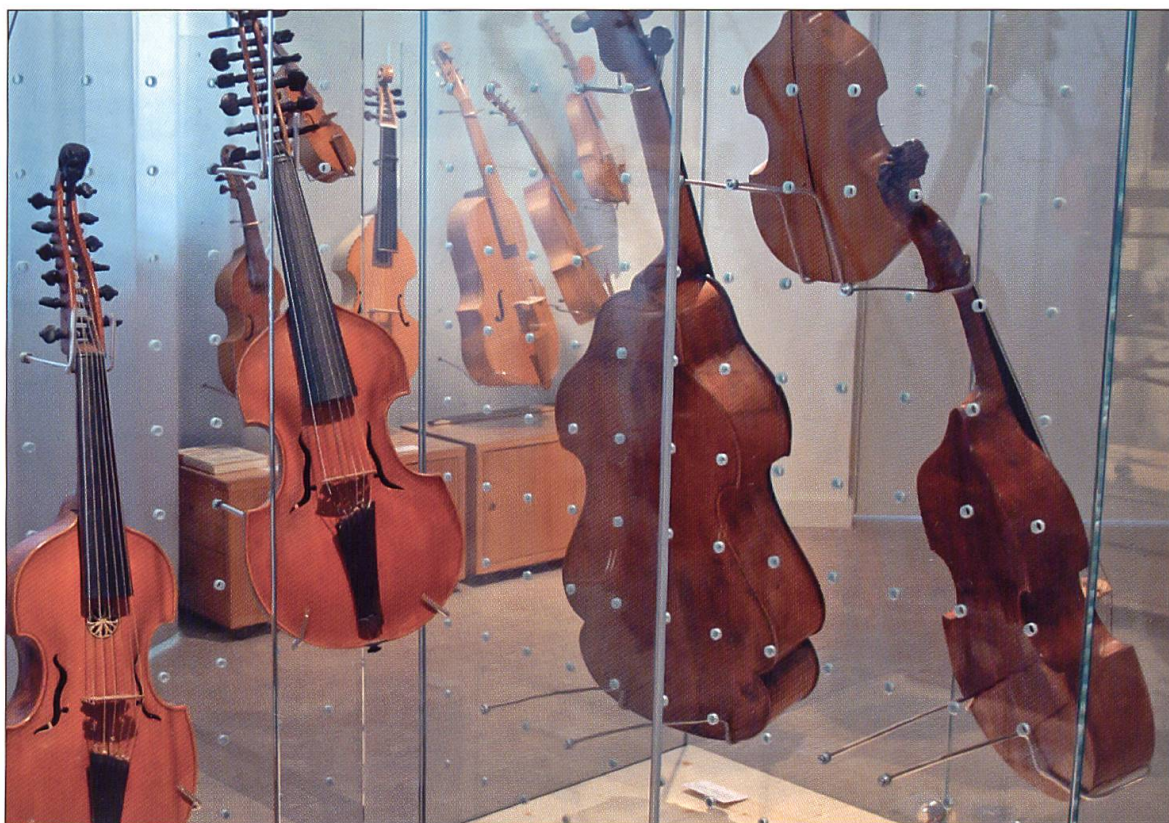
Die Vitrinen erlauben interessante Durchblicke: links Viola d'amore, rechts Viola da gamba und dazwischen im Hintergrund Fideln von Christian Patt.

spielen und Originalen hinter Glas zum Bestaunen.