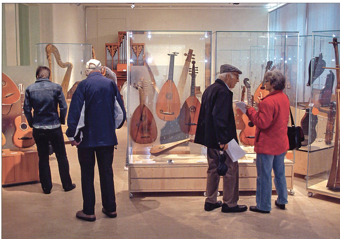
Die Musikinstrumentensammlung als Treffpunkt und Begegnungsort: fotografischer Eindruck vom Internationalen Museumstag am 16. Mai 2010.

fertigt um 1900) aus dem Zisterzienserkloster Frauenthal, Kanton Zug. Pfleger wurde 1602 in Radolfszell (Deutschland) am Bodensee geboren. 1638 und 1639 wirkte er als Orgelbauer in der Klosterkirche Muri AG. Die Wirren des Dreissigjährigen Krieges verdunkelten das Wirken dieses begabten Orgelbauers. Wahrscheinlich war die Verlegung seiner Werkstatt nach Tann im Elsass ebenfalls eine Folge davon. Zwischen 1660 und seinem Tod 1670 betrieb er seine Werkstatt wieder in Radolfszell.