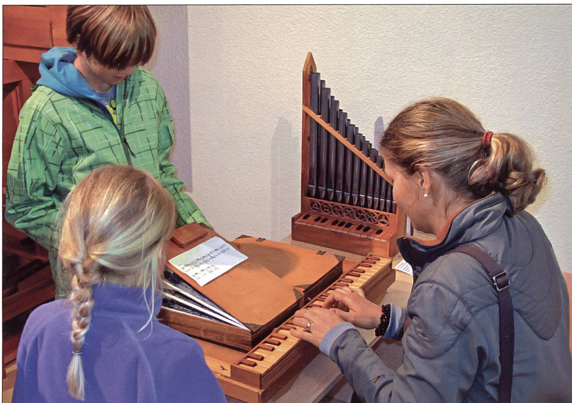
Teamwork beim Spiel auf dem Bibelregal: Die Möglichkeit, die verschiedensten Instrumente selber zu erproben, ist für Familien besonders attraktiv.

anbläst oder den Serpent ausprobiert, ist es wichtig, dass Klangwerkzeuge auch professionell zum Einsatz kommen: Konzerte gehören elementar zu einer Musikinstrumentensammlung.