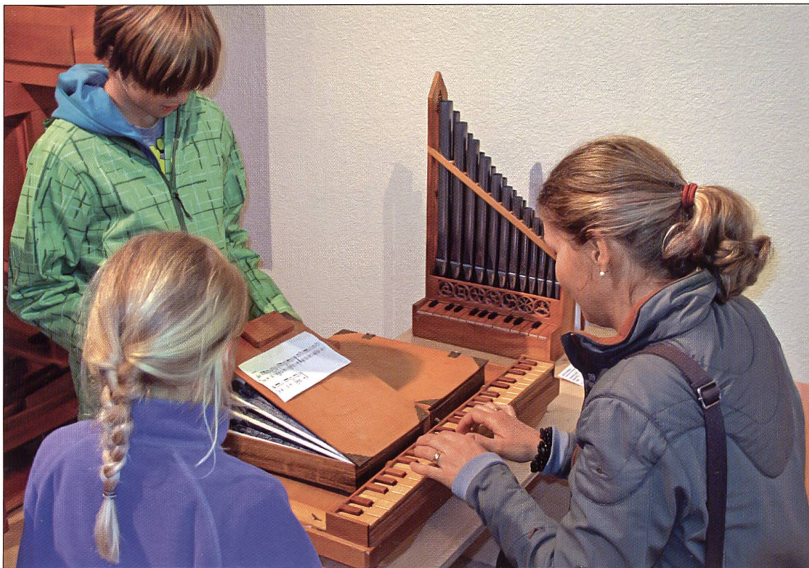
Teamwork beim Spiel auf dem Bibelregal: Die Möglichkeit, die verschiedensten Instrumente selber zu erproben, ist für Familien besonders attraktiv.

anbläst oder den Serpent ausprobiert, ist es wichtig, dass Klangwerkzeuge auch professionell zum Einsatz kommen: Konzerte gehören elementar zu einer Musikinstrumentensammlung.