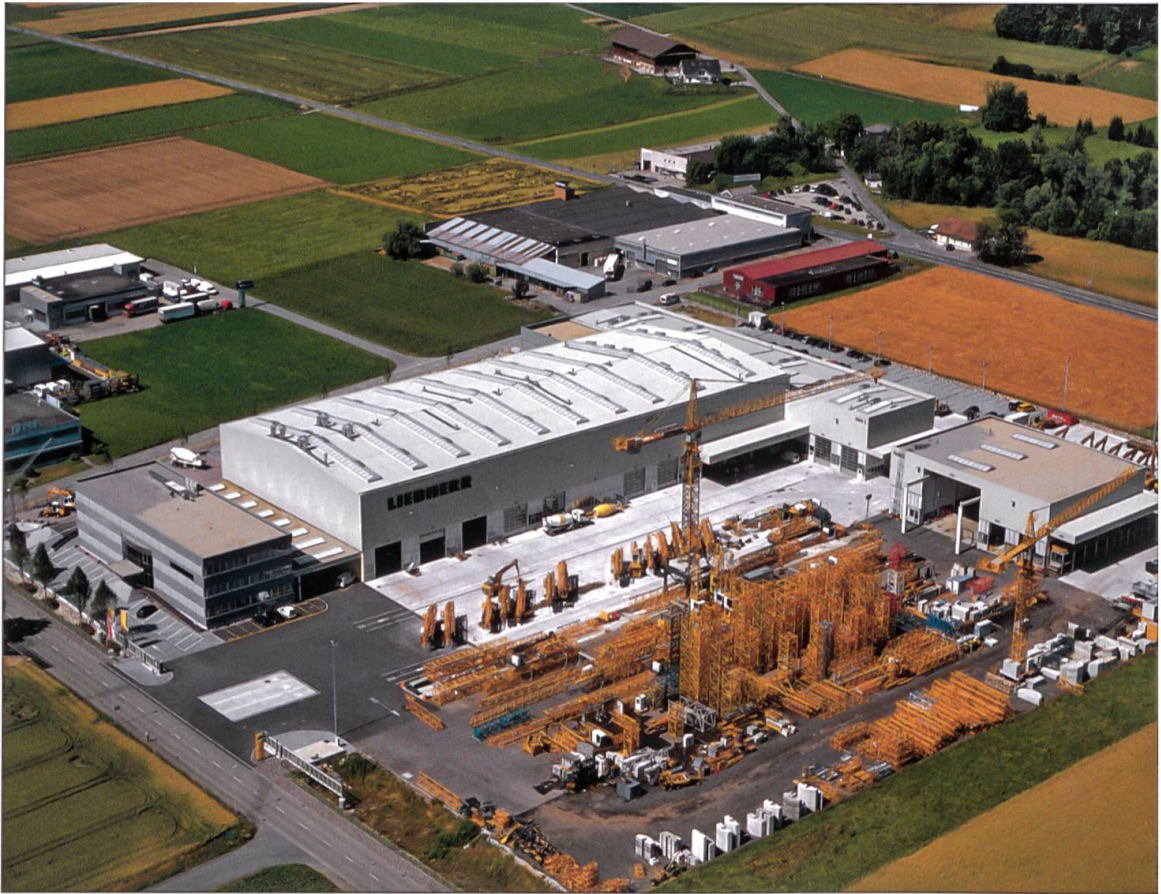
Liebherr-Baumaschinen AG, 6260 Reiden.