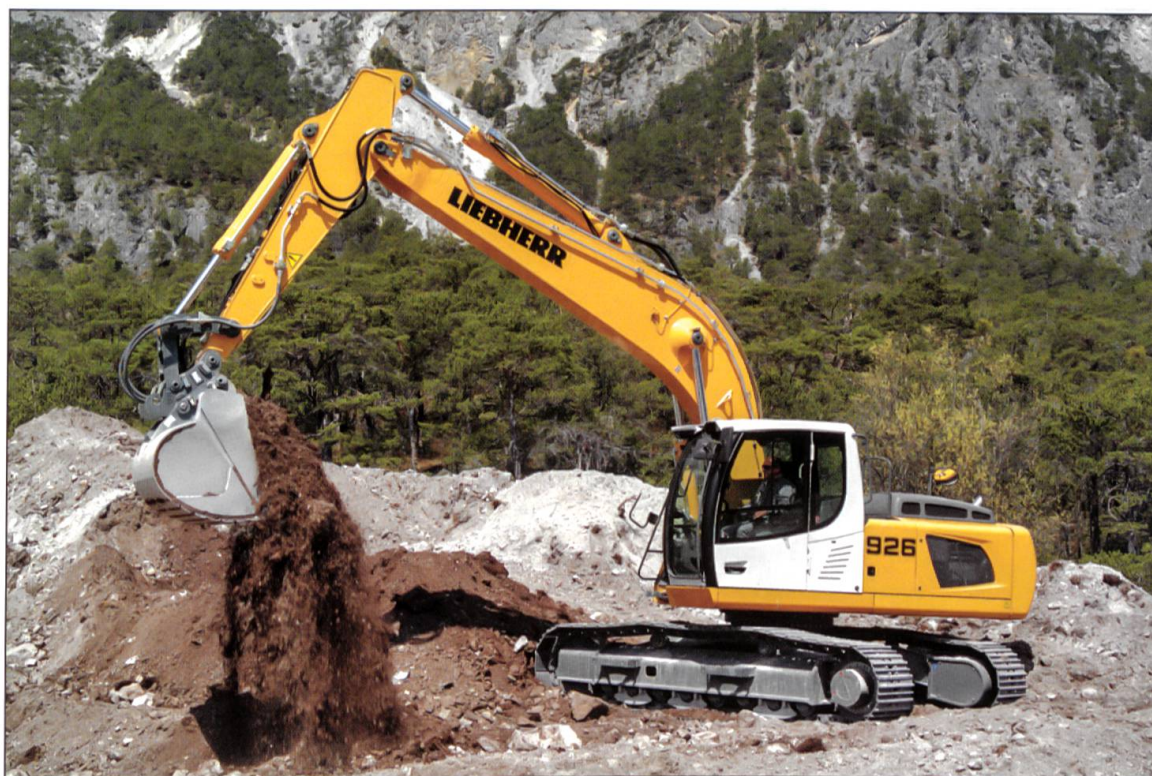
Liebherr-Raupenbagger R 926 Advanced.

Liebherr-Mitarbeiter soll die Basis für eine erfolgreiche Zusammenarbeit in die Zukunft sein.