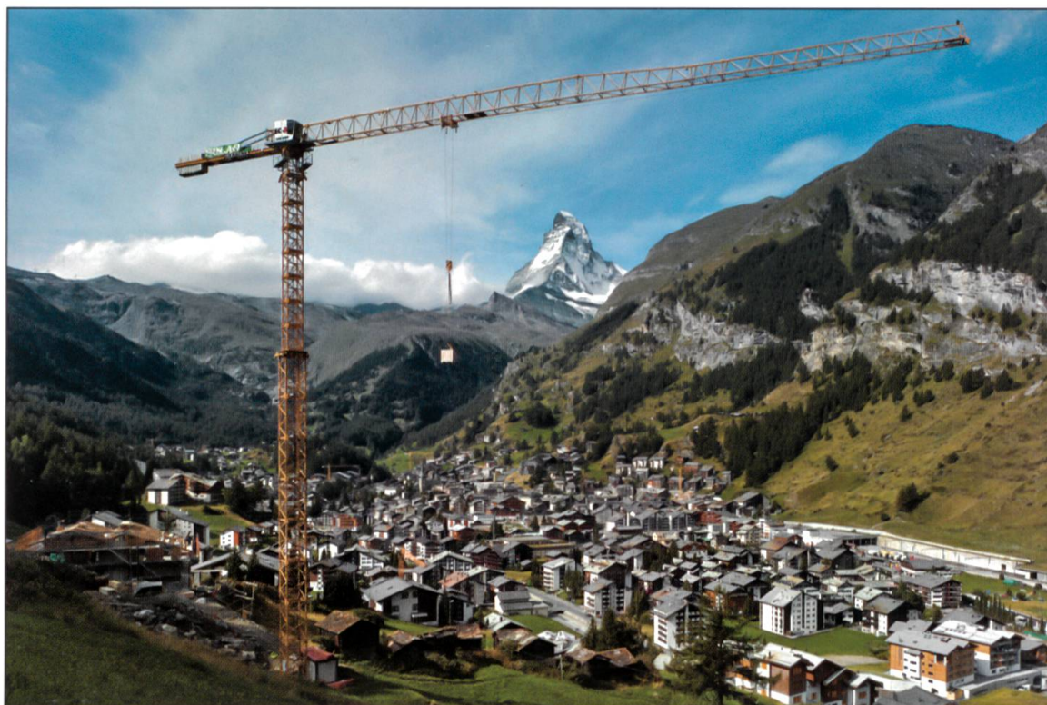
Liebherr-Turmdrehkran 130 EC-B6 vor «prominenter» Kulisse.

sen Stützpunkten, erfahrenen Partnerfirmen, hochmoderner Ersatzteil-Logistik wird ein engmaschiges, zuverlässiges Kundendienstnetz direkt vom Hersteller garantiert. Die professionelle und effiziente Infrastruktur, die Erfahrung von Liebherr als Produzent sowie das Engagement der Liebherr-Mitarbeiter sollen die Basis für den erfolgreichen Einsatz der Baumaschinen in den Bauunternehmungen sein.