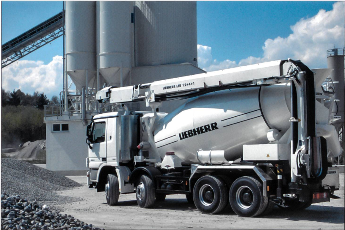
Betonproduktion und Transport mit Liebherr-Betonturm, Liebherr-Fahrmischer und Liebherr-Förderband.

weils ein Absaugvolumen von 2000 Kubikmeter pro Stunde leisten.