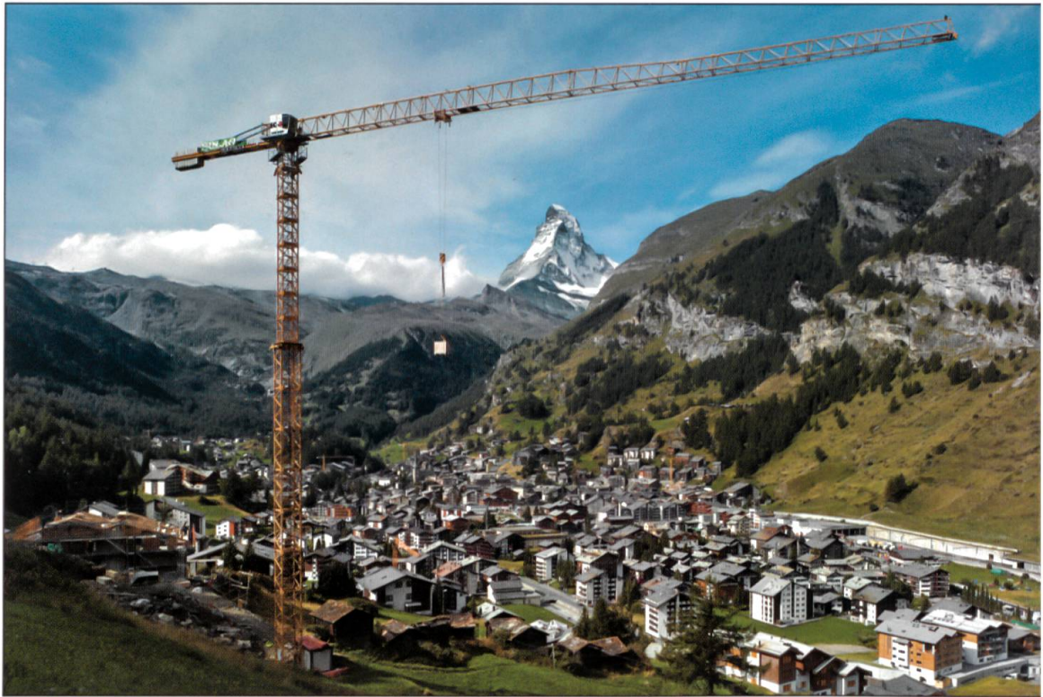
Liebherr-Turmdrehkran 130 EC-B6 vor «prominenter» Kulisse.

sen Stützpunkten, erfahrenen Partnerfirmen, hochmoderner Ersatzteil-Logistik wird ein engmaschiges, zuverlässiges Kundendienstnetz direkt vom Hersteller garantiert. Die professionelle und effiziente Infrastruktur, die Erfahrung von Liebherr als Produzent sowie das Engagement der Liebherr-Mitarbeiter sollen die Basis für den erfolgreichen Einsatz der Baumaschinen in den Bauunternehmungen sein.