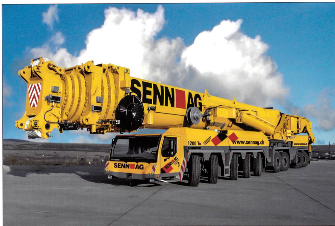
Liebherr-Mobilkran LTM 11200-9, ein schwergewichtiger Wiggertaler. Maximale Traglast 1200 t bei Ausladung 2,5 m; Maximale Hubhöhe 188 m; Maximale Ausladung 136 m.

zwei starken Hofkranen ein sehr effizientes Auf- und Abladen. Für die Zwischenlagerung der diversen Baumaschinen wie Raupenbagger, Fahrmischer und Mobilkrane, Hochbaukrane stehen insgesamt 20 000 Quadratmeter Hartbelagsfläche zur Verfügung. In den Werkshallen sorgen 20 Hallenkrane für die gewünschte Umschlagsleistung.