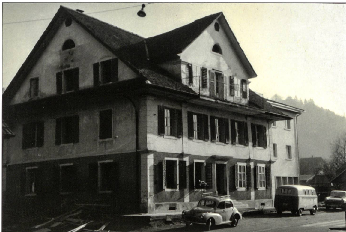
Die 1836 erbaute Pinte in Adelboden kurz vor dem Abbruch 1963.