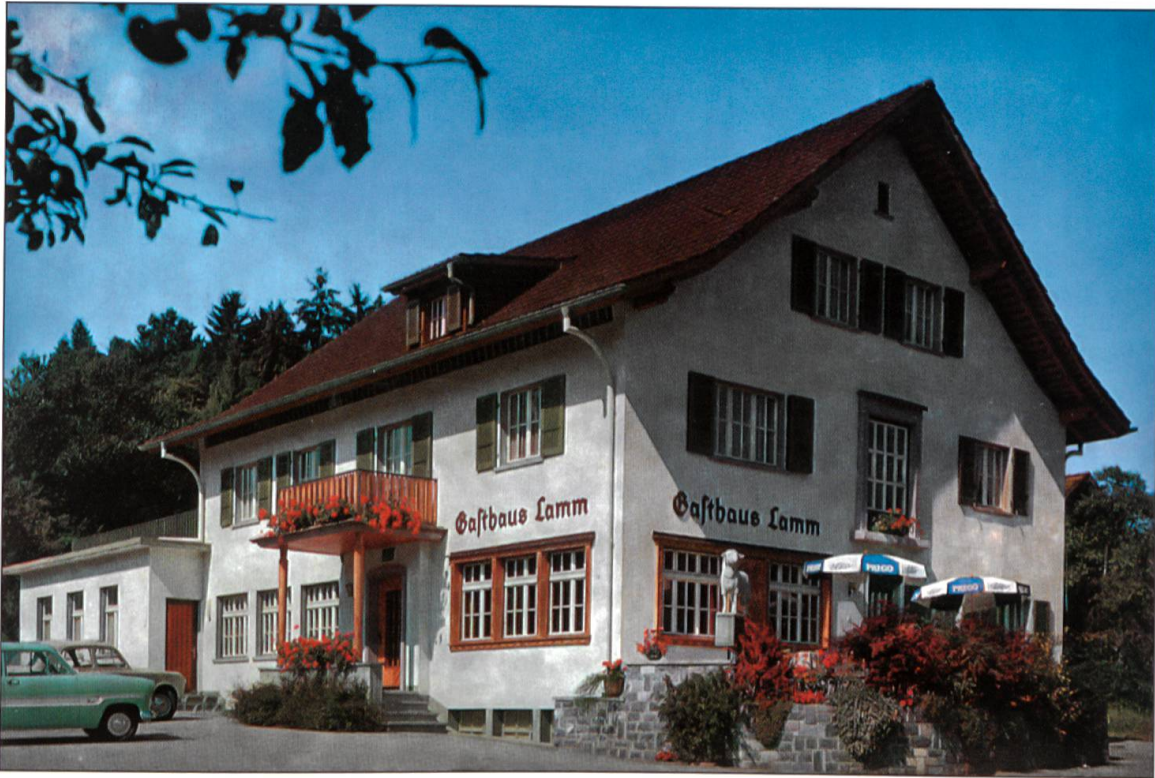
Das 1833 gegründete Gasthaus Lamm in Richenthal wurde 1957 an derselben Stelle neu aufgebaut.