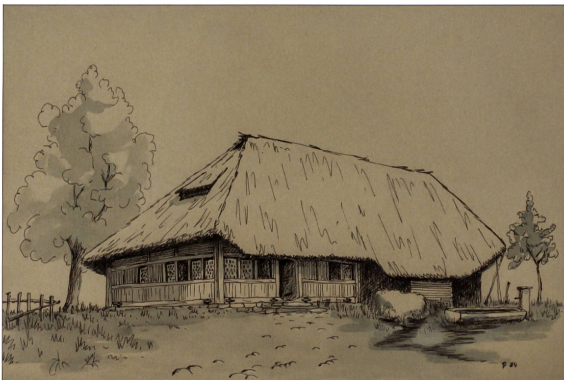
Die erste Pinte in Adelboden, nachempfunden in einer Zeichnung aus dem Jahre 1984.

getragen und deswegen gekündigt. Sie seien deshalb darauf angewiesen, ihr Wirtsrecht «außert unsere Gemeinde zu verkaufen» 10 .