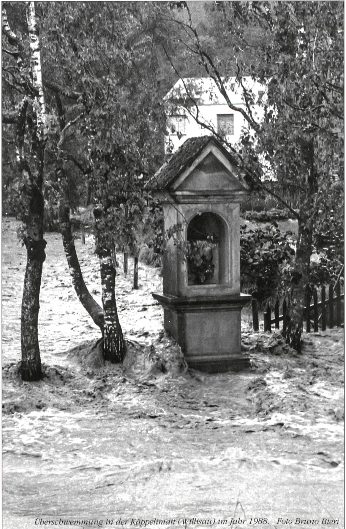
Überschwemmung in der Käppelimatt (Willisau) im Jahr 1988.