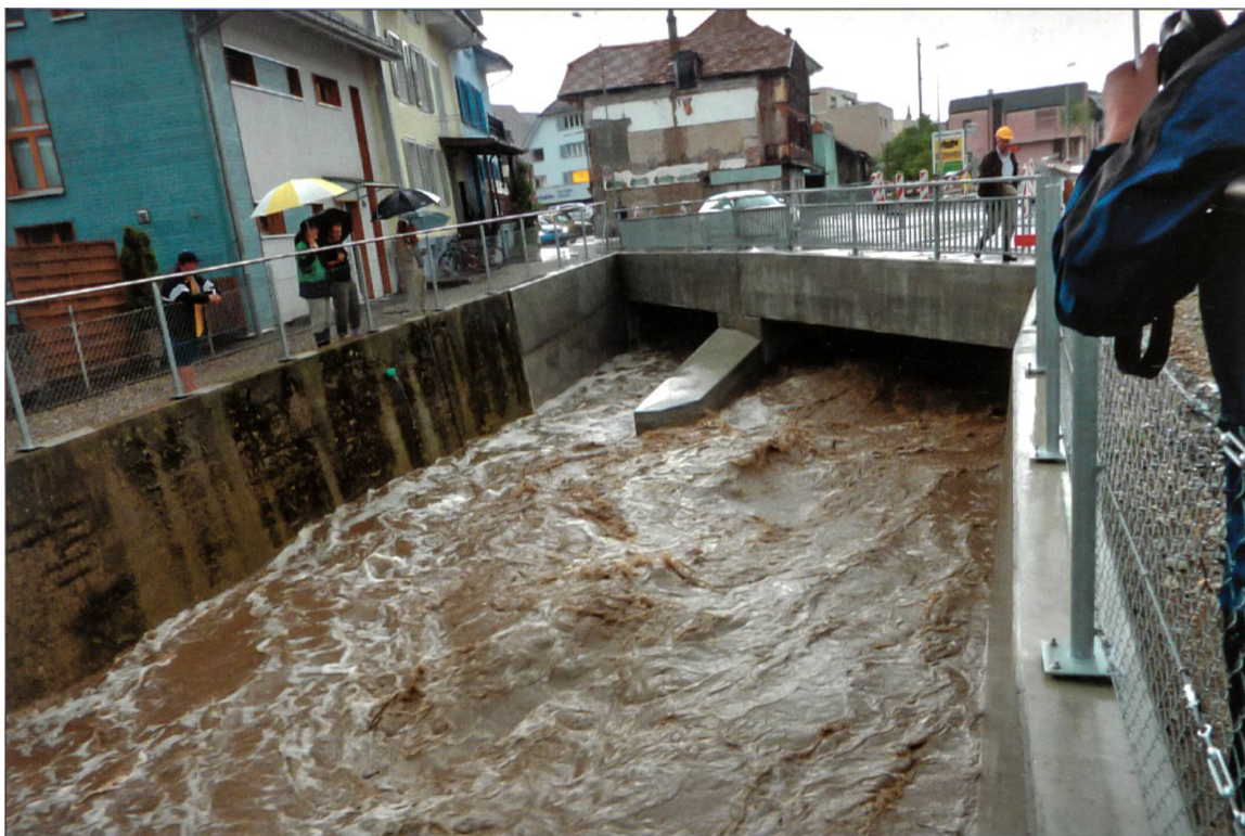
Hochwasser am 26. Mai 2009. Zusammenfluss des Wassers aus dem Altlauf (links) und dem Entlastungskanal (rechts) bei der Löwenbrücke.