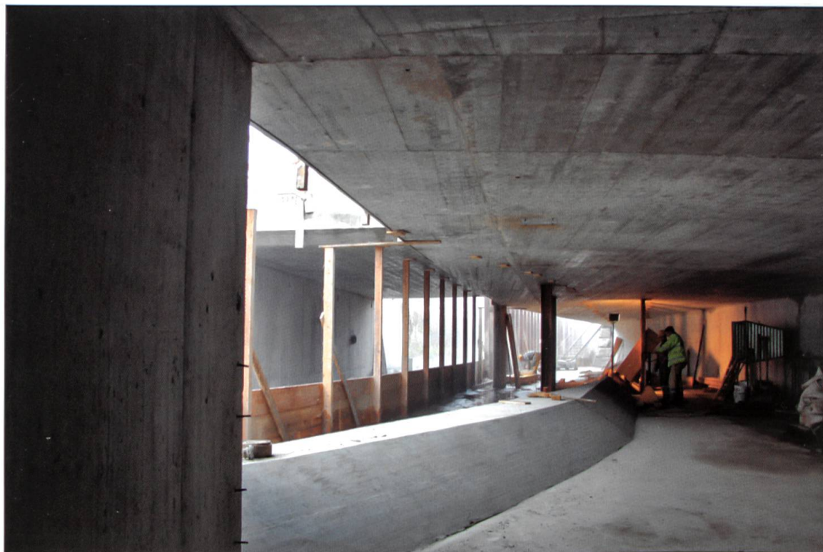
Bau des Einlaufbauwerks, im Vordergrund das Streichwehr. Blick aus dem Entlastungskanal in den Oberlauf der Enziwigger.