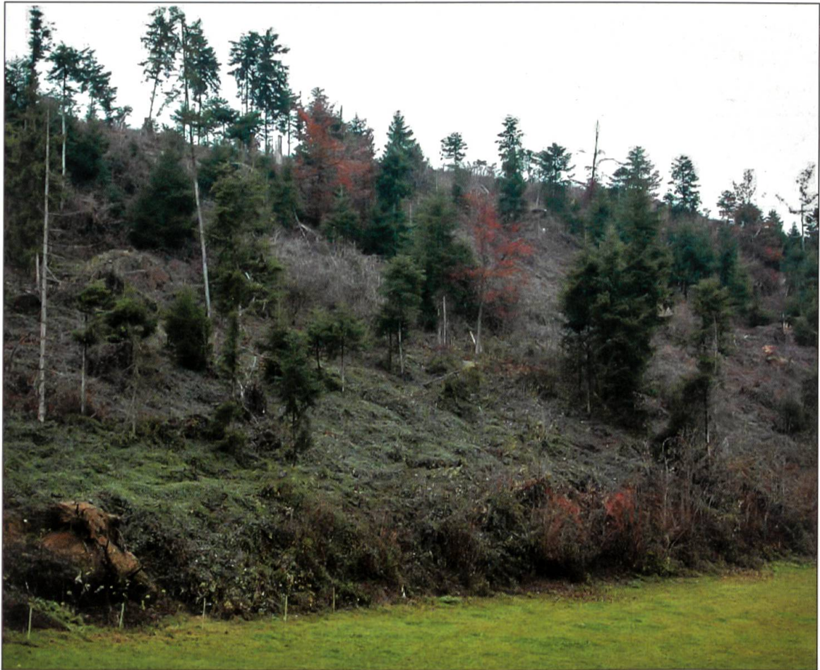
Situation Lotharfläche im Oktober 2003.