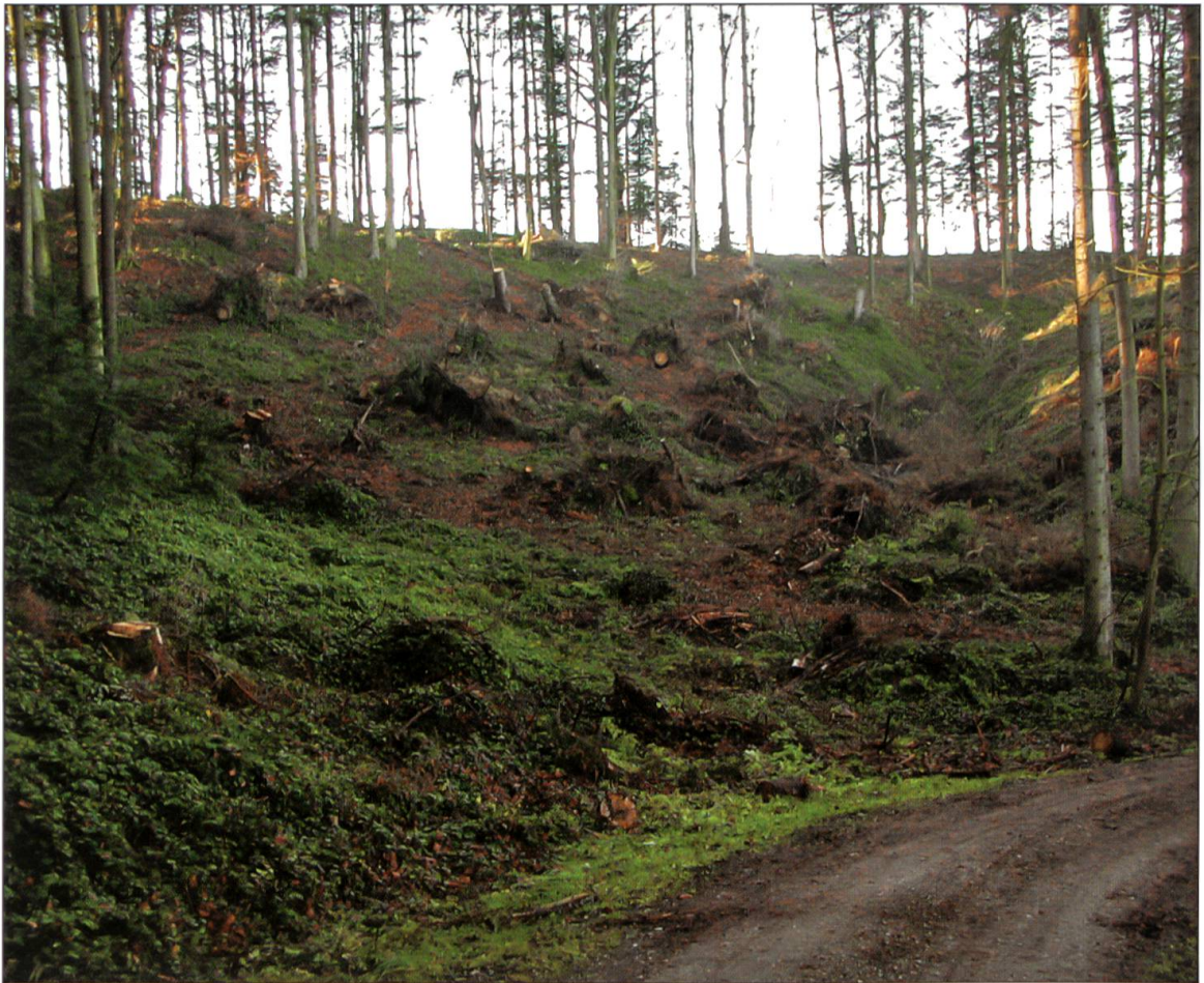
Situation Lotharfläche Ende 2000.