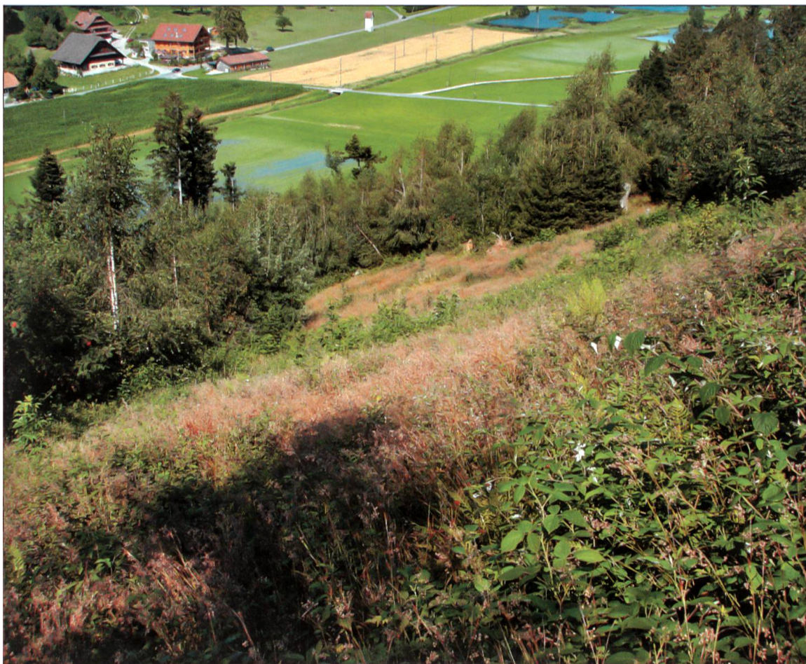
Situation Lotharfläche im Juli 2009.