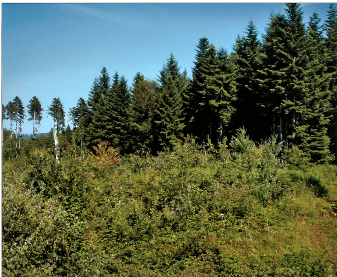
Situation Lotharfläche im Juli 2009.