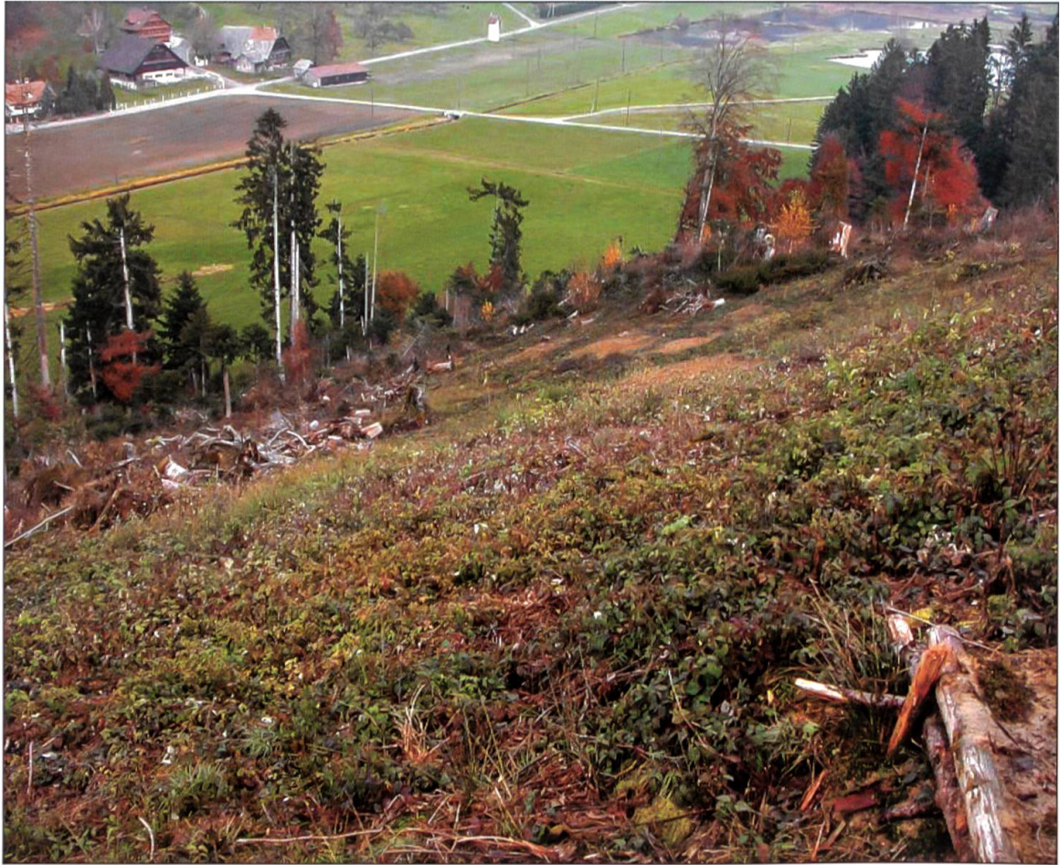
Situation Lotharfläche im Oktober 2003.