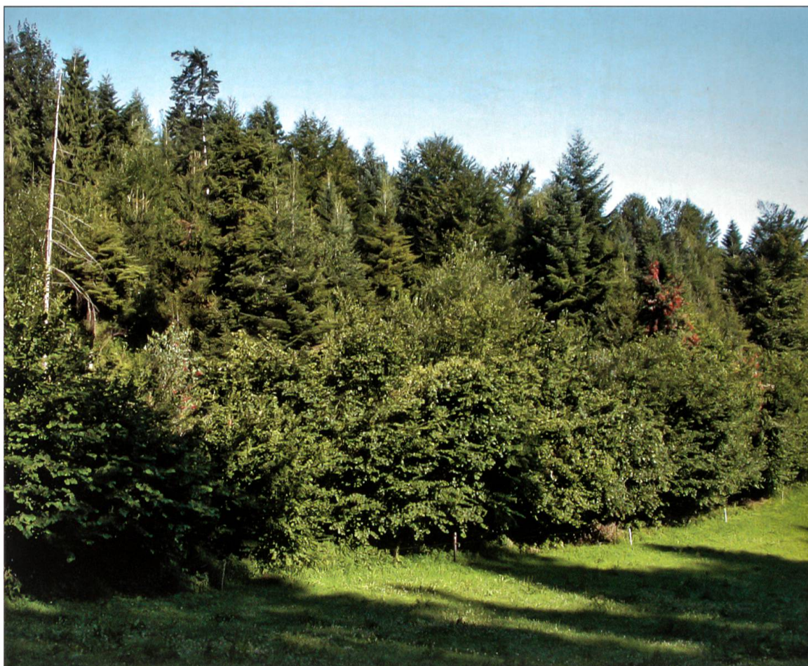
Situation Lotharfläche im Juli 2009.