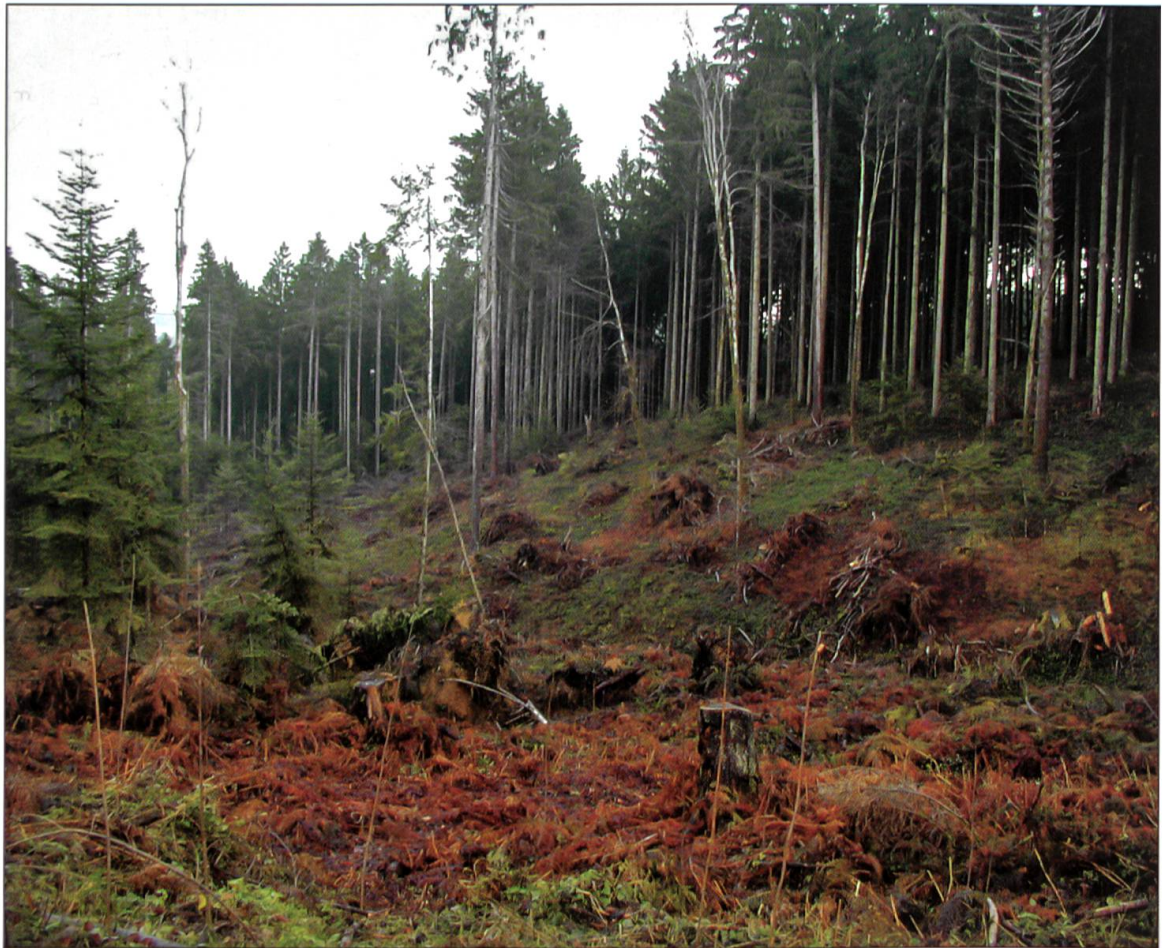
Situation Lotharfläche Ende 2000.