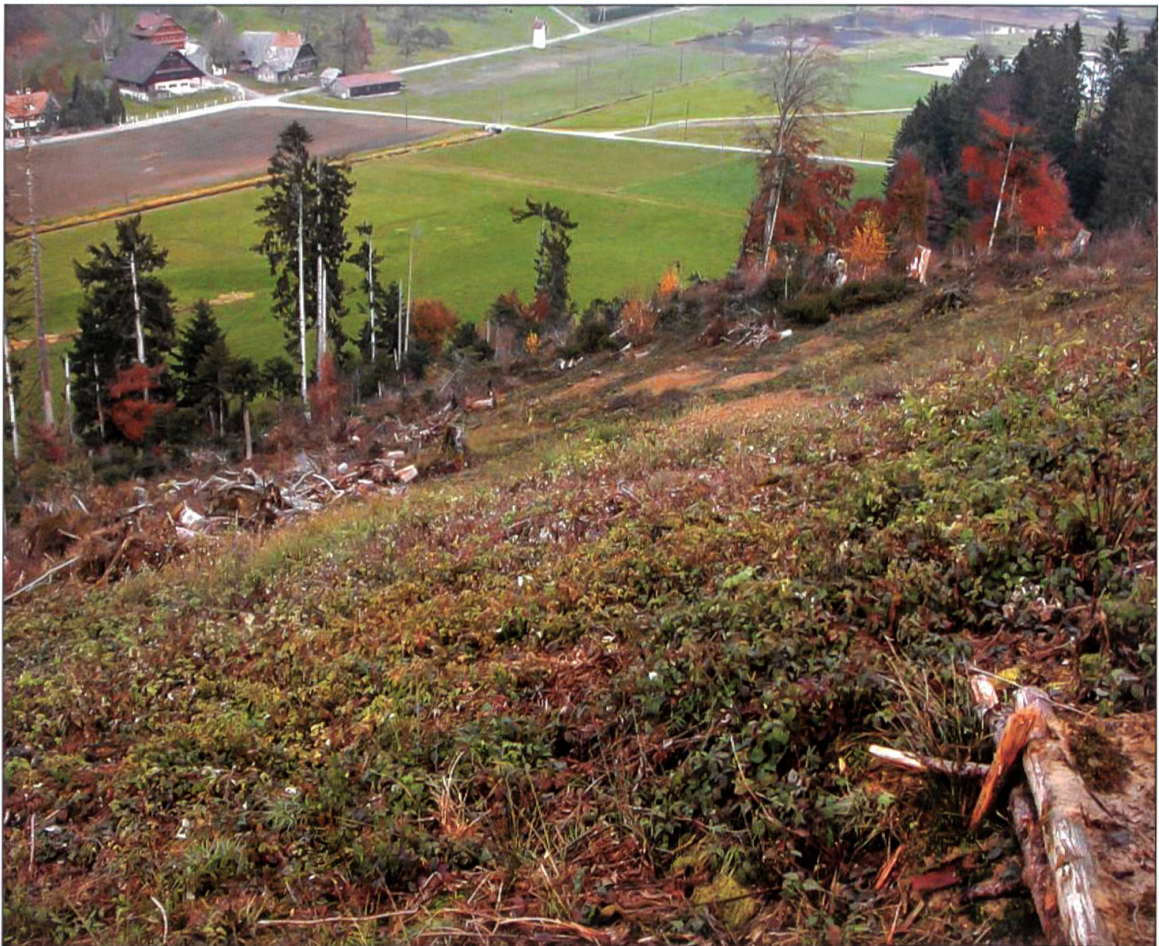
Situation Lotharfläche im Oktober 2003.