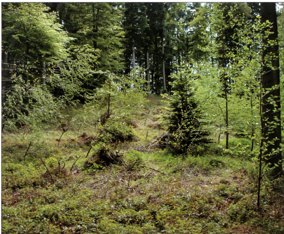
Situation Lotharfläche im Mai 2009.