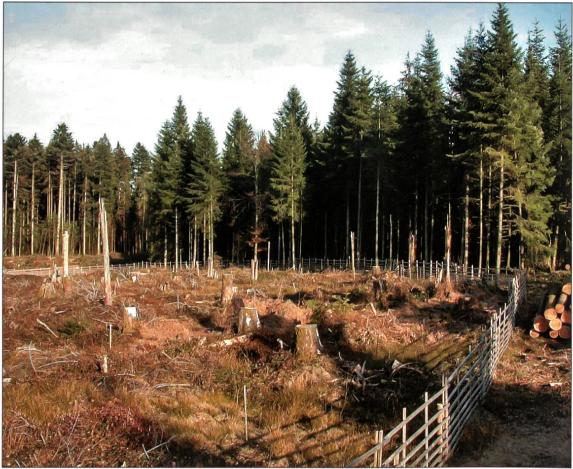
Situation Lotharfläche im Oktober 2003.