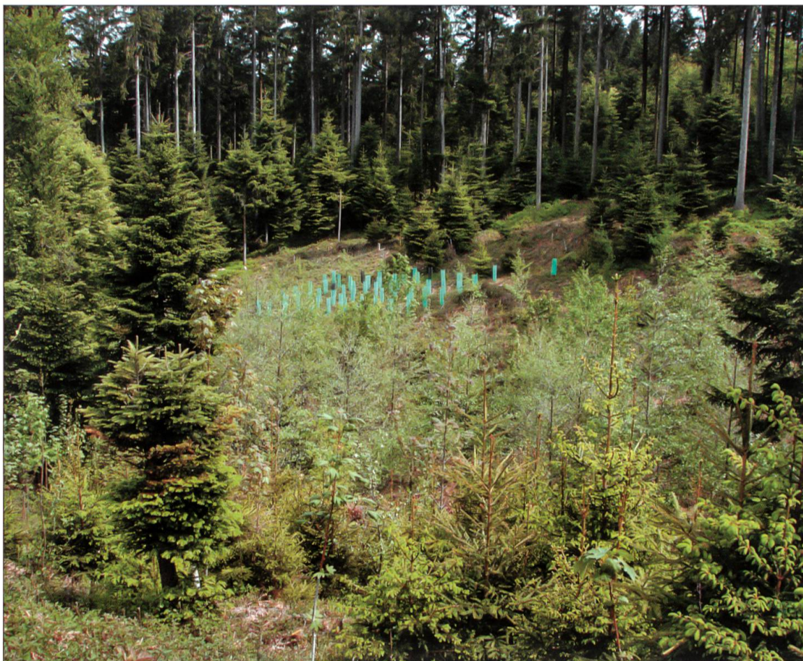
Situation Lotharfläche im Mai 2009.