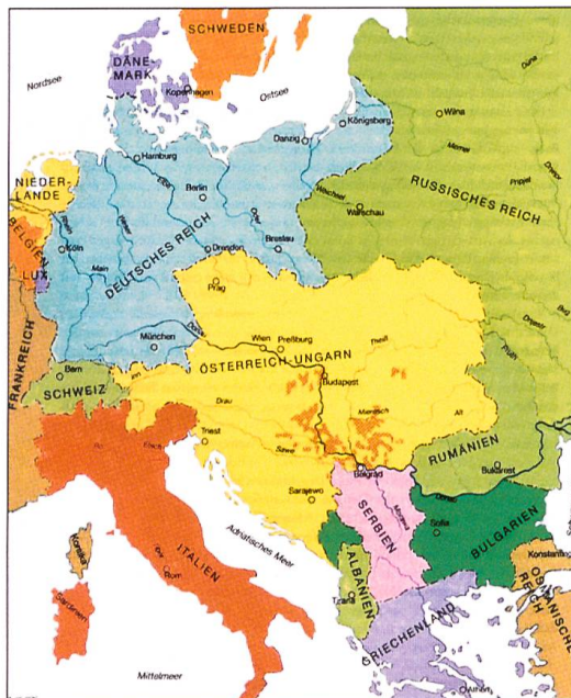
Mitteleuropa vor dem Ersten Weltkrieg.

herrschte die Alltagsszene. Vorerst rissen Arbeiter- und Soldatenräte die Macht an sich. Besonders aktiv waren die radikalen Linksozialisten des Spartakusbundes. Diese arbeiteten auf einen Umsturz nach bolschewistischem Muster hin. Am 30. Dezember gründeten die Spartakisten die Kommunistische Partei Deutschlands (KPD), die sich im Januar 1919 in Strassenkämpfen hervor tat. Der kommunistische Aufstand wurde niedergeschlagen. vielerorts im Lande kam es zu Streiks und kommunistischen Umsturzversuchen.