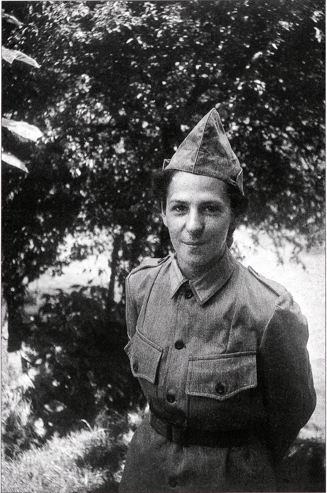
Erstmals waren auch Frauen im Militärdienst (Frauenhilfsdienst FHD) tätig. Zofingen, 1942