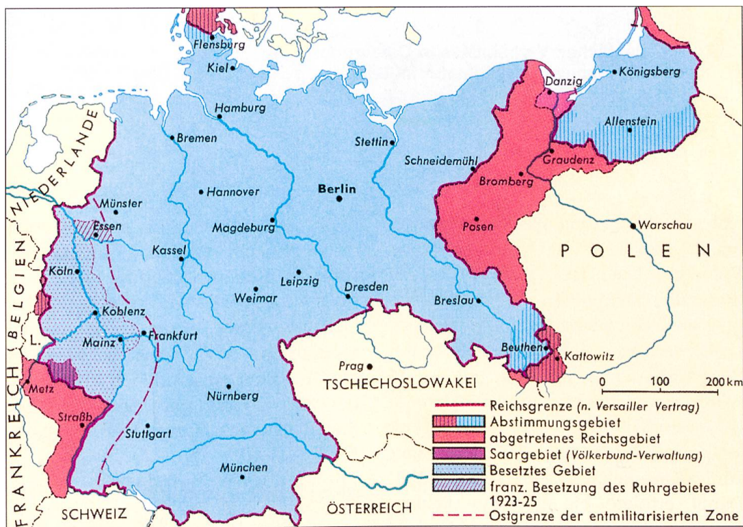
Das Deutsche Reich nach dem Ersten Weltkrieg. Gebietsabtretungen.

setzen, um den finanziellen Bedürfnissen nachkommen zu können. Damit kam praktisch wertloses Papiergeld unter Volk, zumal das viel zu schmale Güterangebot immer teurer wurde. Der Grossteil des Mittelstandes verlor sein Erspartes und das Vertrauen in die Republik und ihre Institutionen. Im gleichen Jahr besetzten französische und belgische Truppen das Ruhrgebiet , da Deutschland zufolge der wirtschaftlichen Krise bezüglich Reparationszahlungen in Rückstand geraten war. Der deshalb von der Reichsregierung ausgerufenen passive Widerstand war ein Schuss ins Leere und schadete Deutschland am meisten. Auch sonstwie blieb es unruhig in der jungen Republik. Unter Duldung der bayrischen Regierung hatte sich in München unter dem ehemaligen Feldherrn General Ludendorff