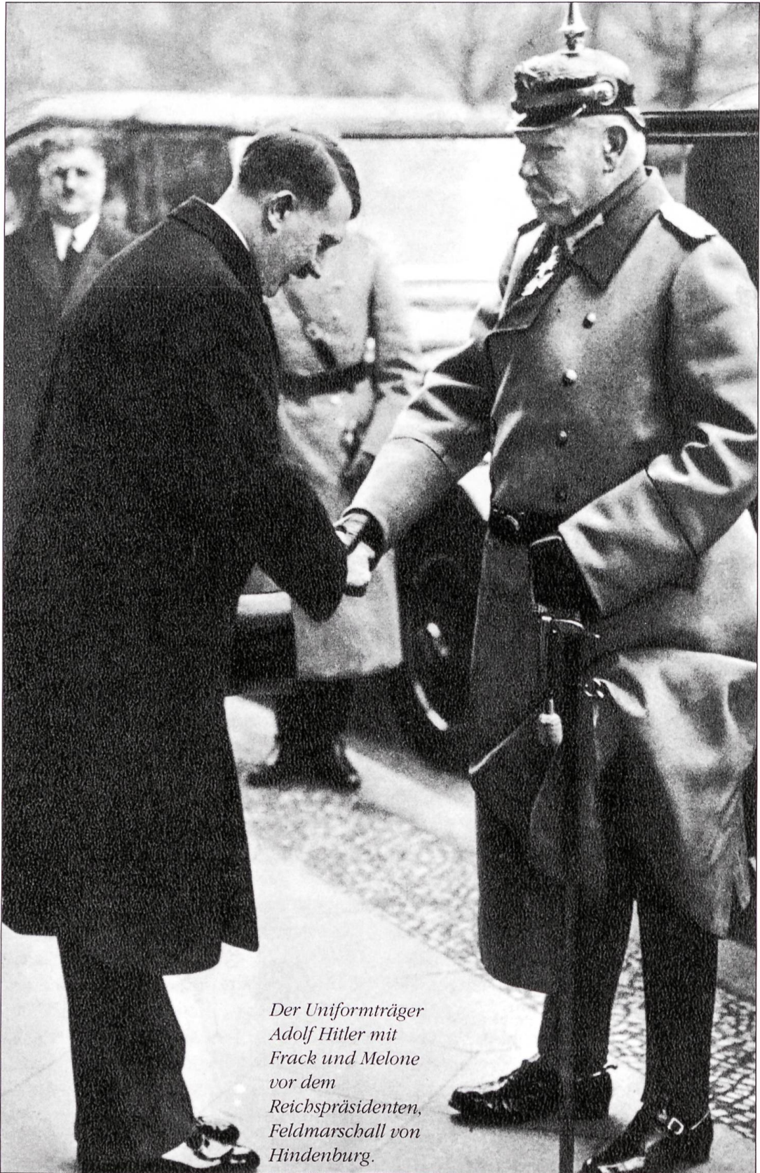
Der Uniformträger Adolf Hitler mit Frack und Melone vor dem Reichspräsidenten, Feldmarschall von Hindenburg.