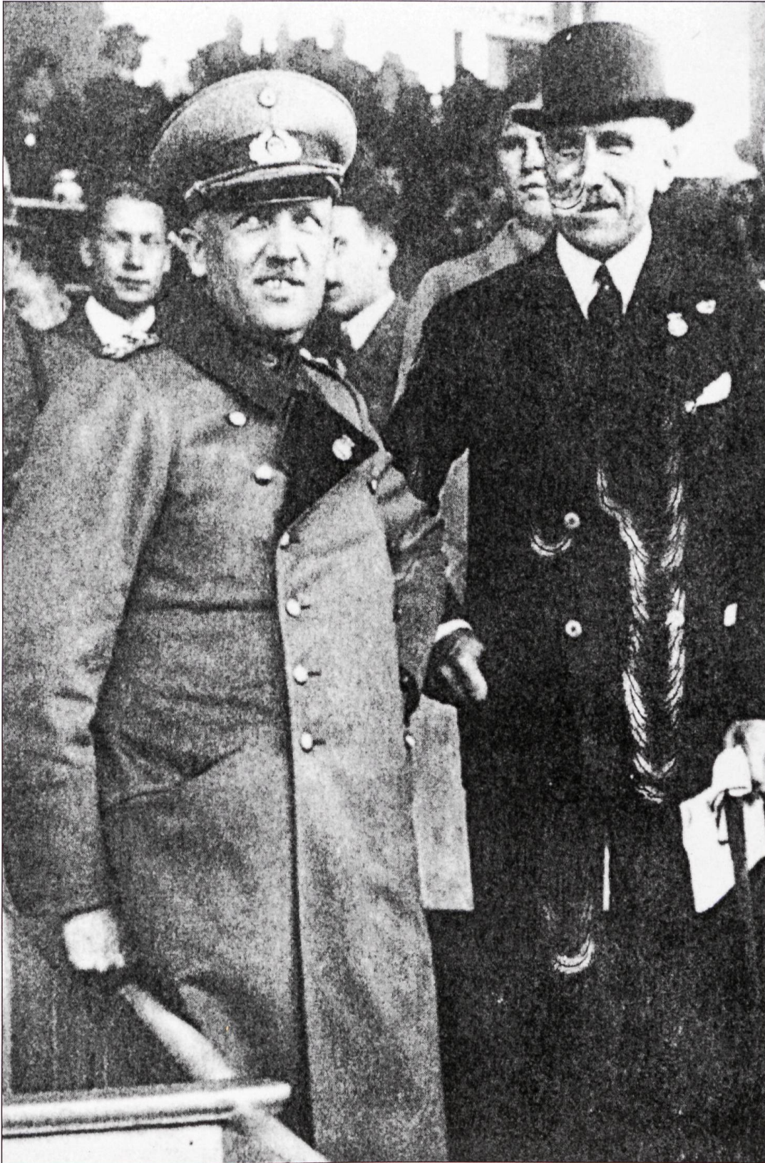
Hitlers «Steigbügelhalter»: General Kurt von Schleicher und Franz von Papen (1932).