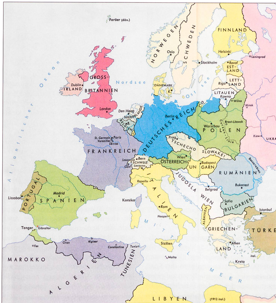
Europa nach 1918.

(Galizien), an Rumänien (Siebenbürgen, Bukowina), Istrien und Südtirol an Italien, Eupen und Malmedy an Belgien. Im Baltikum entstanden auf Kosten Russlands die Kleinstaaten Finnland, Estland, Lettland und Litauen. Die Türkei beklagte den Verlust der arabischen Gebiete Syrien, Libanon, Irak, Transjordanien und Palästina. Im Auftrag des Völkerbunds hatten Briten und Fran-