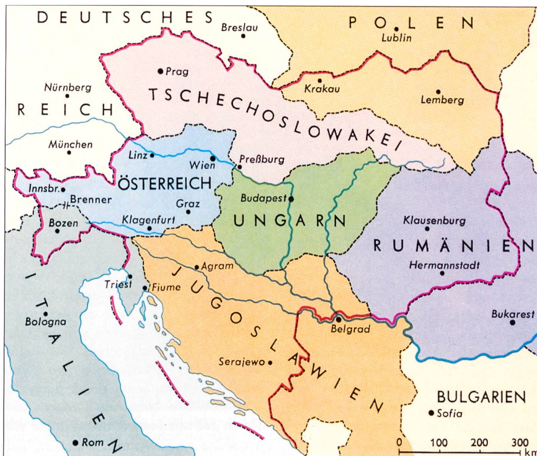
Die Aufteilung Österreich-Ungarns nach dem Ersten Weltkrieg.

chen Probleme besser in geschlossenen nationalen Wirtschaftseinheiten lösen zu können. Die Wirtschaftseuphorie in den USA trieb die Kurse der Wertpapiere in spekulative Höhen.