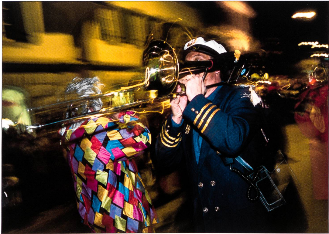
Bunt verkleidete Guuggenmusig in Altdorf. Die nach dem Zweiten Weltkrieg aufgekommenen Guuggenmusigen sind mittlerweile ein nicht mehr wegzudenkender Teil der Inner-schweizer Fasnacht.