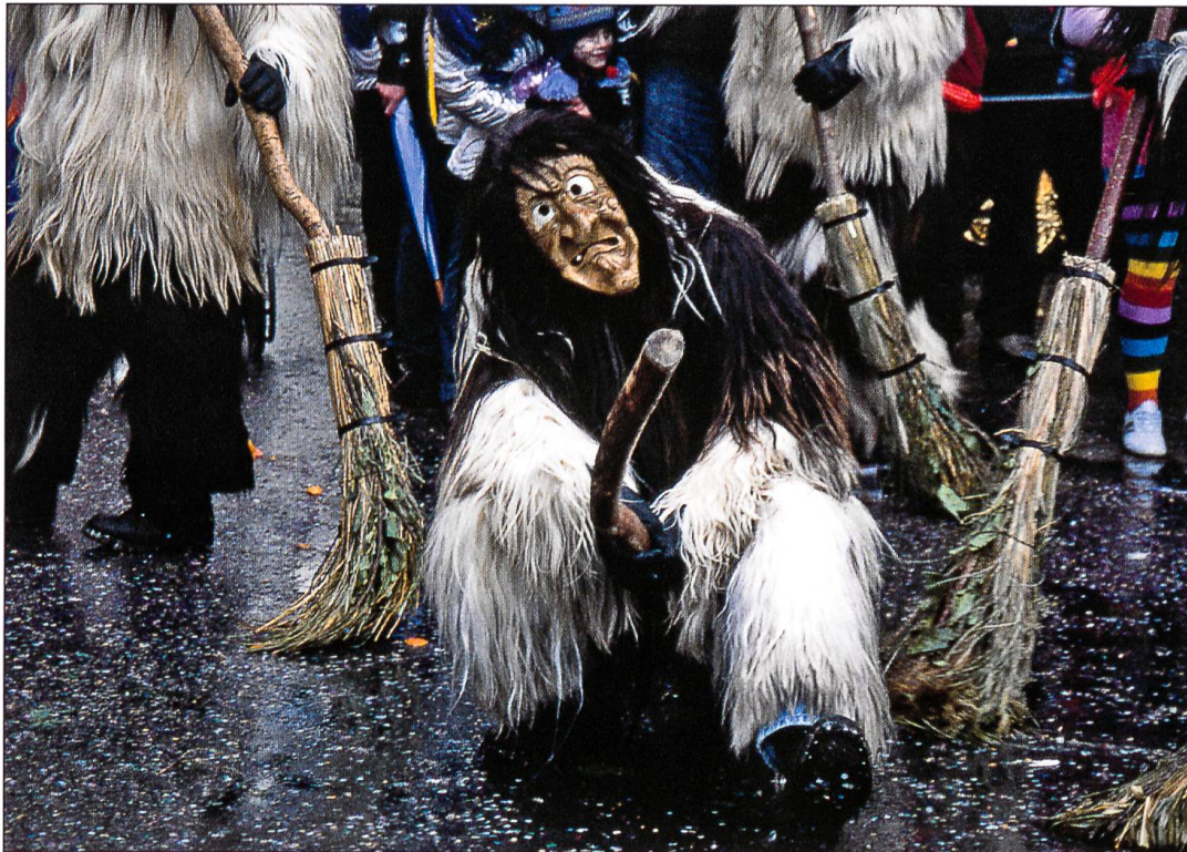
Eine Moorsträggele in Willisau. Die hexenartigen Gestalten mit den wirren Haaren stellen Totengeister dar, die der Legende nach die Moorlandschaft des Ostergaus bewohnen.