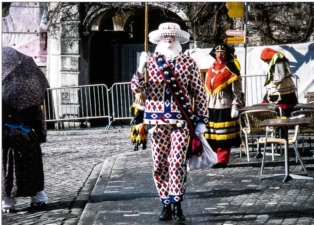
Schwyzer Blätz. Der Blätz ist eine der traditionellen Figuren der Schwyzer Fasnacht. Seine eigenartigen Bewegungen erinnern an ekstatische Tänze, die manchmal im Zustand der Trance aufgeführt werden.