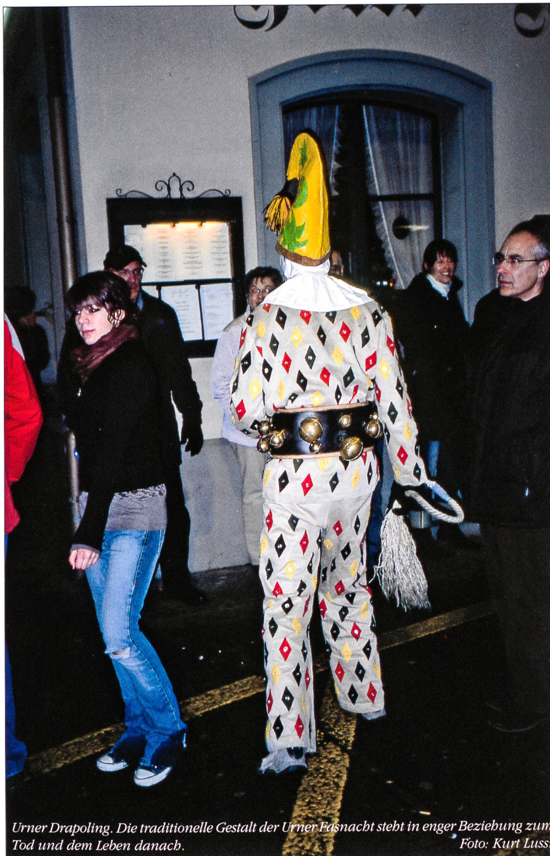
Urner Drapoling. Die traditionelle Gestalt der Urner Fasnacht steht in enger Beziehung zum Tod und dem Leben danach.