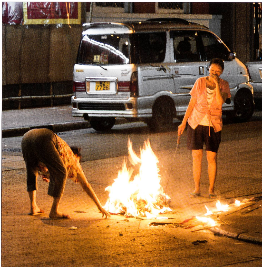
Hungry Ghost Festival in Kowloon, Hongkong. In der Shanghai Street verbrennen zwei Frauen Geistergeld und Zettel mit guten Wünschen. Über den Rauch gelangen die Opfergaben zu den Seelen der Toten.