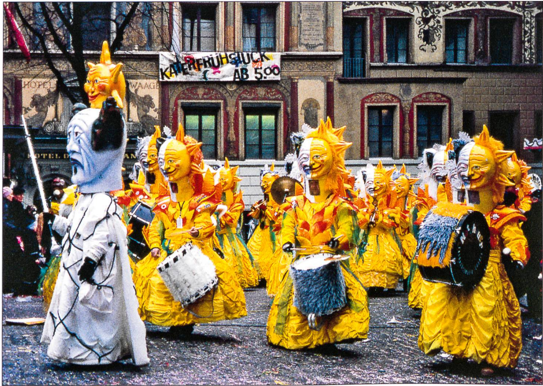
Guuggenmusik in der Stadt Luzern. Das gesittete Auftreten der einheitlich gekleideten Musikgruppen hat mit der Wildheit der Totenheere nur noch wenig gemeinsam.