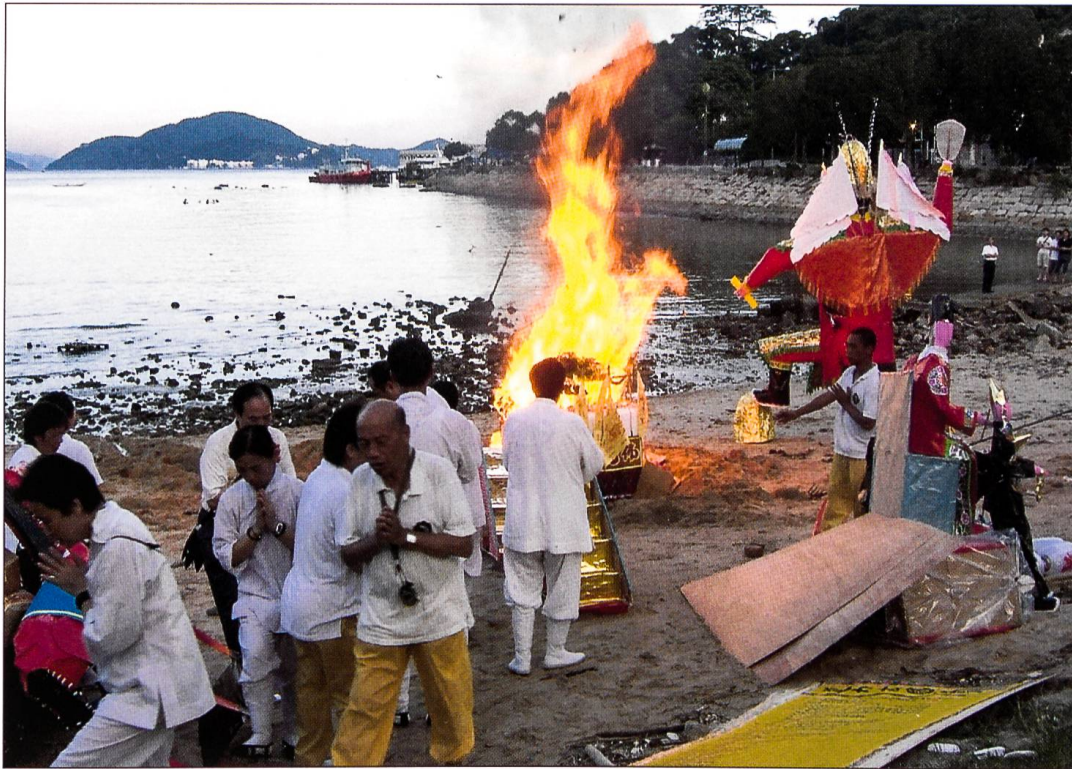
Ghost Festival in Mui Wo, Lantau Island, Hongkong. Das Festival dient der rituellen Speisung der aus dem Jenseits zurückkehrenden Seelen der Toten. Die dem Feuer übergebenen Maskengestalten aus Papier symbolisieren die Rückkehr der Toten in die Schattenwelt.