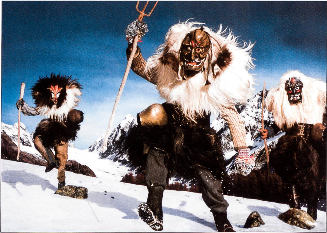
Entfesselte Roitschäggättä im Walliser Lötschental. In abgelegenen Bergtälern hat sich das Maskenlaufen in archaischen Formen erhalten.