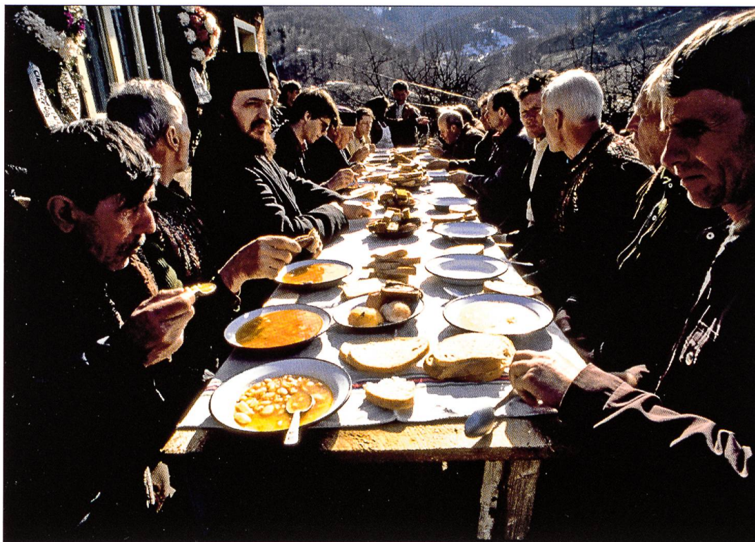
Leichenmahl in den Karpaten (Rumänien). Unsichtbar für die Lebenden ist nach dem Volksglauben der Tote anwesend.