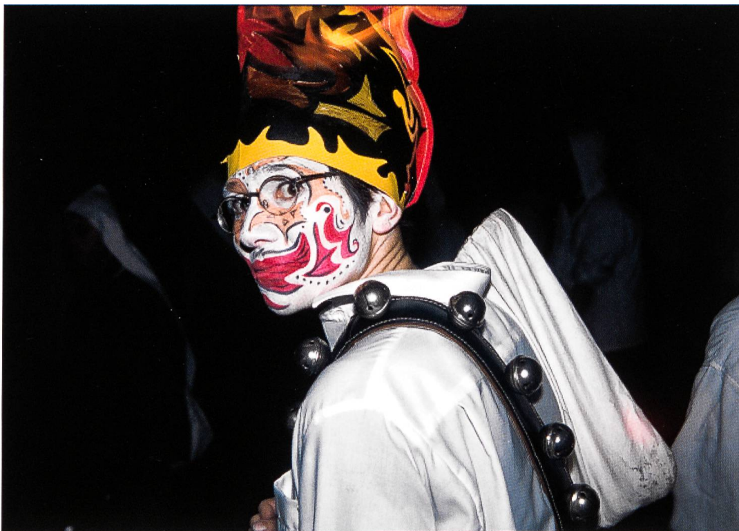
Teil des Geleits des hl. Nikolaus in Stans ist der Gaiggel. Auch er ist ein Beleg dafür, dass viele christliche Feste heidnische Wurzeln haben.