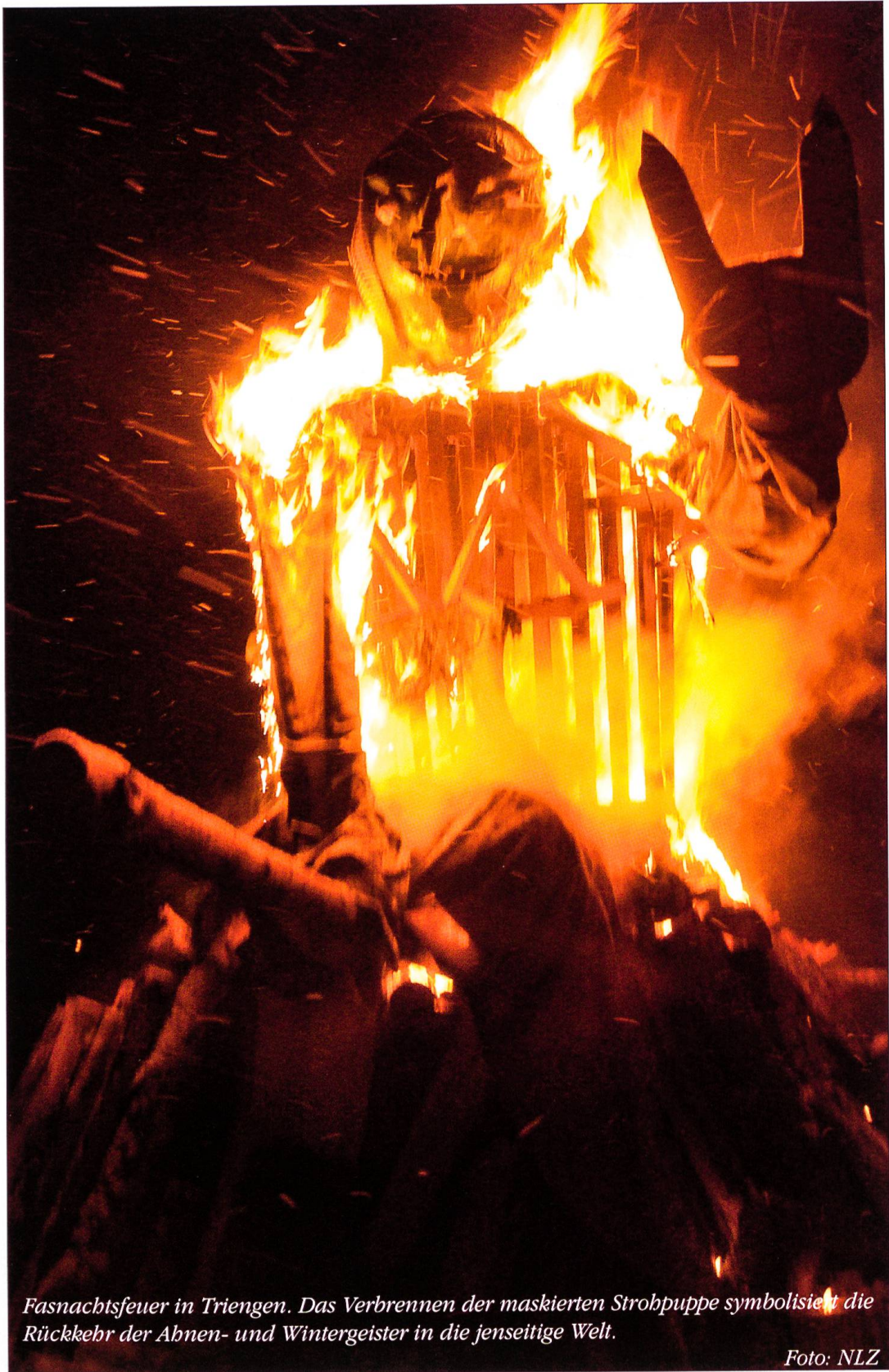
Fasnachtsfeuer in Triengen. Das Verbrennen der maskierten Strohuppe symbolisiert die Rückkehr der Abnen- und Wintergeister in die jenseitige Welt.