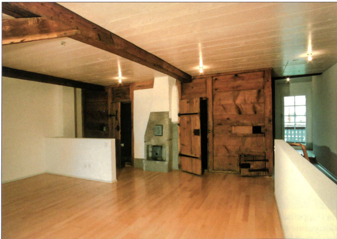
Das heutige Büro im Dachgeschoss des Spittels mit Blick auf die alte WC-Tür.