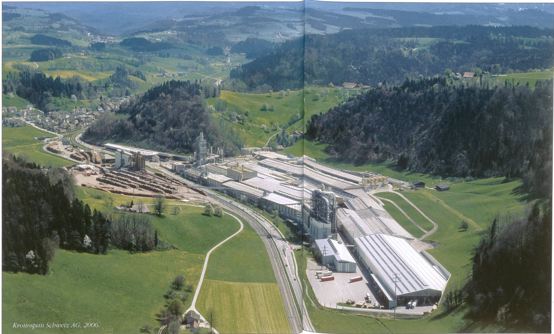
Kronospan Schweiz AG, 2006.