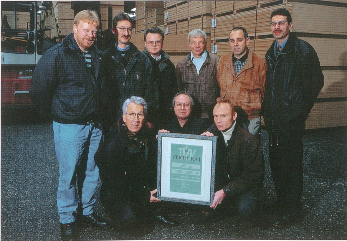
Zertifizierung ISO 14001.

die meisten Messergebnisse die vorgegebenen Werte massiv. Wo Richtwerte noch nicht erreicht wurden oder wo Sanierungen technisch noch nicht machbar waren (Gesamt-Kohlenstoff), wurden Termine für Nachrüstungen vereinbart. Regelmässige externe Überprüfungen wurden sichergestellt. Im Bericht wurde auf eine technisch wie personell funktionierende Sicherheitsorganisation im Betrieb hingewiesen, auf eine korrekte Entsorgung von Abwasser und Sondermüll, auf eine optimale Verwertung von festen Abfällen aus der Produktion sowie auf einen ökologisch sinnvollen Einsatz von Energie mit minimalem fossilem Brennstoffanteil.