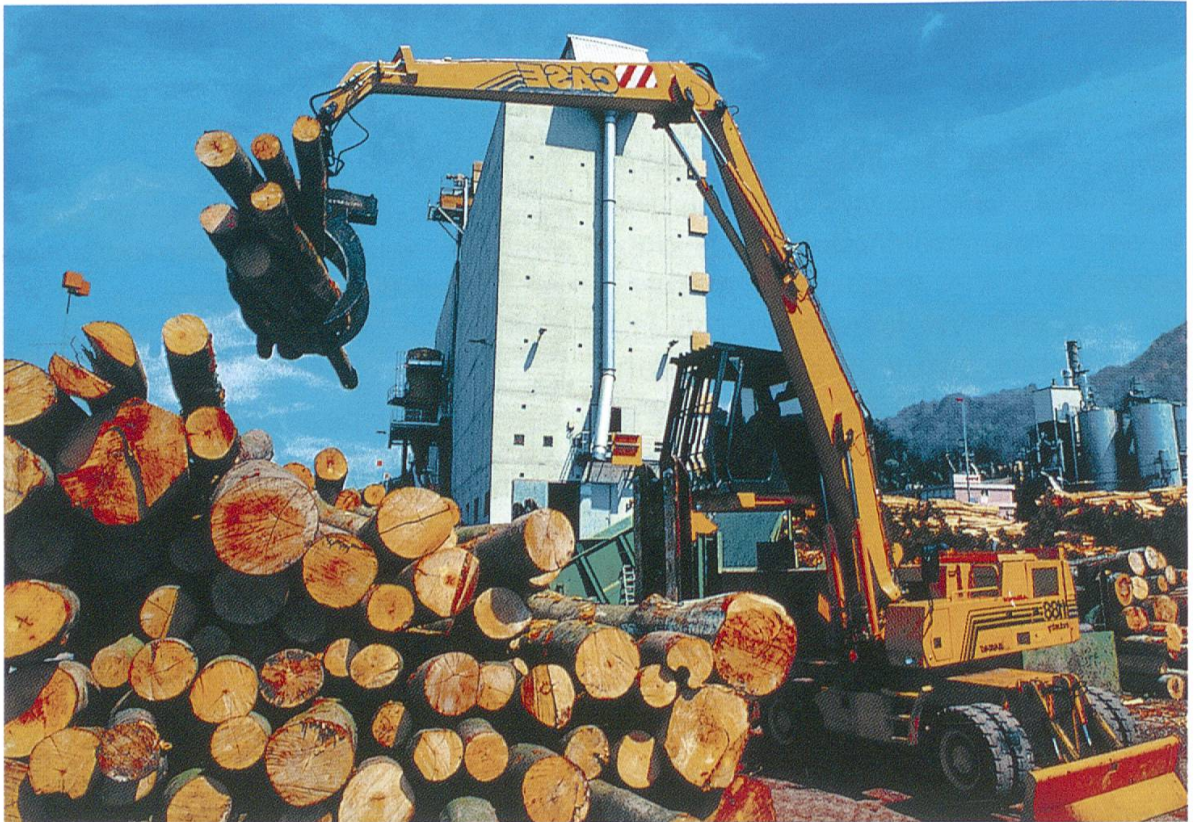
Holznutzung bei Kronospan.