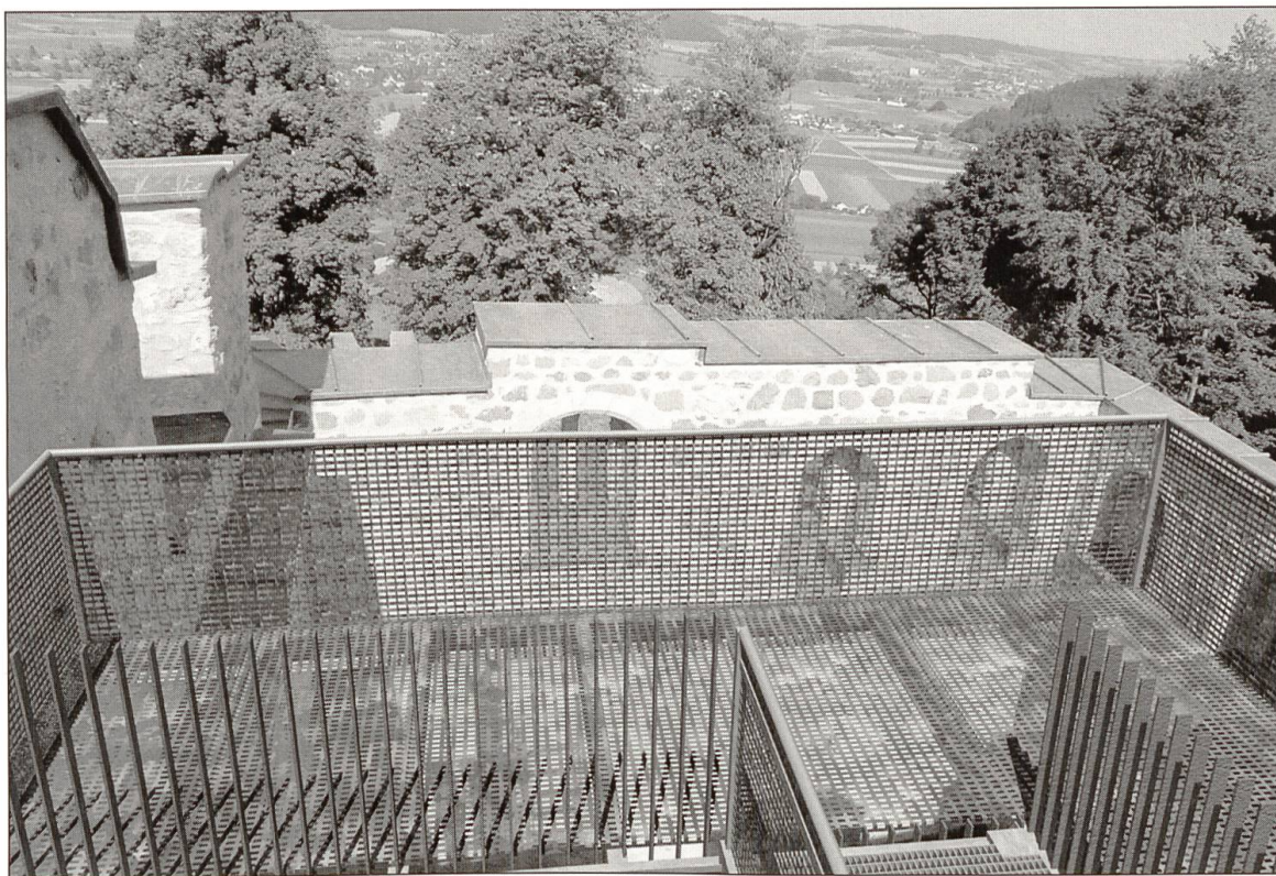
Auf der obersten Plattform, mit der Stabverkleidung des Turmes und den Gitterrosten auf dem Boden und an den Geländern.

man den Besuchern das Kultur- und Geschichtsdenkmal näher bringen, andererseits würde es unter einer unsachgemässen Übernutzung leiden und seine Eigenartigkeit verlieren. Das war auch bei allen Kontakten mit der Kantonalen Denkmalpflege immer wieder ernsthafter Gesprächsstoff. Diese Kriterien sind mit dem nun gewählten Bauwerk in grösstmöglichem Umfang berücksichtigt.