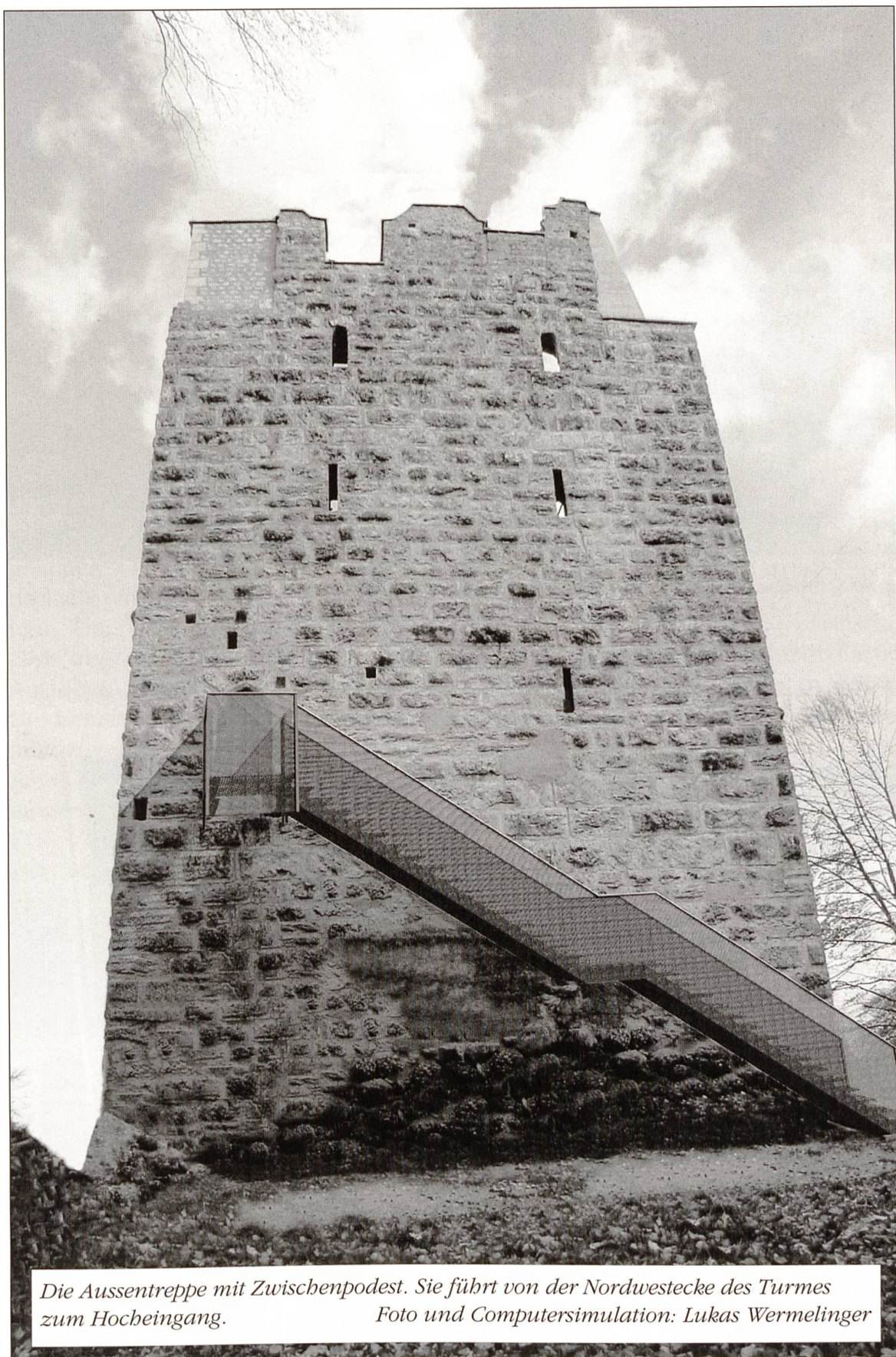
Die Aussentreppe mit Zwischenpodest. Sie führt von der Nordwestecke des Turmes zum Hocheingang.