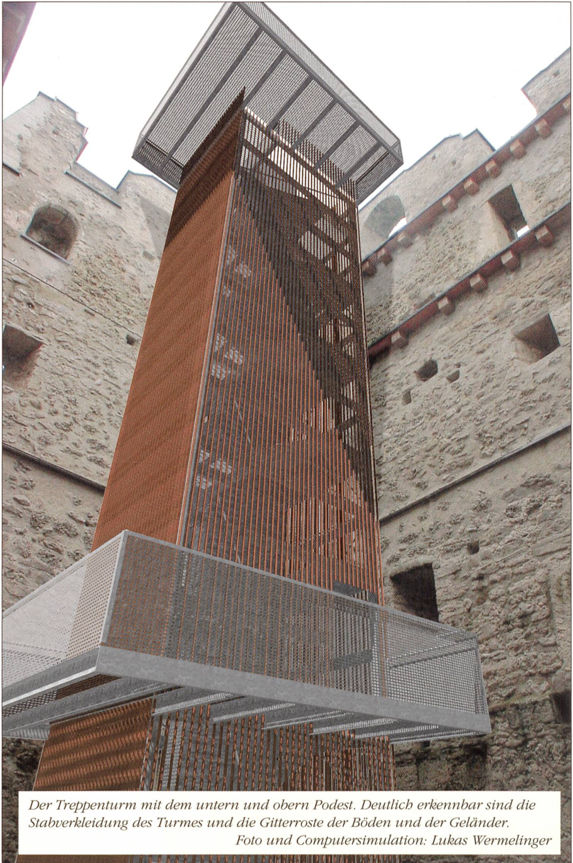
Der Treppenturm mit dem untern und obern Podest. Deutlich erkennbar sind die Stabverkleidung des Turmes und die Gitterroste der Böden und der Geländer.