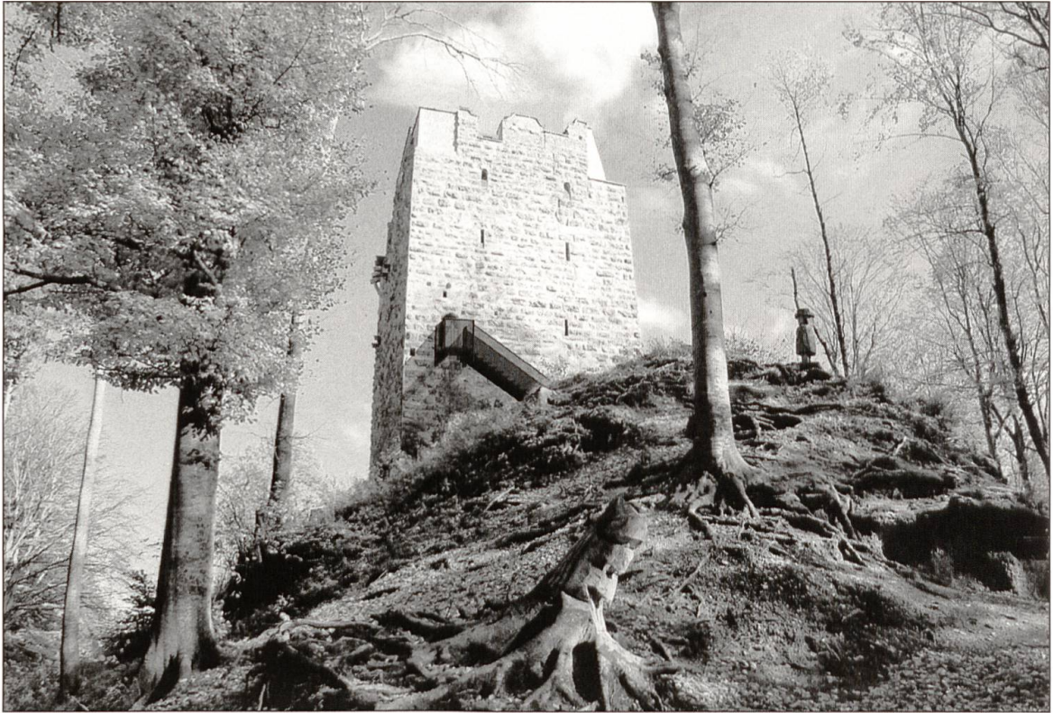
Die stolze Burg, wieder zugänglich für die Aussicht auf der obersten Plattform.

Foto und Computersimulation: Lukas Wermelinger