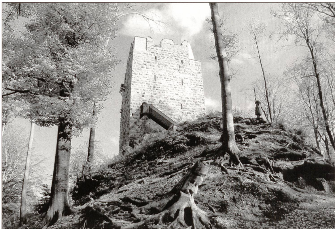
Die stolze Burg, wieder zugänglich für die Aussicht auf der obersten Plattform.

Foto und Computersimulation: Lukas Wermelinger