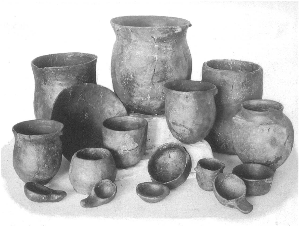
Auswahl von Tongefäßen aus den Funden von 1932.