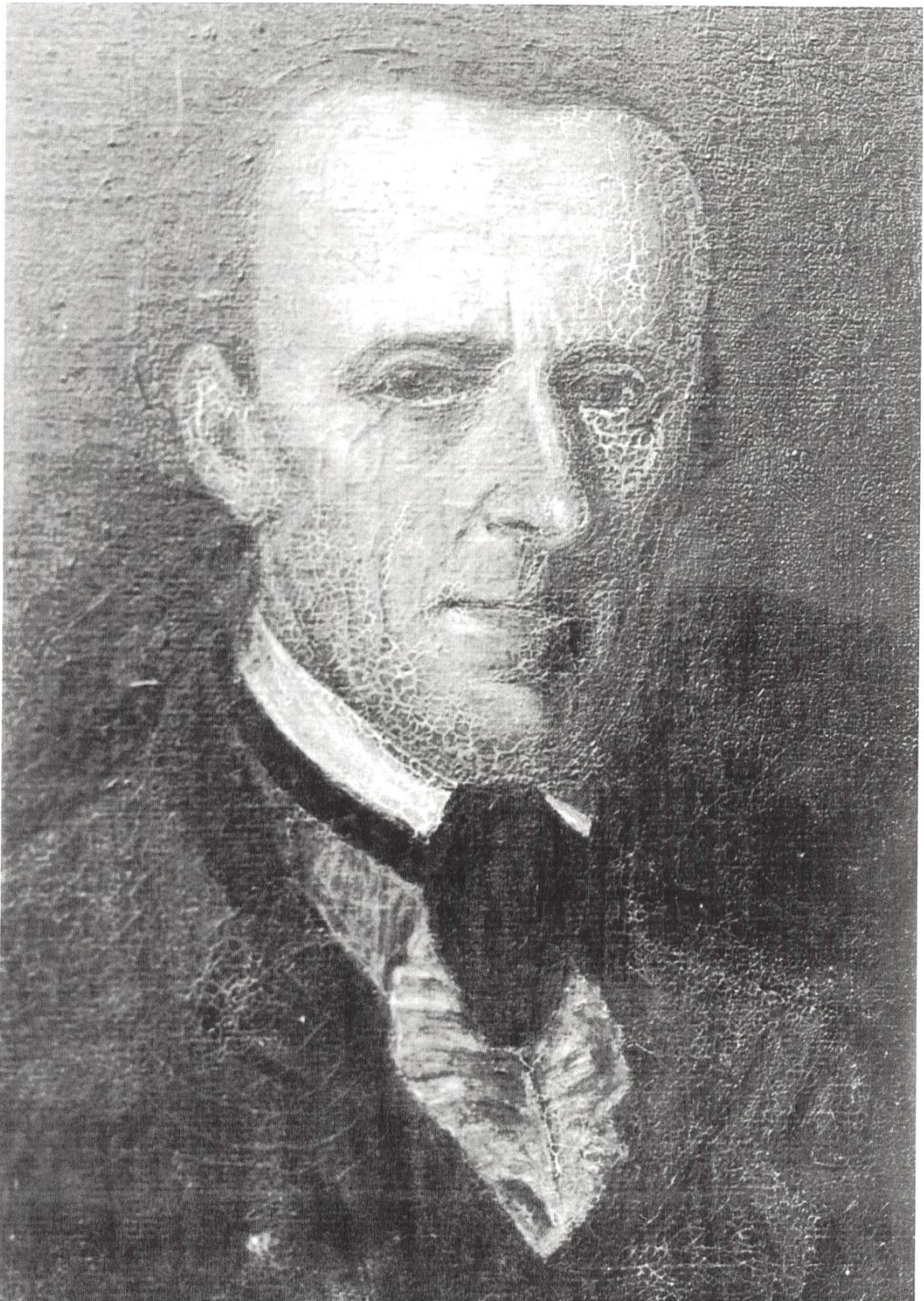
Distriktsstatthalter Josef Leonz Zettel (1752–1842), mit dem Zunamen «Böhni». Das Originalbild in Öl befindet sich im Gasthof Löwen, Grossdietwil.