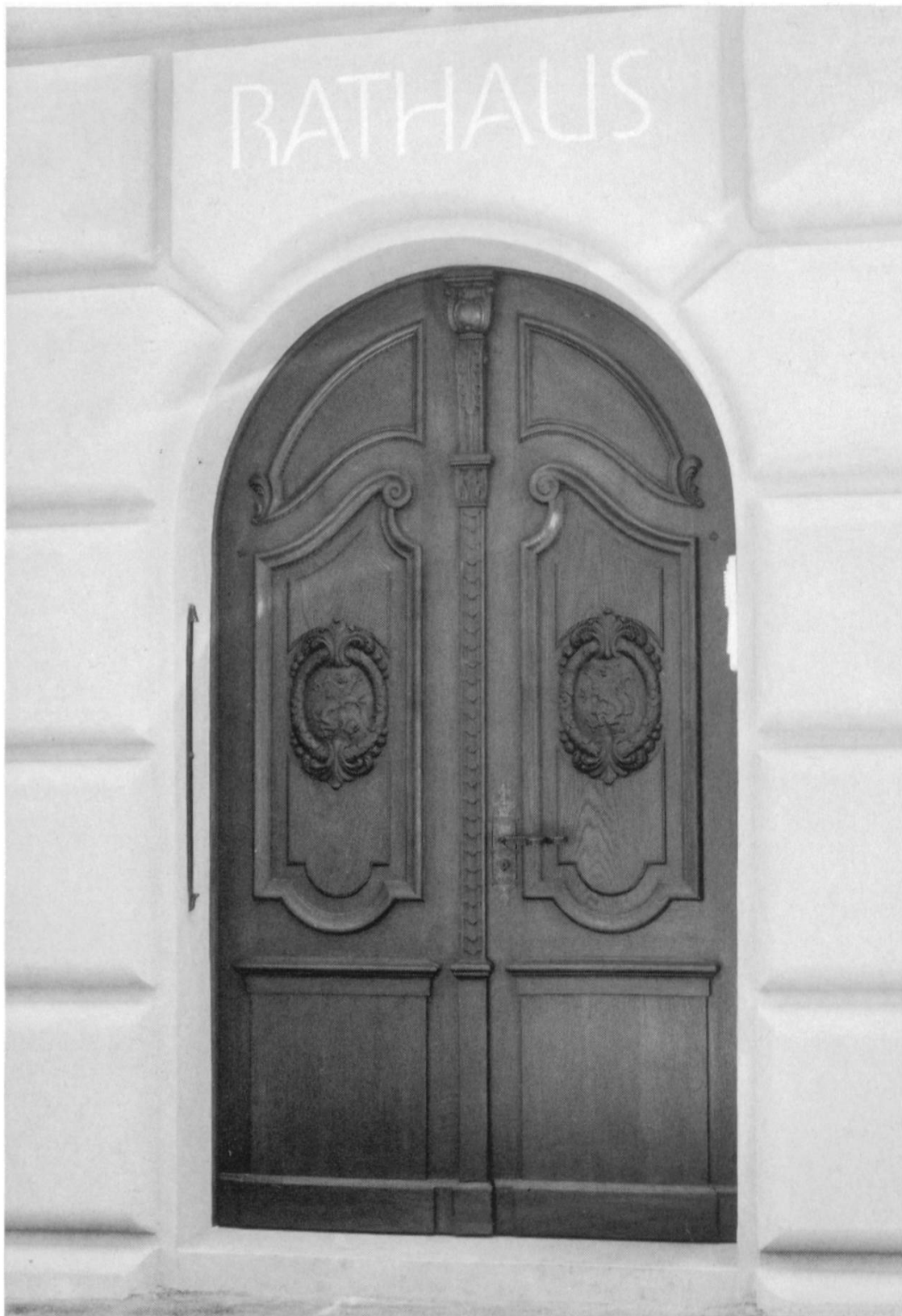
Das Eingangsportal zum Rathaus mit der eisernen Willisauer Tuchelle (63 cm Länge).