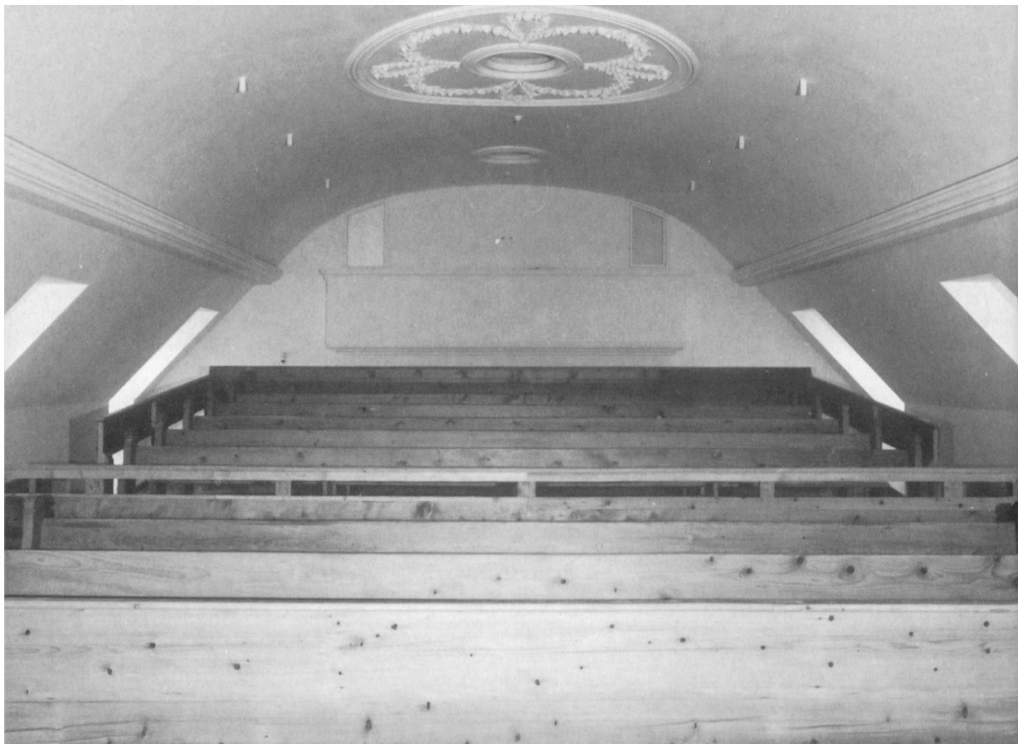
Das in den Dachstock verlegte, aus dem frühen 18. Jahrhundert stammende spätbarocke Innentheater.

wertes Baudenkmal im national eingestuften Willisauer Ortsbild klassiert. Im Spätsommer 1986 wurde zwecks eingehender und abschliessender Abklärungen sowie für die Erarbeitung eines Nutzungs- und Restaurierungskonzeptes eine Arbeitsgruppe Rathaus Willisau bestellt. Der Arbeitsgruppe unter dem Präsidium von Robert Tschopp gehörten einheimische und auswärtige Persönlichkeiten an; die Vorarbeiten wurden in enger Zusammenarbeit mit der kantonalen und eidgenössischen Denkmalpflege durchgezogen. Bereits im Herbst 1988 konnten die Stimmberechtigten dem Bauvorhaben zustimmen und den benötigten Kredit von 5,6 Millionen Franken bewilligen. Neben den beachtlichen Subventionen seitens der Denkmalpflege hat