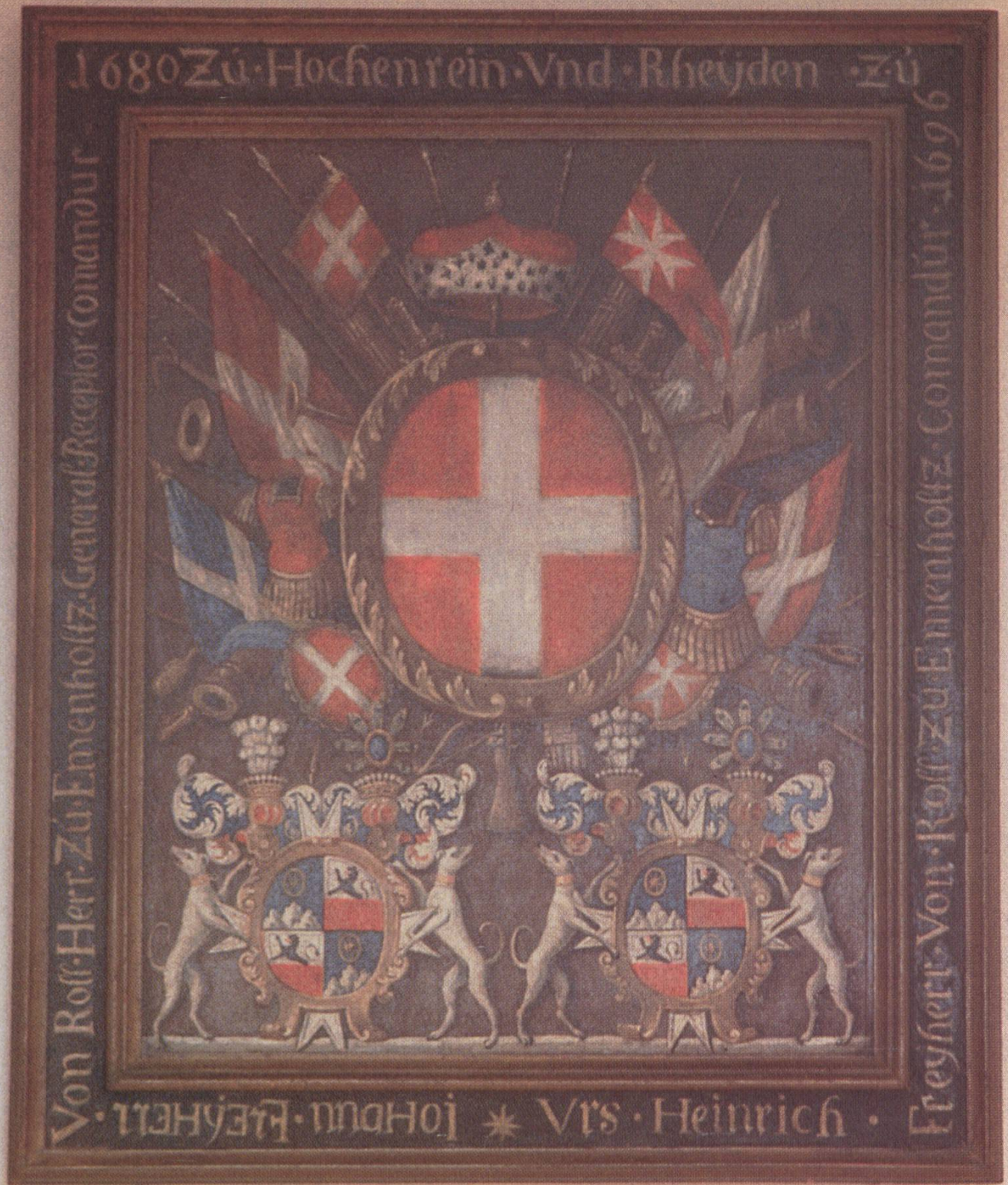
In der Ritterstube hängt die Wappentafel des Komturs Urs Heinrich von Roll.