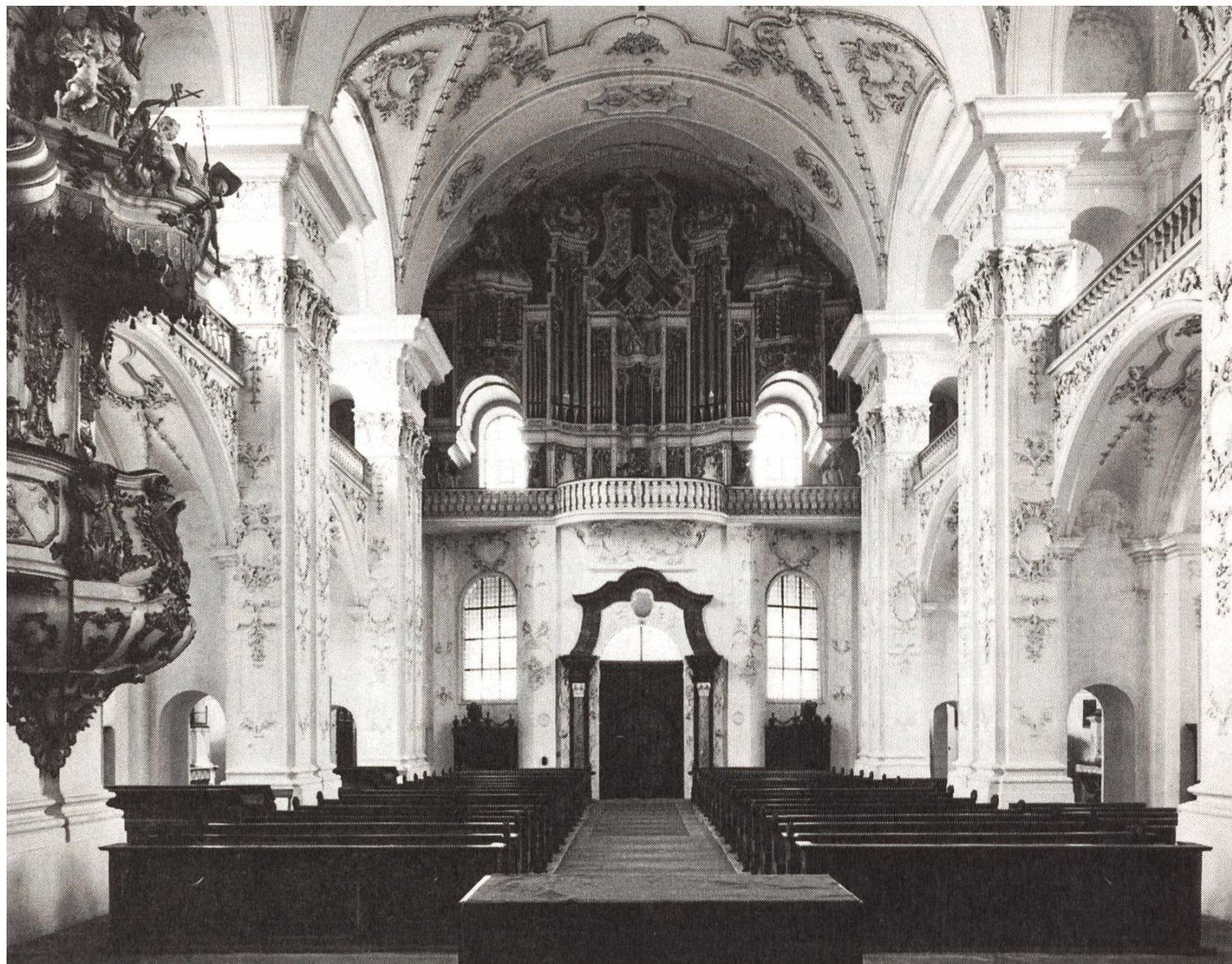
1 Die monumentale Eingangsseite der Klosterkirche kurz vor ihrem Einrüsten fotografiert.

Waren es Alterserscheinungen? Der Kantonsbaumeister meinte ferner, dass als mögliche Ursachen der letztjährige kalte Winter, ja sogar die negativen Auswirkungen von Überschallflügen oder auch Resonanzschwingungen mit im Spiel sein könnten. Vermutlich handle es sich um das Zusammenwirken verschiedener Umstände. Nicht verschwiegen sei, dass die Klosterkirche seit ihrem Bestehen vor rund 270 Jahren, abgesehen von einigen Reparaturen, bis heute nie restauriert wurde. Spricht das nicht für die damaligen Bauleute?! Mit dem Einbau des Schutzgerüsts wurden die Gefahren eines Kirchenbetretens beseitigt. Allerdings – wie könnte das anders sein – wurden dadurch die feinen Schönheiten des einzigartigen und grossartigen sakralen Raumes stark beschnitten. Diese Schmälerung wird nun einige Jahre andauern.