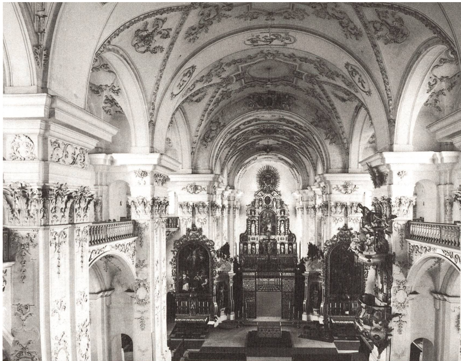
2 Blick auf die Chorseite der Kirche; aufgenommen knapp vor ihrem Einrücken.

Wie soll es jetzt in St. Urban weitergehen? Das Schutzgerüst, wie der Name verrät, ist einstweilen vor allem Schutz, und dient zugleich für die bevorstehende Restauration der Kirche. Zuerst wird ein detaillierter Bauuntersuch durchgeführt, der als Basis für den auszuarbeitenden Kostenvoranschlag gelten wird. Ein wichtiger Punkt ist das Abklären der Statik und der Schadenursachen. Zu erarbeiten sind ferner die Planunterlagen; es ist nach den historischen Plänen zu forschen und herauszufinden, ob die Kirche früher einmal bereits vermessen wurde. Aus den gewonnenen Unterlagen wird zu guter Letzt der Kostenvoranschlag herauswachsen. Dabei ist auch abzuklären, wie hoch sich der Bund an den Kosten beteiligen wird. Nach dem umfangreichen Prozedere wird zuhänden des Regierungsrates und Grossen Rates eine Botschaft verfasst. Sie wird voraussichtlich im