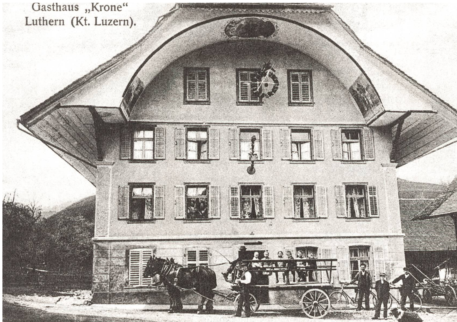
2 Gasthaus Krone um 1912.

Der Antrag drang durch und die, verglichen mit heutigen Anlässen, sicher bescheidene Lustbarkeit ging unter. Der Verein setzte sich aber auch für Arbeitsbeschaffung ein. Zum Beispiel mittels Seidenspinnen, Anpflanzungen und Gemeindewerke. Das Ergebnis war zweifellos mager. Am 29. September 1855 war angeblich fast die ganze Gemeinde im Verein. Ihre Beitrittsverweigerung begründeten die wenigen Opponenten damit, dass man nicht wünsche, dass daraus eine neue Pflicht erwachse (zusätzliche Steuer), dass man selbst arm sei und auch aus Protest, dass die Sennenkilbi abgeschafft worden sei.