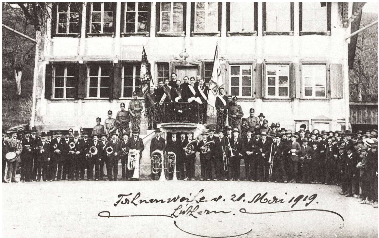
3 Gemeindehaus zur «Wölfen» 1919.