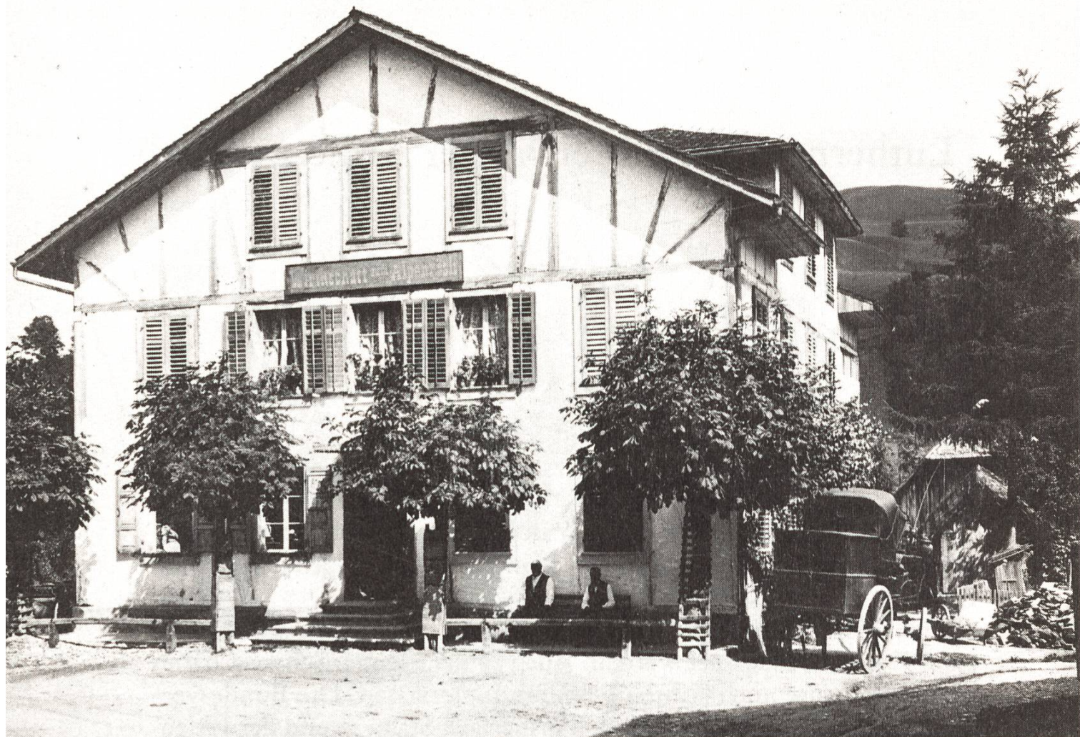
1 Restaurant Alpenrösli im Unterdorf (heute Haus «Fischer») um 1900.