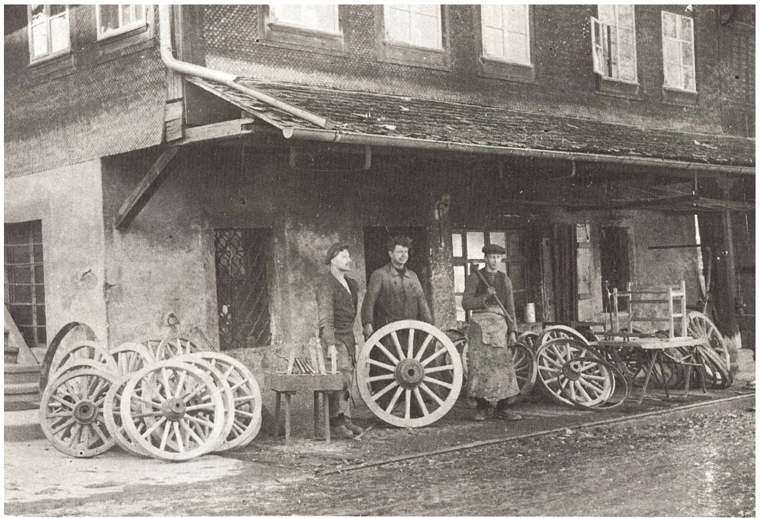
4 Dorfschmiede Luthern in den zwanziger Jahren.

dringen ein christliches Leben zu führen. Finden sie, dass verdungene Kinder weder gehörig gepflegt, noch christlich erzogen werden, so haben sie dieses unverweilt dem Vorstande anzuzeigen.»