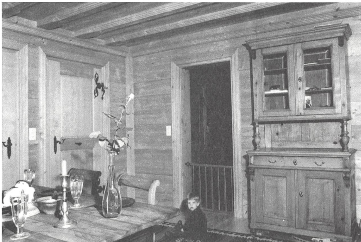
Stube im ersten Obergeschoss: Gotisierende Rippendecke und massives Wandtäfer im Stile des 16. Jahrhunderts.