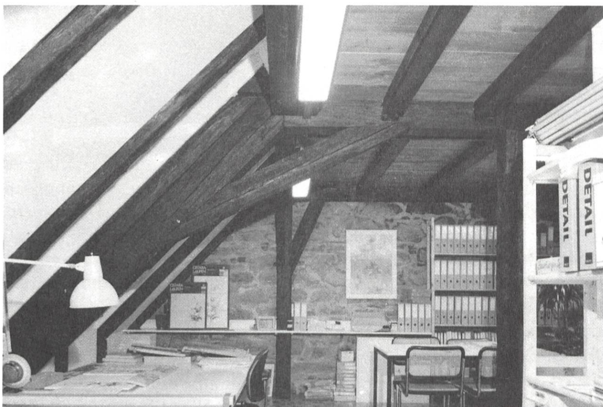
Bestehende 400 Jahre alte Dachkonstruktion im dritten Obergeschoss.