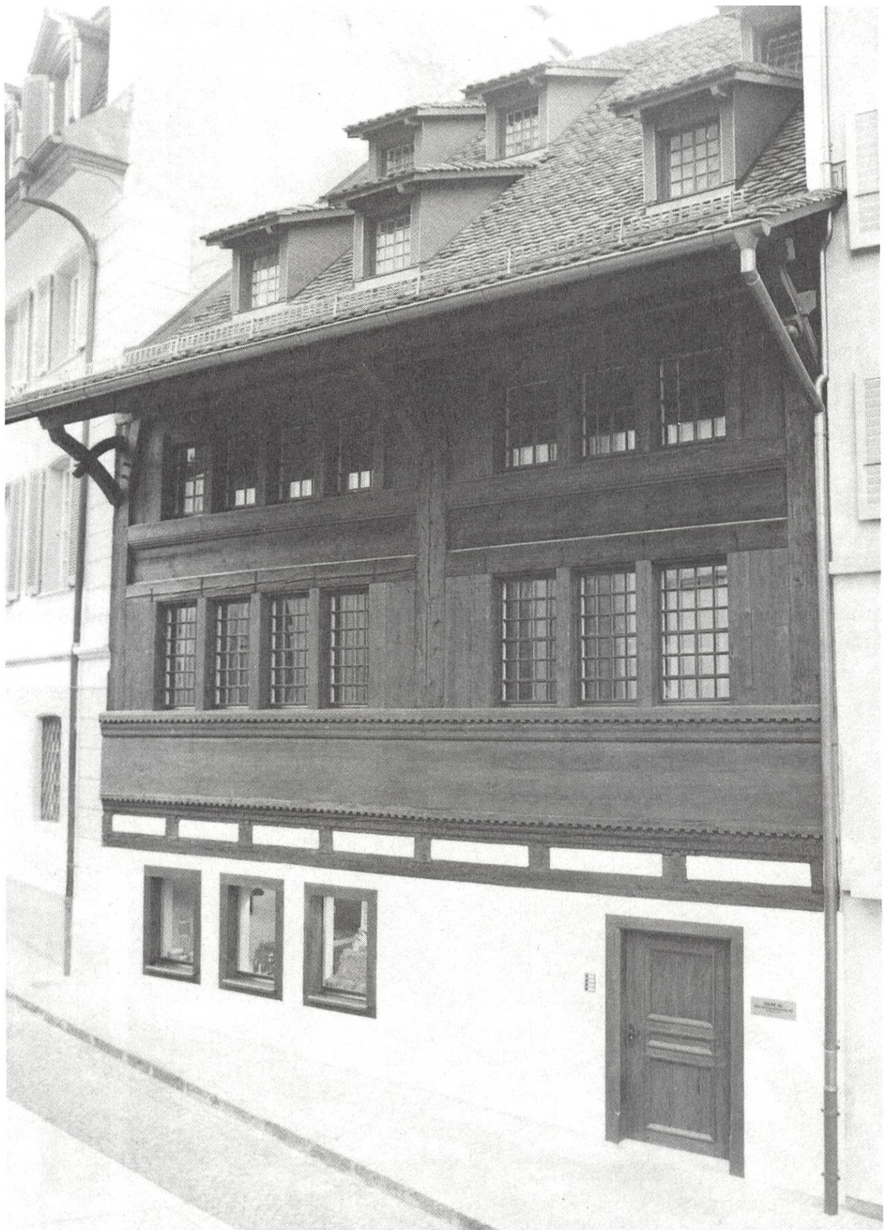
Haus Müligass 5, erbaut 1590, mit der bei der Restaurierung von 1982/83 freigelegten ursprünglichen Holzfassade.