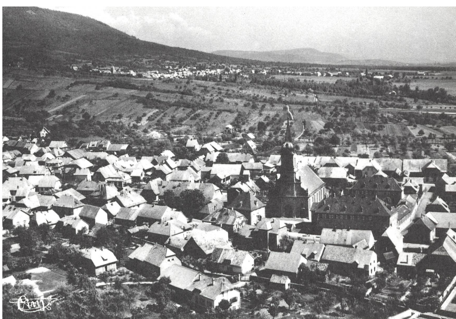
Uffholtz heute. Im Hintergrund liegt Wattwiller.