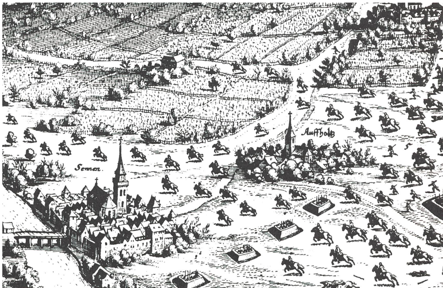
Kupferstich des Baslers Mattheus Merian: «Die Feldschlacht von Wattweiler» (12. März 1634). Auszug aus dem «Theatrum Europaeum», einer zeitgenössischen Zeitung. Die Schweden treiben die Kaiserlichen in die Flucht. Vier Jahre später trafen in Uffholtz die ersten Schweizer Einwanderer ein. Sennen = Sennheim (Cernay), Waatweil = Wattweiler (Wattwiler), Auffholtz = Uffholtz, Dann = Thann.