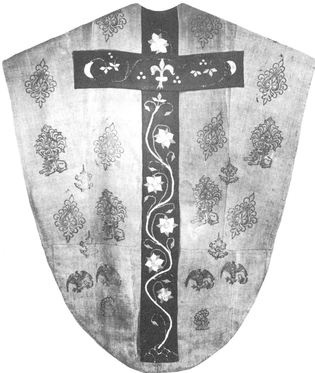
Ulrichs-Kasel von Luthern