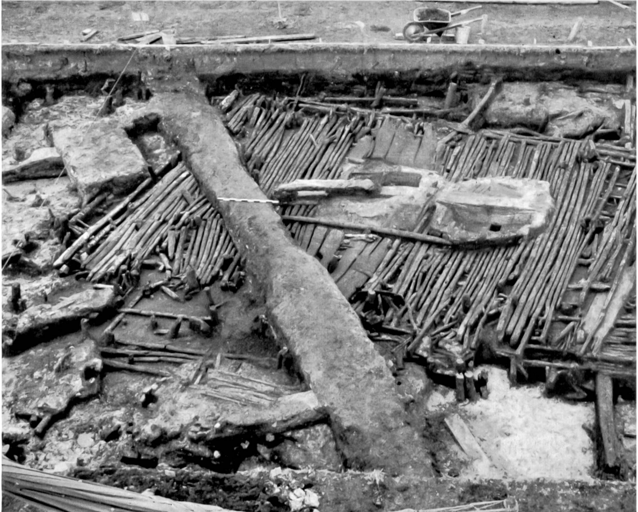
Tafel 10. Boden eines steinzeitlichen Moorhauses in Egoizwil 4, der 1954 ausgegraben wurde. Schräg durch den Hausboden zieht sich ein Meliorationsgraben, links außen sind andere Störungen sichtbar. In der Bildmitte sind die beiden, bereits aufgeschnittenen Herdstellen, links jene, die von Anfang an eingebaut und für die der Hausboden ausgespart wurde. Tafel 4 zeigt einen Querschnitt durch diese Herdstelle. Rechts ist die später auf den Prügelboden gelegte Herdstelle. Vergleiche Seite 39.