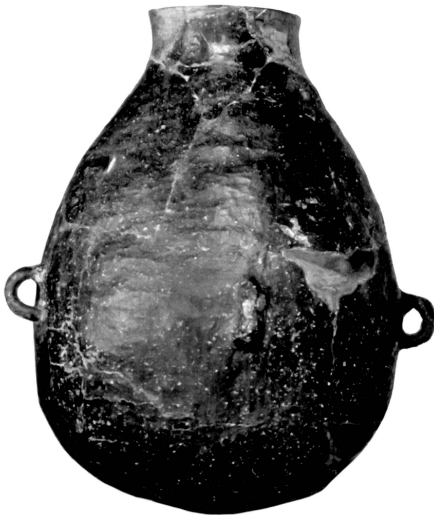
Tafel 9. Flasche aus grauschwarzem, mit Quarzsand fein gemagertem Ton mit 4 Aufhängeösen. Dieses rundbodige, dünnwandige Gefäß läßt deutlich den Aufbau mittels Parallelwulsttechnik erkennen. Einzelne Stellen sind leicht ergänzt. Fassungsvermögen 8,125 Liter, Höhe 34,5 cm, größter Durchmesser 24,7 cm. Vergleiche Seite 35.