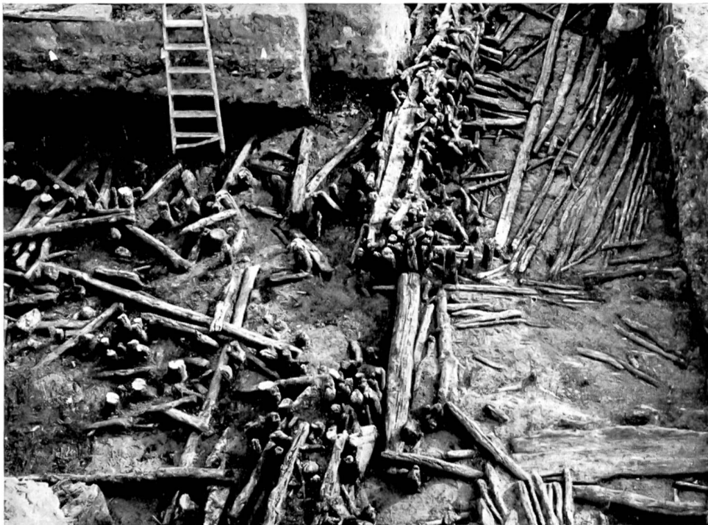
Tafel 12. Eingang durch den mehrperiodigen Dorfzaun in Egolzwil 4, freigelegt im Jahre 1956. Wir sehen in der Mitte die Eingangsschwelle, links Reste des Zugangsweges und rechts den Unterbau des ca. 2 m breiten Bohlenweges, der der Innenseite des Zaunes entlang führte. Vergleiche Seite 41.