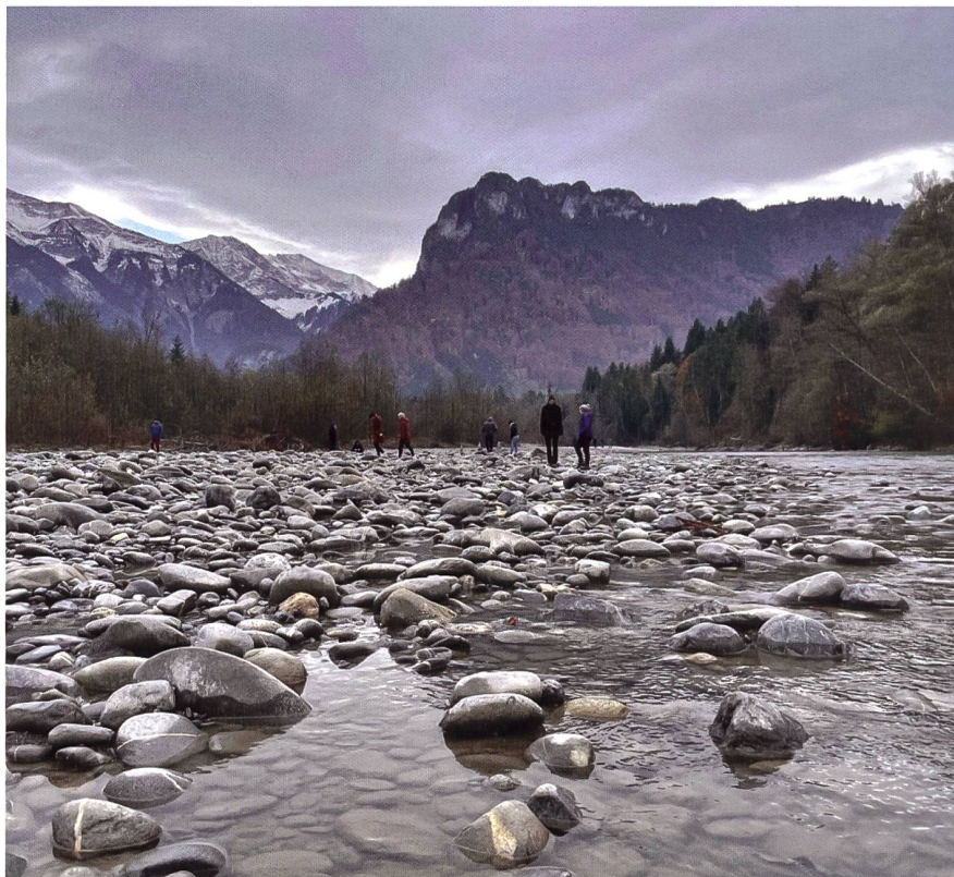
Exkursion zur Simme und Kander (Kanton Bern). Dieser Kanderabschnitt profitiert von einer erhöhten Geschiebezufuhr vom Wehr Simme Port, bei dem Geschiebe durch regelmässige Staupegelabsenkungen durchgeleitet wird.

Wie die Beiträge der Referentinnen und Referenten zeigten, bedeutet Geschiebe-