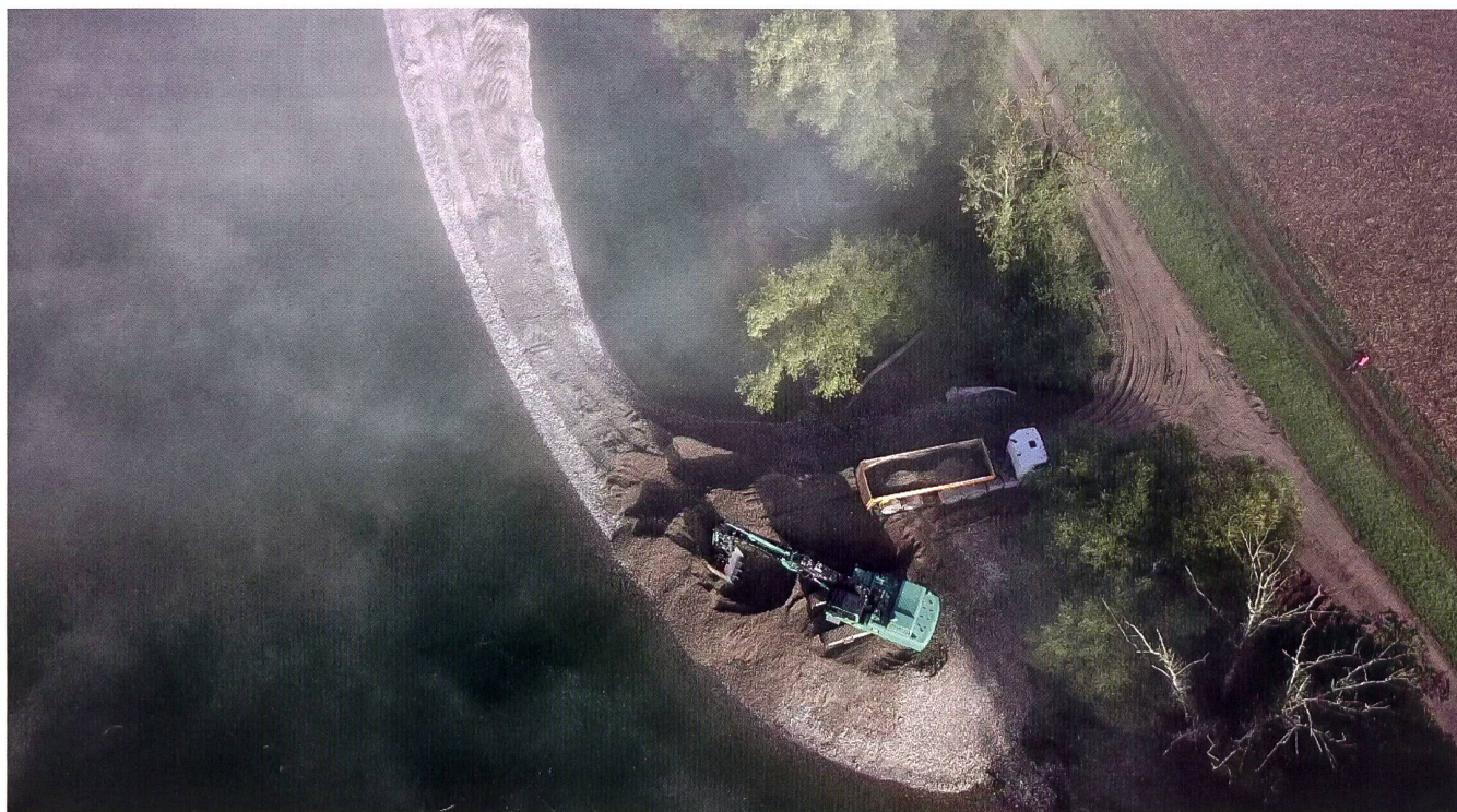
Eine mögliche Massnahme zur Sanierung des Geschiebehaushalts: Kiesentnahme oberhalb des Stauwehrs und Verlad auf LKW für die anschliessende Schüttung im Unterwasser. Kraftwerk Bremgarten-Zufikon an der Reuss.

Entscheidend für die Weiterentwicklung der Geschiebesanierung, so zeigte sich in