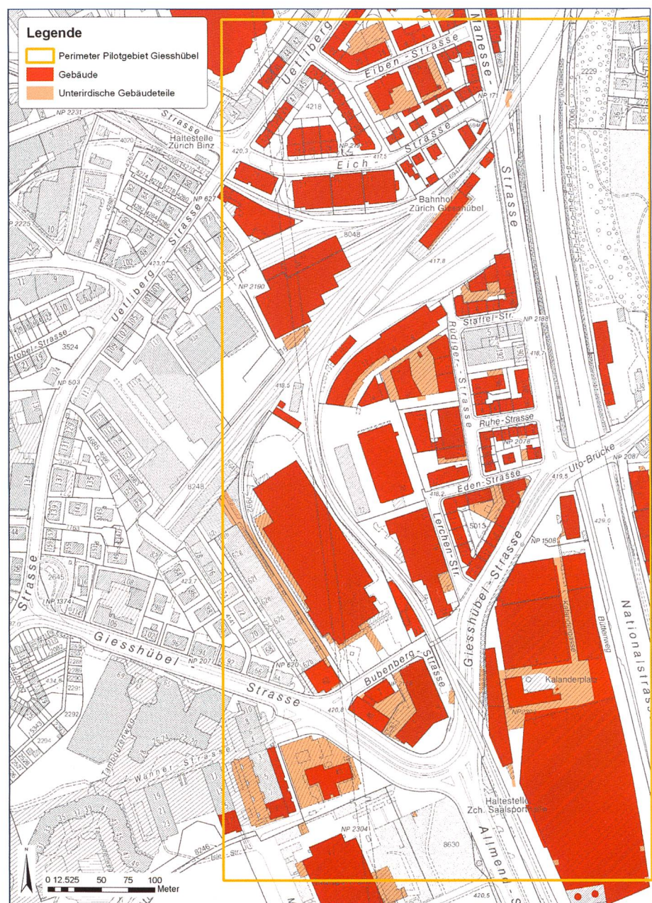
Bild 1. Überblick über das Untersuchungsgebiet Giesshübel. Rot dargestellt sind die erhobenen Gebäude und hellrot schraffiert die dazugehörigen unterirdischen Gebäudeteile. Die Sihl verläuft in diesem Bereich unterhalb der Nationalstrasse.

Eine Risikoanalyse gibt grundsätzlich Antwort auf die Frage, welche Personen- und Sachschäden im Ereignisfall zu erwarten sind. Dazu werden die Schutzgüter mit den Intensitätskarten der verschiedenen Sze-