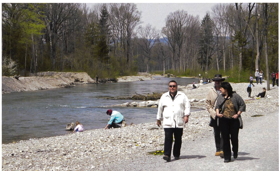
Bild 3. Hochwasserschutzprojekt Aare Thun-Bern. Lokal ist auch die Verbesserung des Erholungswertes und der Erholungsinfrastruktur ein Ziel.

Der Renaturierungsfonds des Kantons Bern verfolgt bei den EK das Prinzip der «Typenprüfung». Dabei werden nicht jede einzelne Massnahme, sondern stellvertretende Typen (Repräsentanten von Massnahmen) mit einem vordefinierten Set an Indikatoren einer EK unterzogen. Dies führt zu einem besseren Aufwand-Nutzen-Verhältnis.