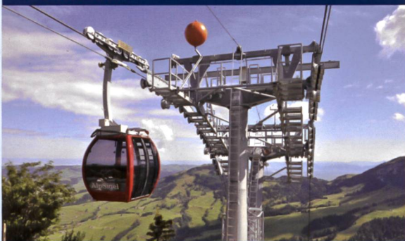
Personen- und Materialseilbahnen