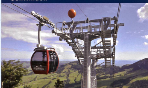
Personen- und Materialseilbahnen