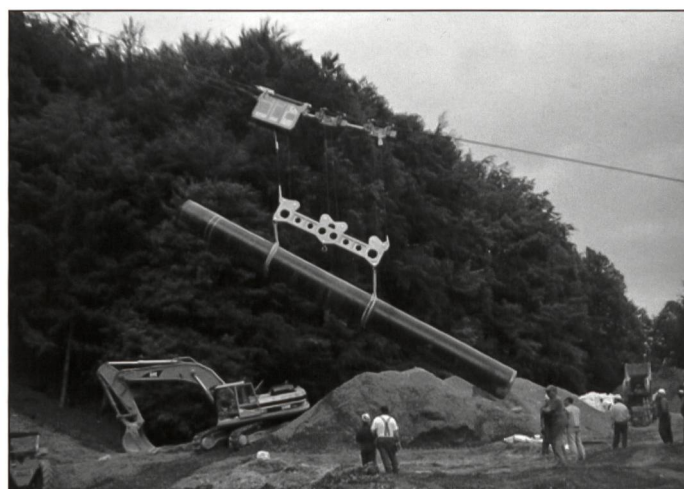
Transport und Versetzen Erdgasleitung, Rohrgewicht 12 Tonnen