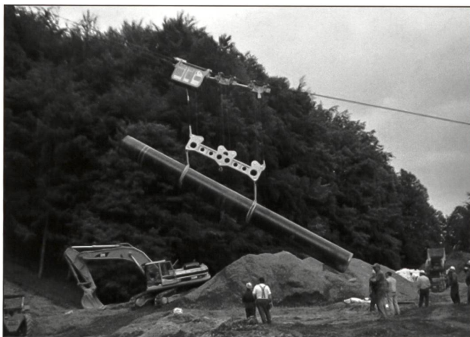
Transport und Versetzen Erdgasleitung, Rohrgewicht 12 Tonnen