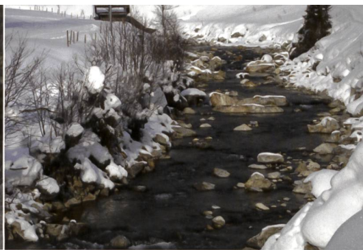
Bild 2b. Gadmerwasser im Winter 2010 mit einer geschätzten Dotierwassermenge von 150 l/s. Im oberen Bildrand ist das Wehr der Fassung Führen zu erkennen.