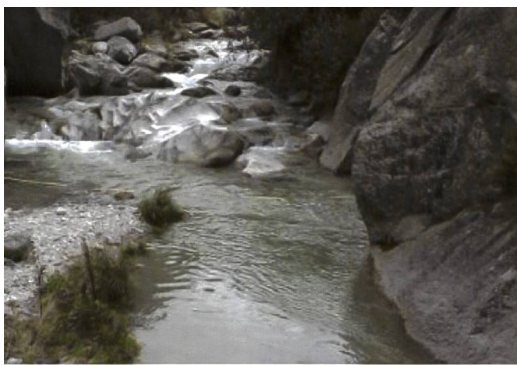
Bild 2a. Künftige Restwassersituation in der Aare unterhalb der Fassung Handeck (Dotierversuche Herbst 2008 mit einer Dotierwassermenge von rund 200 l/s).