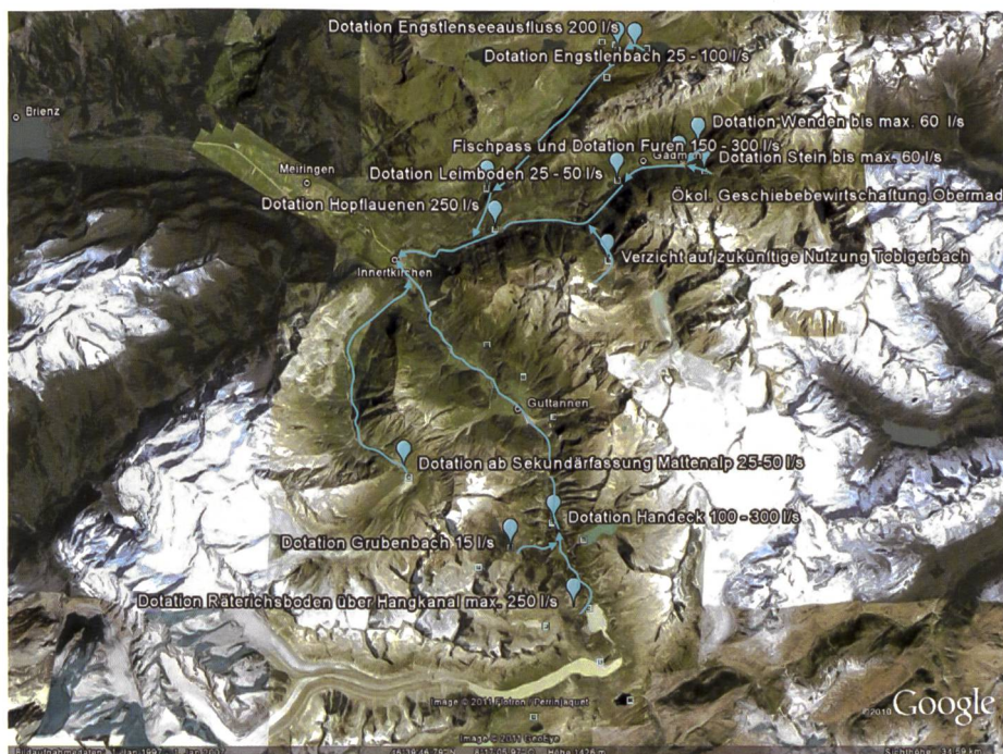
Bild 1. Die gewässerökologischen Massnahmen im Rahmen der KWO-Gewässersanierung. Die blauen Pfeile geben die Restwasserstrecken mit Dotierungen an.

Ausserdem wurde im Gremium beschlossen, dass im Rahmen der Gewässersanierung neben Restwasserdotierungen