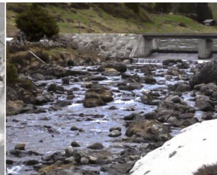
Bild 2c. Künftige Reaktivierung des Ausflusses aus dem Engstlensee.

auch Massnahmen zur Verbesserung des Geschiebehaltungs, der Durchgängigkeit und der Landschaft (Dotation Engstlenseeausfluss) umgesetzt werden. Zusätzlich wurden mit dem Fischereiverein Oberhasli weitere Massnahmen zur Förderung der heimischen Fischfauna hinsichtlich Verdriftung in das Kraftwerkssystem und bezüglich potenziellen Aufwertungsmassnahmen von zwei kleinen Aufzuchtgewässern vereinbart. Während in Tabelle 2 alle Massnahmen kurz beschrieben sind, zeigt Bild 1 die geographische Verteilung der Massnahmen und die Fotos ( Bild 2a, 2b, 2c ) zeigen die künftige Situation in den zwei Hauptgewässern des Oberhasli und die Reaktivierung des Ausflusses aus dem Engstlensee.