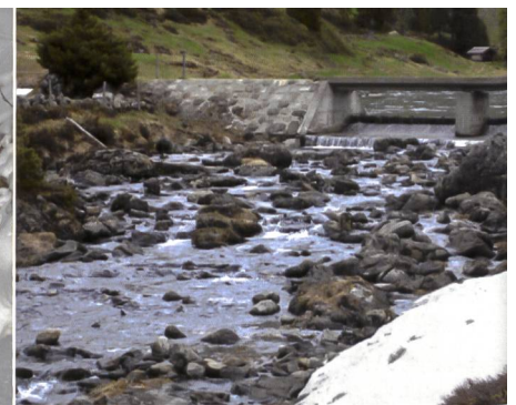
Bild 2c. Künftige Reaktivierung des Ausflusses aus dem Engstlensee.

auch Massnahmen zur Verbesserung des Geschiebehaushalts, der Durchgängigkeit und der Landschaft (Dotation Engstlenseeausfluss) umgesetzt werden. Zusätzlich wurden mit dem Fischereiverein Oberhasli weitere Massnahmen zur Förderung der heimischen Fischfauna hinsichtlich Verdriftung in das Kraftwerkssystem und bezüglich potenziellen Aufwertungsmassnahmen von zwei kleinen Aufzuchtgewässern vereinbart. Während in Tabelle 2 alle Massnahmen kurz beschrieben sind, zeigt Bild 1 die geographische Verteilung der Massnahmen und die Fotos ( Bild 2a, 2b, 2c ) zeigen die künftige Situation in den zwei Hauptgewässern des Oberhasli und die Reaktivierung des Ausflusses aus dem Engstlensee.