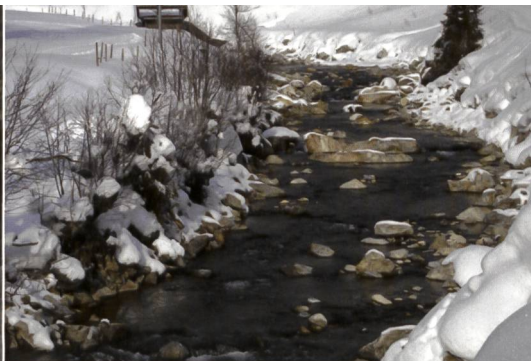
Bild 2b. Gadmerwasser im Winter 2010 mit einer geschätzten Dotierwassermenge von 150 l/s. Im oberen Bildrand ist das Wehr der Fassung Fuhren zu erkennen.