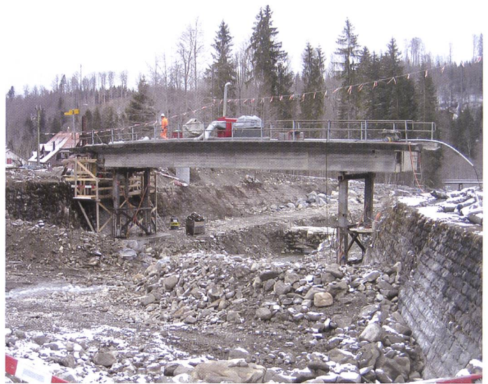
Bild 5. Die angehobene Brücke während der Betonarbeiten an den Widerlagern. Die Stahlkonstruktionen unter der Brücke dienen der Pressenführung und -stabilisierung.