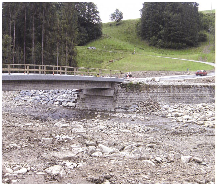
Bild 7. Stalenmoosbrücke, rechtes Ufer mit abgesenktem Überlastkorridor und Strassenwanne.