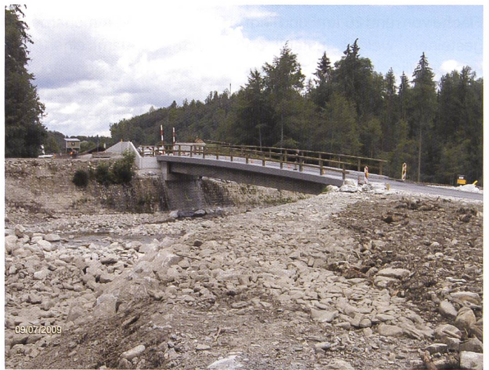
Bild 6. Stalenmoosbrücke, Blick zum linken angehobenen Ufer mit Stirnmauern für die Dammerhöhung und Dammbalkenverschluss. Der linke Schutzdamm ist auf dem Bild noch nicht geschüttet.