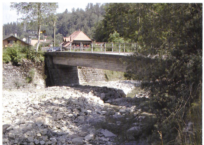
Bild 2. Brücke und linkes Widerlager von oberstrom in Fliessrichtung gesehen, im Hintergrund das Dorf Rüscheegg Heubach.