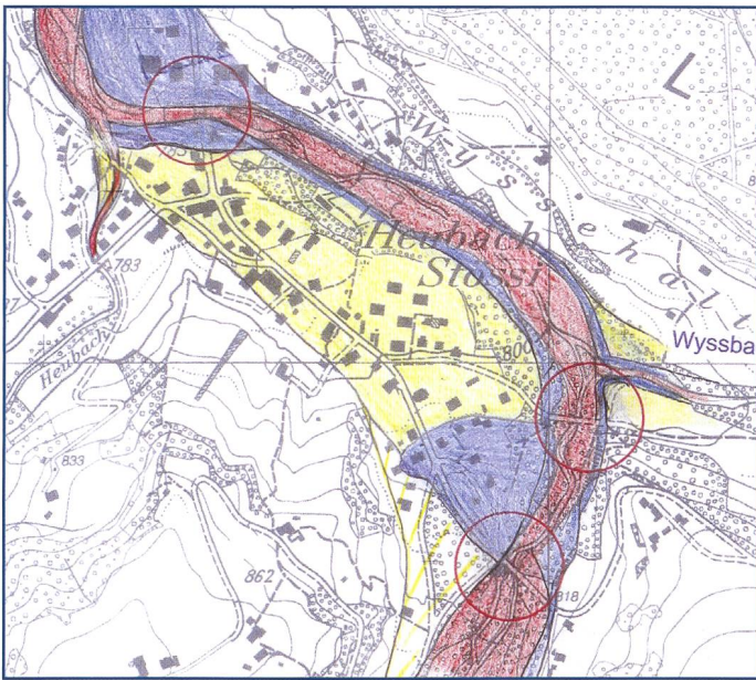
Bild 3. Ausschnitt aus der Gefahrenkarte «nach Massnahmen». Heubach wird nach Ausführung der Massnahmen bei der Brücke erst bei HQ 300 mit geringer Gefährdung betroffen (Szenario: Überströmen der Brücke mit offenem Dammbalkenverschluss).