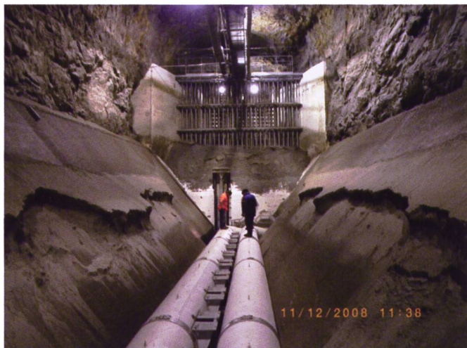
Bild 3. Liegen gebliebener Sand nach erfolgter Spülung und Absenkung des Beckens.

des Sandes in der ersten Zeit ausgetragen wird. Ca. 85% des Sandes werden in den ersten 17 Sekunden ausgetragen (bis das Spülrohr nur noch sauberes Wasser führt → entspricht einer Spülung ohne Absenken). Am Anfang ist die Sandkonzentration im Wasser jedoch noch höher. Daraus lässt sich schliessen, dass nach ca. \frac{2}{3} dieser Zeit insgesamt mehr als 75% (90% von 85%) des Sandes ausgetragen wurden.