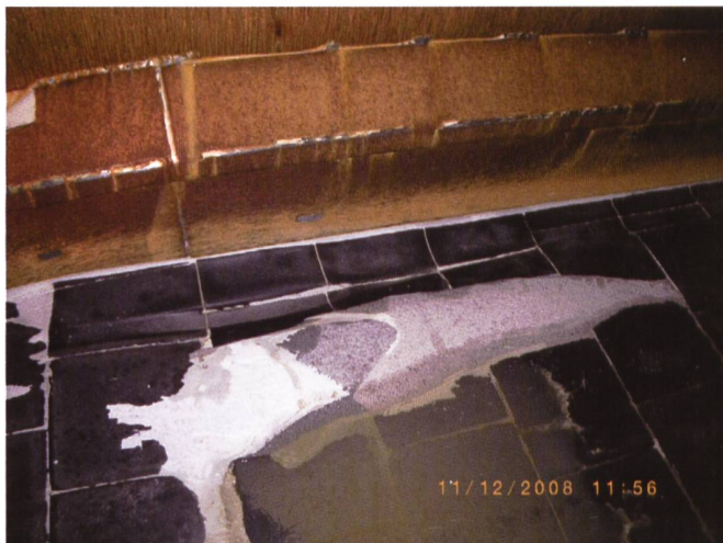
Bild 4. massiver Verschleiss an aufwändiger Basaltpanzerung.