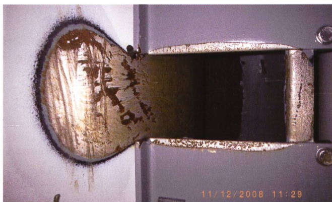
Bild 5. Verschleiss des Korrosionsschutzes am Abzugrohr System HSR.