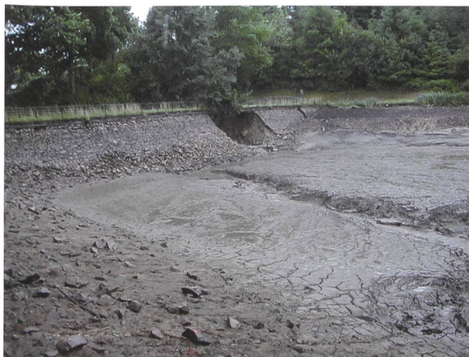
Figure 3. Barrage des Ouches ( H = 7\text{ m} , 49\,000\text{ m}^3 ), victime d'une rupture par érosion interne, deux siècles après sa construction. Il n'y a pas eu de victimes dans le village situé 4 km en aval grâce à ses petites dimensions mais aussi grâce à la présence d'esprit de l'exploitant qui a rapidement prévenu la gendarmerie qui a demandé aux personnes présentes dans les rues un dimanche matin de se mettre à l'abri.