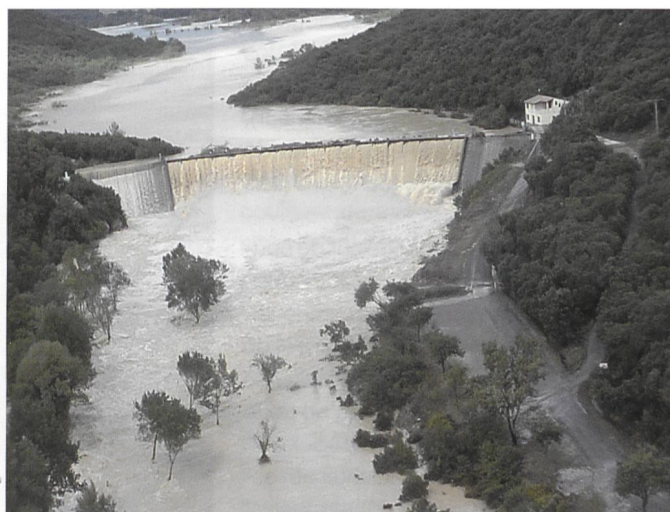
Figure 4. Barrage écreteur de crue de la Rouvière ( H = 18\text{ m} , 8,3\text{ hm}^3 ) lors de la crue du 9 septembre 2002. Ce barrage, construit en 1970, a connu ce jour là une crue supérieure à sa crue de sûreté et s'est malgré cela bien comporté.

ture des barrages et de leurs parades suffit à tirer des conclusions particulièrement intéressantes.