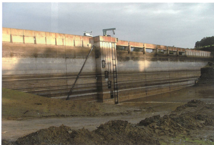
Figure 5. Parement amont du barrage de Bois Joli ( H = 24 \text{ m} , 3 \text{ hm}^3 ) lors du récent examen décennal complet.

La sûreté d'un barrage doit être périodiquement réévaluée et l'ancienne visite décennale n'était qu'un élément de cette évaluation (figure 5). L'obligation de vidange qui s'attachait jusqu'alors à la réa-