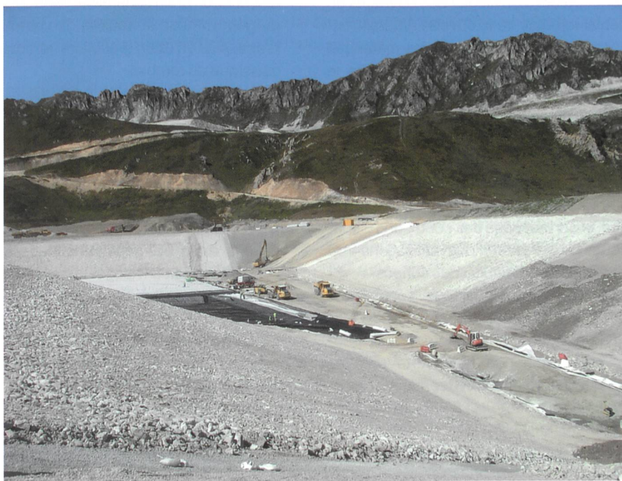
Figure 7. Chantier du barrage d'altitude des Arcs (17 m, 4000 000 m 3 ). Ici, la complexité de la géologie et le risque de développement d'une érosion interne dans des cargneules a justifié la pose d'une double géomembrane pour une grande partie de la retenue (diverses couches de cette étanchéité et de sa couverture de protection sont en cours de pose).

Ces barrages sont de faible hauteur, entre 4 et 17 m, la moyenne étant de l'ordre de 10 m. Construits dans des sites escarpés, ils ne stockent que de faibles volumes, entre 5000 et 400 000 m 3 , la moyenne étant de l'ordre de 50 000 m 3 . Ce sont donc des ouvrages de classe C et D pour la très grande majorité. L'inquiétude des responsables de stations confrontés au manque de neige a parfois conduit à privilégier des travaux menés à bon rythme