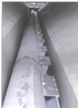
Neuanlage, Burglauenen (JB)

Engineering, patentierte Abzüge, Spülschieber, Sedimentmessungen, Beruhigungsrechen