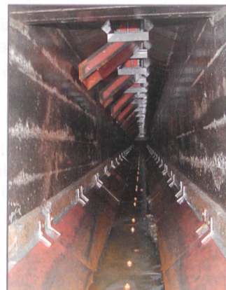
Umbaulösung WF Tantermozza (EKW)