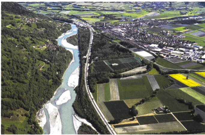
Bild 2. Vielfältige und landschaftlich attraktive Strukturen wie in den Mastriser Rheinauen sind Voraussetzung für die nachhaltige Sicherung von gewässertypischen Lebensgemeinschaften und können gleichzeitig wertvolle Naherholungsgebiete sein.