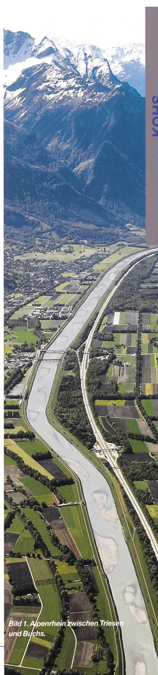
Bild 1. Alpenrhein zwischen Triesen und Buchs.

Zur Erreichung der Ziele des Entwicklungskonzeptes Alpenrhein ist die Solidarität und Allianz aller Bewohnerinnen und Bewohner des Alpenrheintales sowie der Staaten, Länder und Kantone erforderlich. Entscheidend für die Umsetzung ist der Wille zum gemeinsamen, grenzüberschreitenden, koordinierten Handeln. Dieser Einsatz von Seiten der Politik, der Behörden und jedes Einzelnen lohnt sich für uns, für die nachfolgenden Generationen und für den Lebens- und Wirtschaftsraum «Alpenrheintal».