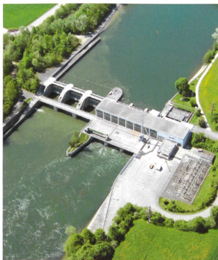
Bild 1. Kraftwerk Flumenthal.

Massgebend für den Vergabeentscheid waren das gute Preis-/Leistungsverhältnis und die Fachkompetenz von Rittmeyer für komplexe Regulierautomatiken bei Flusskraftwerken. Die Realisierung erfolgt im Zeitraum zwischen 2006 bis 2009.