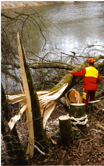
Bild 1. Diese Raubbaumgruppe im Unterwasserkanal des Kraftwerks Rapperswil wird auch dem Hochwasser standhalten. Der geringe Mehraufwand für das Anbinden mit einem Sisalseil lohnt sich (Foto: H. Dorer).