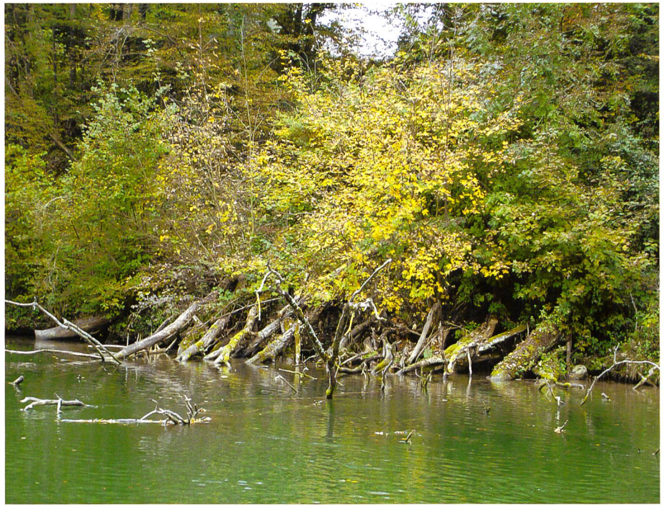
Bild 2. Mit dem Anlegen der Raubäume wird gleichzeitig auch die Verjüngung der vielfach überalterten Uferbestockungen eingeleitet. Nach wenigen Jahren gestaltet sich um die Raubäume eine üppige Vegetation, die das Wegschwemmen der Bäume zusätzlich verhindert (Foto: U. Fischer).

August 2005 bestens bewährt. Nach drei bis vier Jahren verliert der Raubaum seine wertvollsten Funktionen. Es bleibt ein im Sand eingeschwemmter Stamm, der auch den folgenden Hochwassern standhält und im Hinterwasser willkommene Strömungsveränderungen bietet.