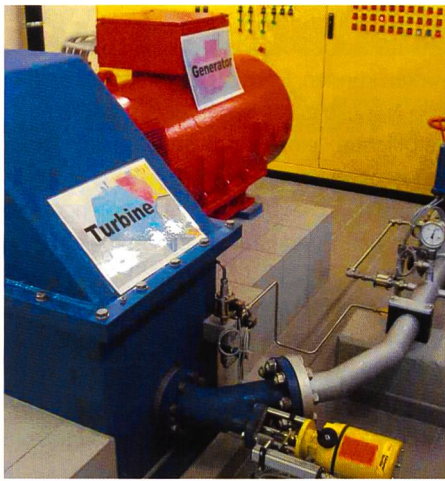
Bild 3. Mit der 300-kW-Turbine und dem angeschlossenen Generator werden jährlich über 1 Mio. kWh Ökostrom produziert.

Stromverbrauchs für öffentliche Aufgaben der Gemeinden ausmacht. Umso interessanter ist die Erkenntnis aus zahlreichen Energieanalysen, dass der Stromverbrauch einer Wasserversorgung durch verschiedene Massnahmen um 20 bis 30% reduziert werden kann.»