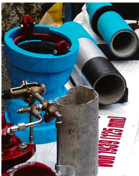
Bild 2. Vor über 65 Jahren wurden die Trinkwasserleitungen aus Eternit (Vordergrund) erstellt. 2004 erfolgte der Bau der Ersatzdruckleitung, die aus beschichteten Gussrohren besteht.

bei der Planung. Wir haben es hier mit einem Ultrahochdruck-Kraftwerk zu tun. Der Wasserstrahl trifft beispielsweise mit 130 m/s auf die Turbinenschaufeln. Weil dieses Projekt durch seine besonderen Merkmale Pilotcharakter aufwies und spezielle Vorkehrun-