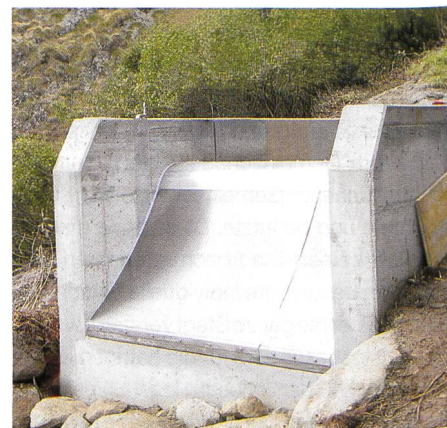
Bild 2. Fassungsschacht samt Rechen unmittelbar nach der Fertigstellung.

Die Bauarbeiten wurden einer ortsansässigen Bauunternehmung übertragen. Die Montage des Rechens und der Abschlussorgane führte das Betriebspersonal der Gommerkraftwerke aus. Die Bauarbeiten wurden im August/September 2003 ausgeführt. Die Bauzeit, inkl. Montage des Rechens und der Abschlussorgane, betrug vier Wochen. Da