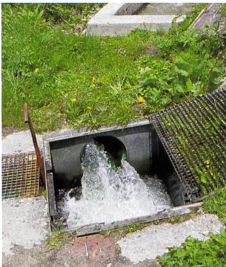
Bild 1. Der alte Einlaufschacht mit vertikalem Gitterrost.

Die Aufgabe war, mit einfachen baulichen Massnahmen Kies und Grobsand abzuscheiden. Gemäss anfänglicher Projektidee sollte ein konventioneller Kies- und Grobsand-Abscheider erstellt werden. Dazu hätte beim Eintritt in die Rohrleitung ein neuer Rechen (Stabrechen) gehört. Der Betriebsleiter der Gommerkraftwerke AG machte jedoch den Vorschlag, auf einen konventionellen Kiesabscheider zu verzichten und stattdessen einen Coanda-Feinrechen zu erstellen.