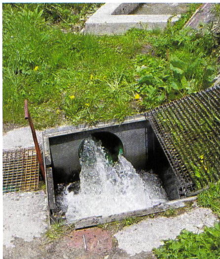
Bild 1. Der alte Einlaufschacht mit vertikalem Gitterrost.

Die Aufgabe war, mit einfachen baulichen Massnahmen Kies und Grobsand abzuscheiden. Gemäss anfänglicher Projektidee sollte ein konventioneller Kies- und Grobsand-Abscheider erstellt werden. Dazu hätte beim Eintritt in die Rohrleitung ein neuer Rechen (Stabrechen) gehört. Der Betriebsleiter der Gommerkraftwerke AG machte jedoch den Vorschlag, auf einen konventionellen Kiesabscheider zu verzichten und stattdessen einen Coanda-Feinrechen zu erstellen.