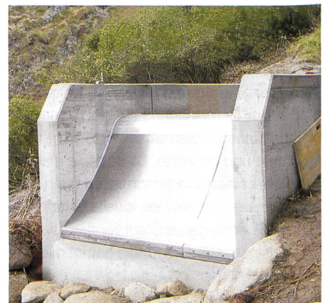
Bild 2. Fassungsschacht samt Rechen unmittelbar nach der Fertigstellung.

Die Bauarbeiten wurden einer ortsansässigen Bauunternehmung übertragen. Die Montage des Rechens und der Abschlussorgane führte das Betriebspersonal der Gommerkraftwerke aus. Die Bauarbeiten wurden im August/September 2003 ausgeführt. Die Bauzeit, inkl. Montage des Rechens und der Abschlussorgane, betrug vier Wochen. Da