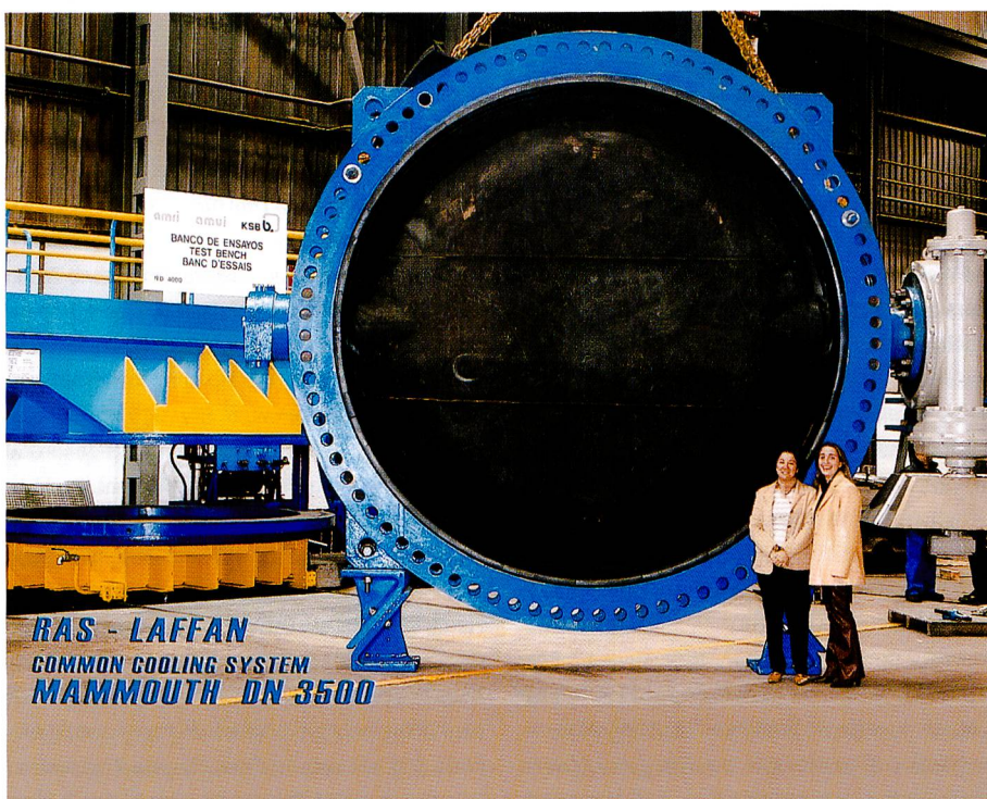
Bild. Absperrklappen mit einem Innendurchmesser von 3500 mm.