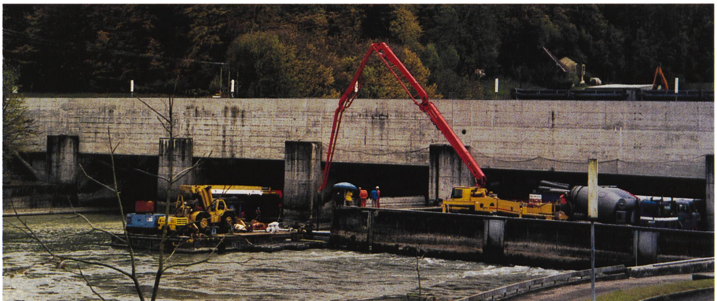
Bild 3. Die Betonierinstallationen im Unterwasser.