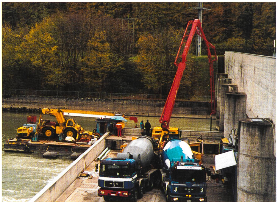
Bild 2. Während der Betonierarbeiten.

Die Dosierung betrug in beiden Fällen 40 kg pro m 3 Beton. Die Prüfung ergab für den erstgenannten Fasertyp eine höhere Biegezugfestigkeit. Demzufolge und wegen der viel höheren Faserkonzentration (bei gleichem