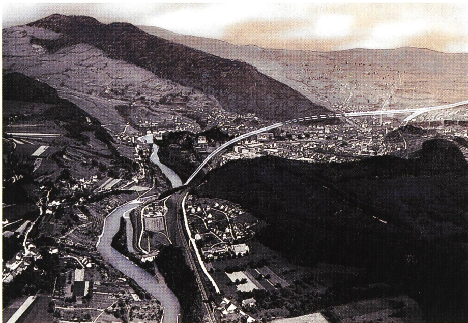
Bild 1. Verlauf des Umgehungskanals von Baden. Um die Gefällsstufe zwischen dem Kraftwerk Kappelerhof (vorne links) und dem Haselfeld (rechts, Bildmitte) zu überwinden, war eine «Schleusentreppe», bestehend aus zwei hintereinander geschalteten Schleusen, vorgesehen. Auf dem Wettinger Feld (rechts im Hintergrund) ist eine Kanalabzweigung sichtbar, die zu einem neu zu erstellenden Kraftwerk Aue geführt hätte (retouchiertes Luftbild, 1924).

Umgehungskanal für die Schifffahrt bei Baden, aus der Vogelschau, Var. VIII.