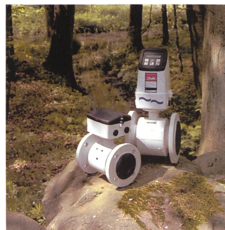
Bild 2. Der Durchflussmesser MAG 3100 Wasser mit Nennweiten von DN 25 bis DN 1200 und einem Dynamikbereich von 1:3000 misst auf 0,25 % vom Messwert genau.