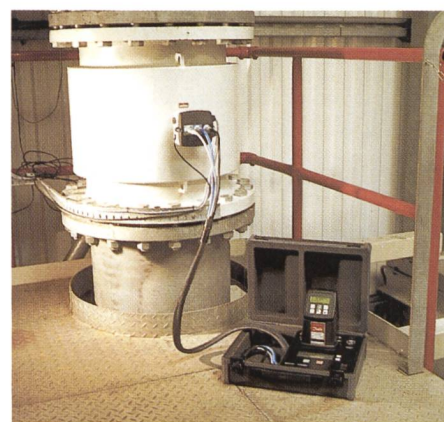
Bild 1. Die Überprüfung des angeschlossenen Magflo ® -Messumformers und Durchfluss-Messaufnehmers mit dem Verificator dauert nur 15 Minuten. Die Speicherkapazität reicht für die Prüfung von maximal 20 Geräten. Spätestens dann muss man die Messdaten herunterladen.

Durch einen Test mit dem neuen Verificator lassen sich die Einstellungen des Durchflussmessers sehr genau dokumentieren: Sind sie gleich wie bei der Kalibrierung des