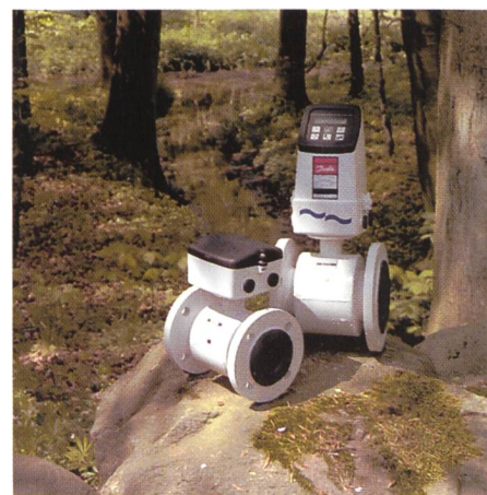
Bild 2. Der Durchflussmesser MAG 3100 Wasser mit Nennweiten von DN 25 bis DN 1200 und einem Dynamikbereich von 1:3000 misst auf 0,25 % vom Messwert genau.