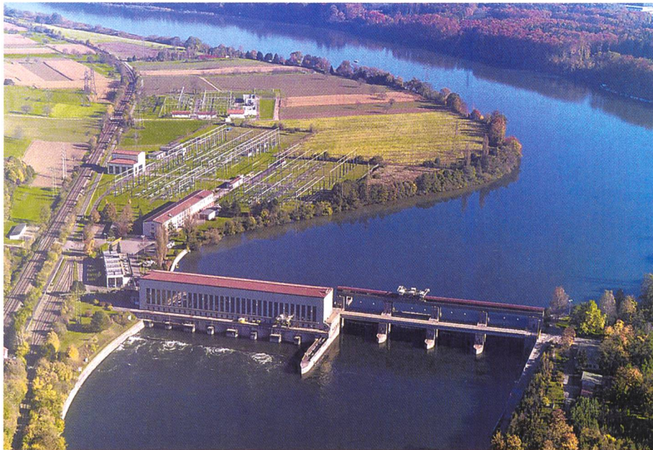
Bild 1. Flugaufnahme des Kraftwerks Ryburg-Schwörstadt.